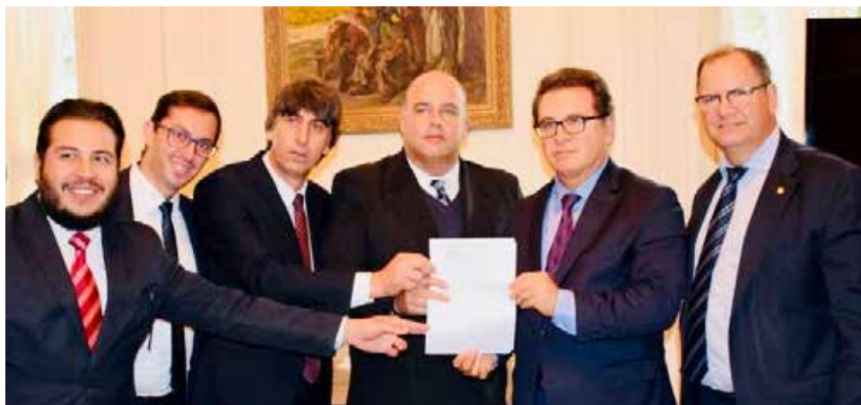
Comitiva torrense com ministro do Turismo, Vinícius Lummertz, e deputado Alceu Moreira