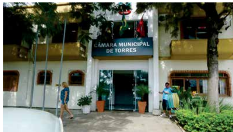
Fachada da Câmara de Torres

lhamos (publicamente) somente um dia por semana e se briga por 10 minutos de espaço para as falas, quando única coisa que é de suma importância no legislativo é falar" disse. "Parlar é falar e acho que é pouco nosso tempo, portanto peço que a sociedade se manifeste, para que nós trabalhe-mos mais do que uma sessão por semana", encerrou.