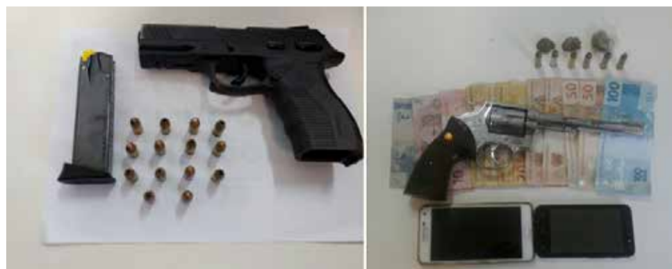
Armas e drogas foram apreendidas com os presos

Assim, os policiais deslocaram-se até o local indicado, e fizeram averiguação. Lá, foi abordado L.M.S. - tentando pular o muro dos fundos da residência. Em revista, foi encontrado com o mesmo um Revolver cal 38, carregado com 06 munições