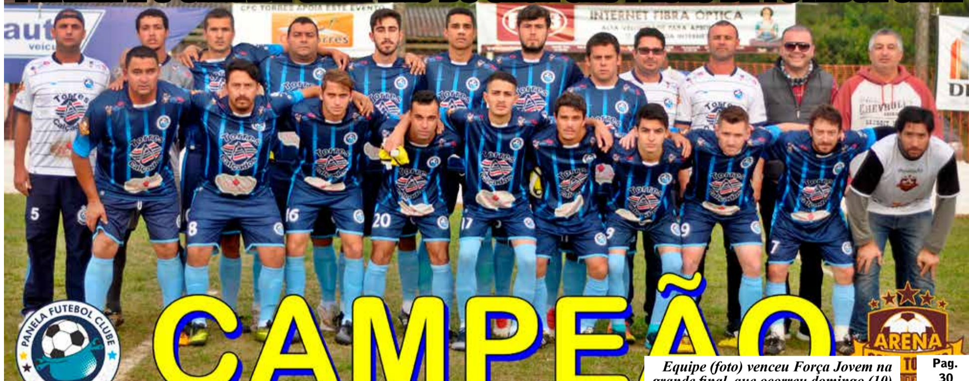
Equipe (foto) venceu Força Jovem na grande final, que ocorreu domingo (10) Pag. 30

PANELA É O GRANDE CAMPEÃO DO CASA SÃO PAULO DE FUTEBOL SETE