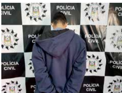
Suspeito foi preso traficando perto de escola