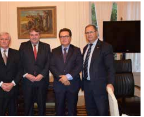
Prefeito e secretário de Arroio do Sal, com deputado Alceu Moreira e Ministro Vinicius Lummertz

A apresentação foi elogiada pelo Ministro que