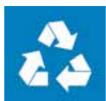
Triagem do Lixo