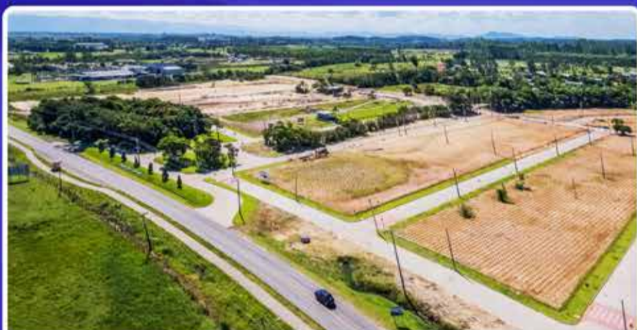
Loteamento planejado de alto padrão em Passo de Torres - Sem custo de condomínio