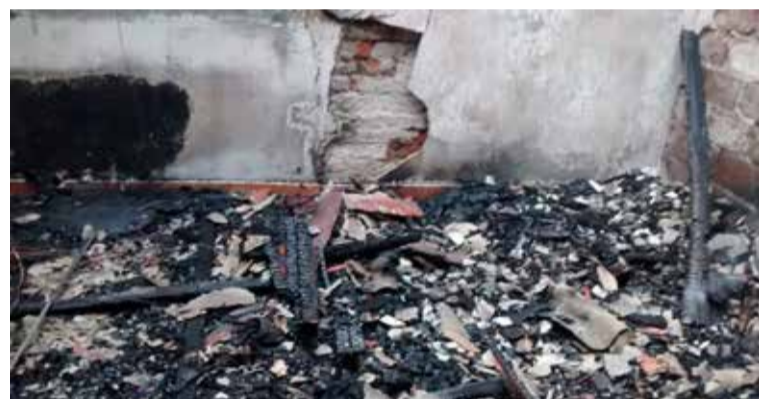
Casario histórico incendiado