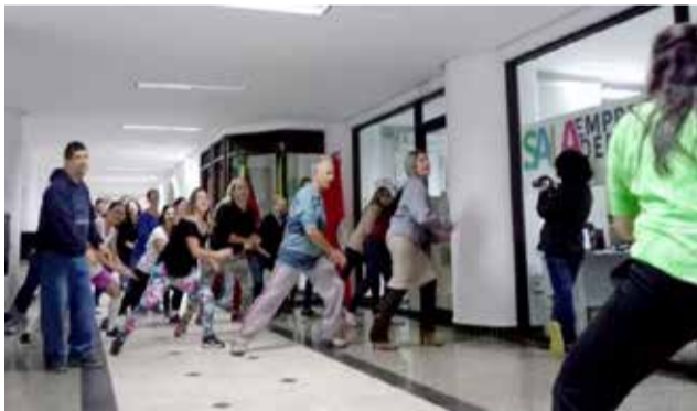
Na Prefeitura de Torres, pessoal também participou

Neste ano, 492 municípios do Rio Grande do Sul participaram do Dia do Desafio 2018, realizado nesta quarta-feira (27/06). No estado, o evento contou com cerca de 3 milhões de participantes em atividades de estímulo à prática sistemática de atividades físicas.