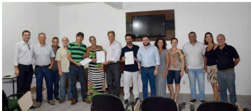
Deputado Alceu Moreira (c), juntamente com lideranças do MDB e representantes da APAE de Torres

Na busca de garantir a qualificação e a melhor infraestrutura para as APAEs do Litoral Norte, o deputado federal Alceu Moreira (MDB) viabilizou junto ao Governo Federal um total de R$ 1,2 milhão. Os recursos serão investidos no custeio da instituição e na compra de veículos e equipamentos. Já foram garantidos os valores para as unidades dos municípios de