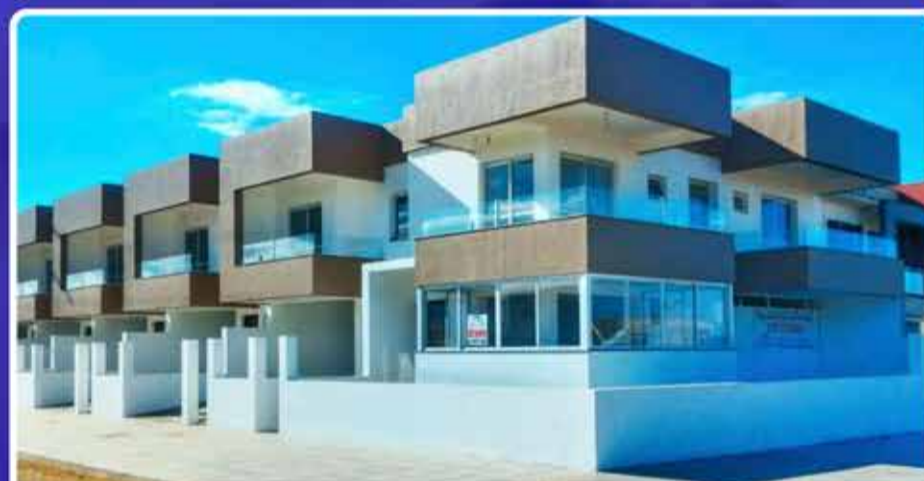
02 Dormitórios c/ Suíte + Vaga de Garagem

TERRENOS À PARTIR DE 95 MIL - PARCELADO NO BOLETO