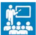
Incentivo e Capacitação as MPEs