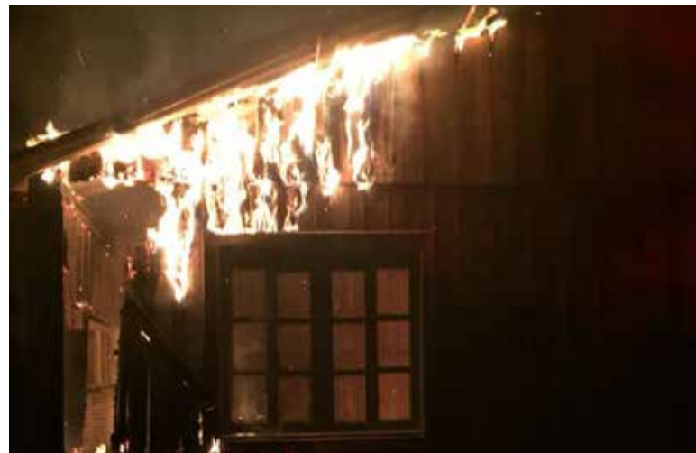
Imagem do incêndio no Bairro São Jorge

Ao todo, foram quatro sinistros em menos de 24 horas. Ainda assim, as informações dão conta que nenhuma pessoa teria sido vitimada pelas chamas de cada um destes casos - foram apenas danos materiais.