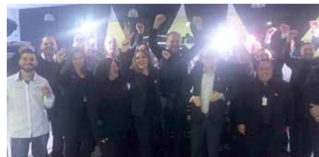
Equipe da Marauto está na ponta das vendas na região e no Brasil

Durante a fase de homologação e testes do X80 para adequação às condições brasileiras, o veículo rodou nos mais variados climas e em diferentes condições de piso por mais de 200 mil km no Brasil e na China, sendo submetido em algumas ocasiões a condições extremas de frio e calor. Tem papel decisivo na agradável experiência de conduzir o Lifan X80 as suspensões McPherson na dianteira e independente tipo multi-link na traseira, com a direção eletro-assistida (EPS) com ajuste de altura e profundidade, o que permite ao motorista ajustar a posição de dirigir de acordo com sua conveniência. O