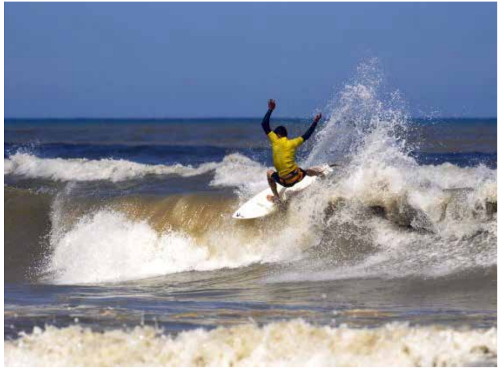
Campeonato de surf realizado ano passado no município de Arroio do Sal