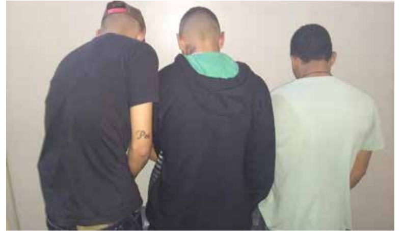
Os três presos durante a ação