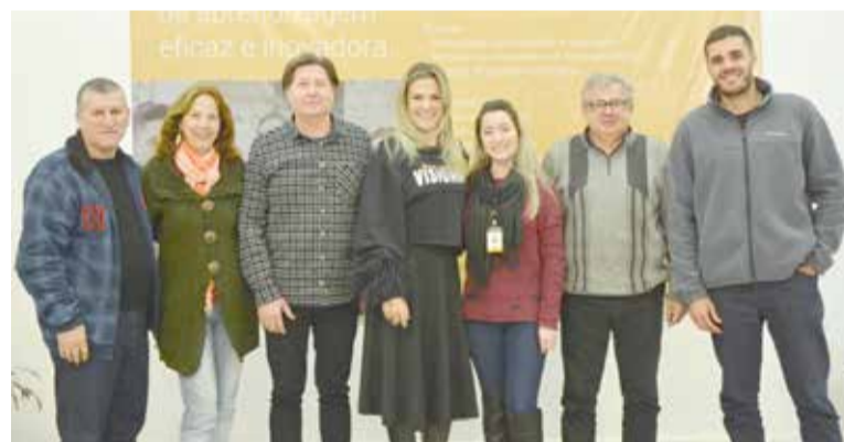
Parte do corpo docente que participou da tradicional capacitação

semestre, avaliarmos o nosso trabalho e compartilharmos experiências para melhor atender a comunidade acadêmica e comunidade externa".