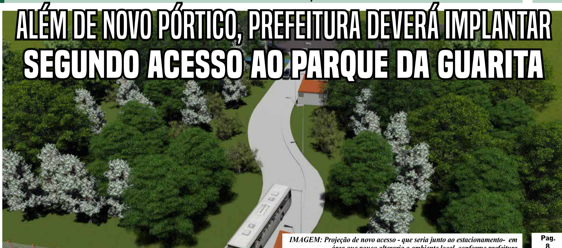
IMAGEM: Projeção de novo acesso - que seria junto ao estacionamento- em área que pouco alteraria o ambiente local, conforme prefeitura