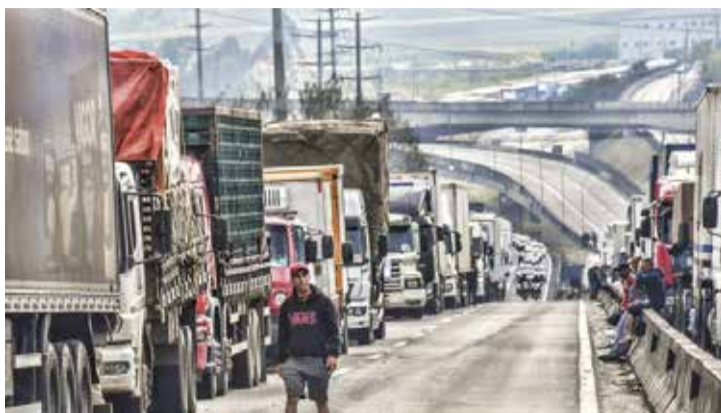
Greve dos caminhoneiros e Copa do Mundo são fatores importantes no efeito de diminuição da demanda local