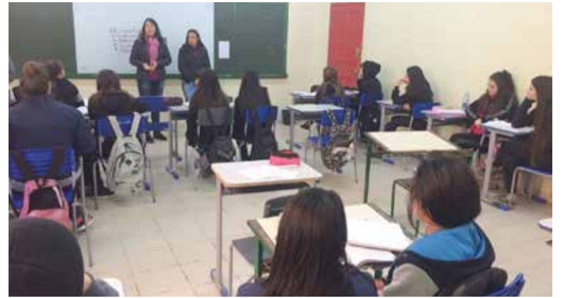
Projeto está também sendo apresentado nas escolas

Placas informativas também serão colocadas na Praça dos Pescadores, na rótula da ponte de concreto, na Câmara de Vereadores e na frente da APAE. Já o carro da Apae e o ônibus escolar receberão adesivo perfurado com mensagens alusivas à prevenção. A APAE de Passo de Torres também elaborou um folheto informativo com orientações e dicas de cuidados, medidas e hábitos saudáveis para evitar a ocorrência de deficiências. Os folhetos estão sendo distribuídos para as pessoas da comunidade nas diversas ações do Projeto Prevenir.