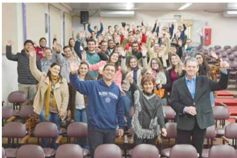
Diretoria da Ulbra Torres com servidores