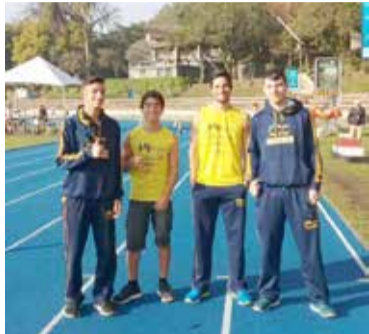
Atletas que participaram da corrida na Sogipa

Os atletas agora se preparam para a Corrida do Circuito Sesc Etapa Guaíba onde vão para se manterem bem colocados no ranking.