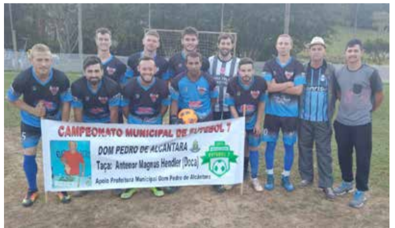
Equipe do Mata Boi (foto) goleou e agora jogará às semifinais

A sétima rodada foi a última da fase de classificação, e definiu os quatro semifinalistas: Cruz Vermelha (em 1º), Floresta (2º) Aimoré (3º) e Mata Boi (4º). No próximo domingo, dia 22, acontecem as semifinais do campeonato. As partidas são realizadas no campo do Osni, na comunidade de Arroio dos Mengues. O primeiro confronto das semifinais será entre Floresta X Aimoré, às 15 horas; o segundo confronto é entre Cruz Vermelha X Mata Boi, às 16 horas.