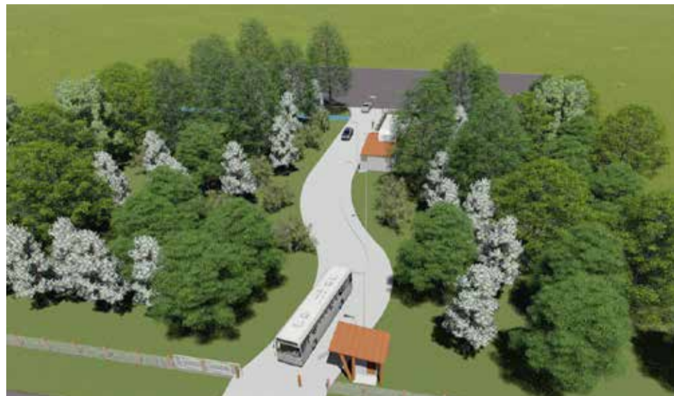
IMAGEM: Projeção de novo acesso - que seria junto ao estacionamento - em área que pouco alteraria o ambiente local, conforme prefeitura

Vários laudos técnicos foram elaborados para a concretização destas obras, como o estudo ge-