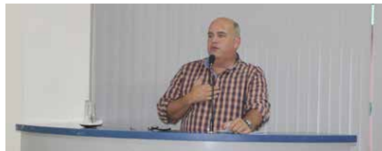
Gimi reclamou de omissão de socorro o erro do médico de plantão

salas de espera por muito tempo, junto a muitas pessoas, quando já estava com Tuberculose. Consequentemente, expôs outros ao vírus.