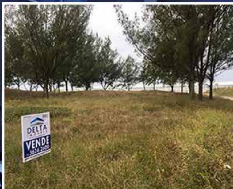
02 Terrenos 12x25, 50m do mar

OBS: OS VALORES DESTAS OFERTAS ESTÃO SUJEITAS A ALTERAÇÕES