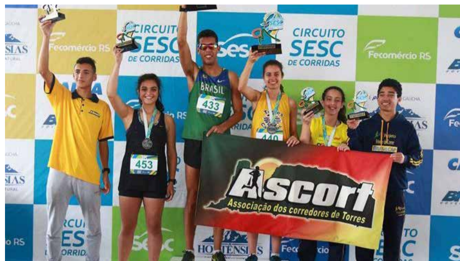
Em Torres, Ascort dominou pódio nos 3km geral feminino e masculino

A equipe torrense Ascort (Associação dos Corredores de Torres) participou da 16ª etapa do Circuito Sesc de Corridas 2018, que aconteceu dia 30 de setembro em Torres, reunindo cerca de 500 atletas. A prova foi classificatória para a final estadual, que também ocorrerá na cidade, no dia 2 de dezembro. "A prova teve um nível técnico excelente, com isto deixando-a bastante disputada.