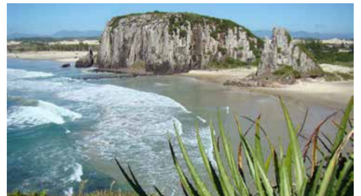
Cânions e Guarita (em Torres) se interligam em roteiro turístico-geológico-cultural estudado em sala de aula