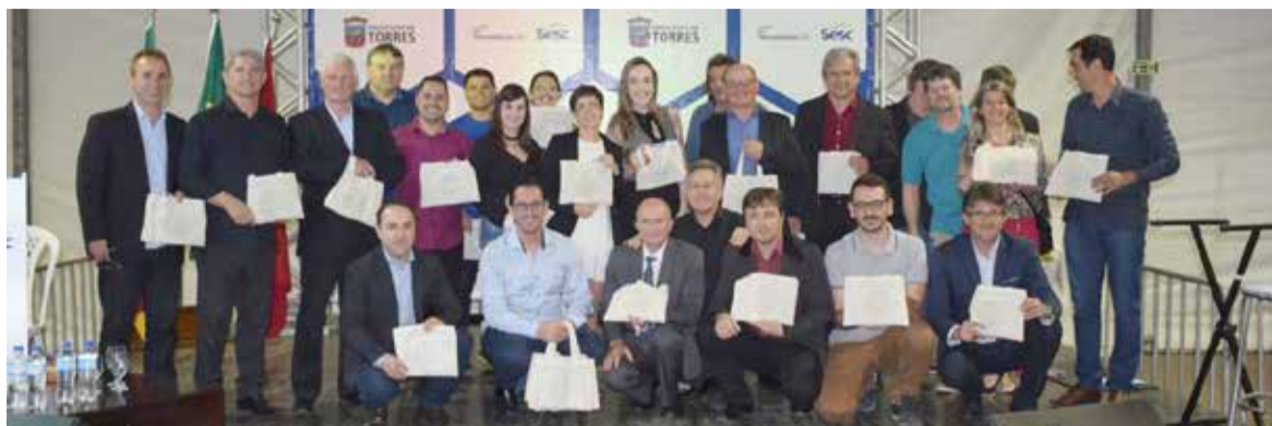
Representantes das prefeituras dos municípios que integram Rota Caminho dos Vales e das Águas reunidos

Cerca de 650 pessoas prestigiaram o evento, que contou com a presença dos Prefeitos dos municípios, Secretários e Chefes de Departamento Municipais, Vereadores e comunidades, com empreendedores e entidades representativas. Após o lançamento, outras etapas estão sendo planejadas pelo Grupo de Trabalho dos 9 municípios.