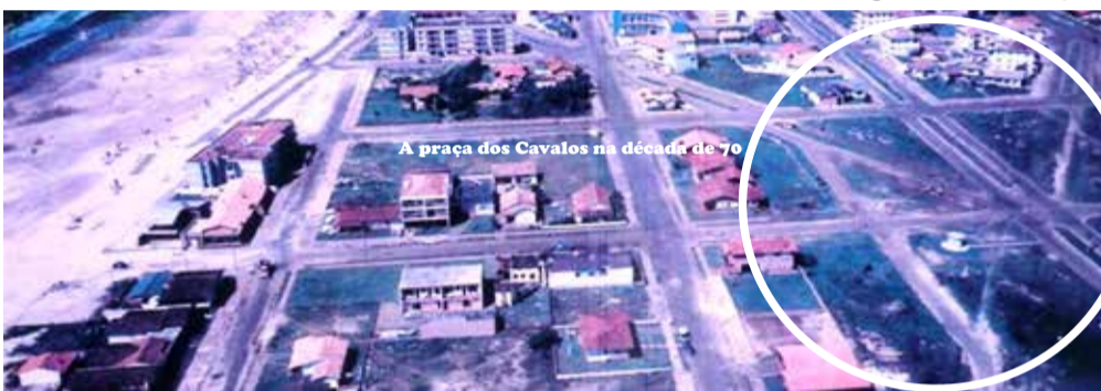
A praça dos Cavalos na década de 70

Alguns exemplos desse investimento privado no fomento do turismo são o Vinodeiro (Festival de Vinho e Cordeiro), no ano passado, o letreiro turístico da prainha, o evento MaraTorres, neste ano, todos promovidos pela ACTOR (Associação dos Construtores de Torres) e, aparentemente, com o “apoio” da prefeitura. A feira do Livro,