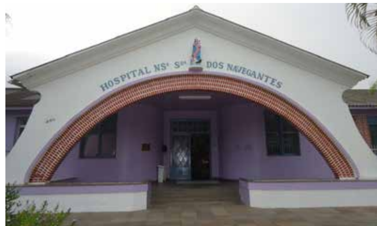
Fachada do Hospital de Torres