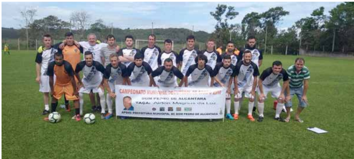
Equipe do Mata Boi: dois jogos e duas vitórias

No último dia 14 de outubro, aconteceu a segunda rodada do Campeonato Municipal de Futebol de Campo em Dom Pedro de Alcântara. Duas partidas foram realizadas no campo do Horizonte, no centro do município.