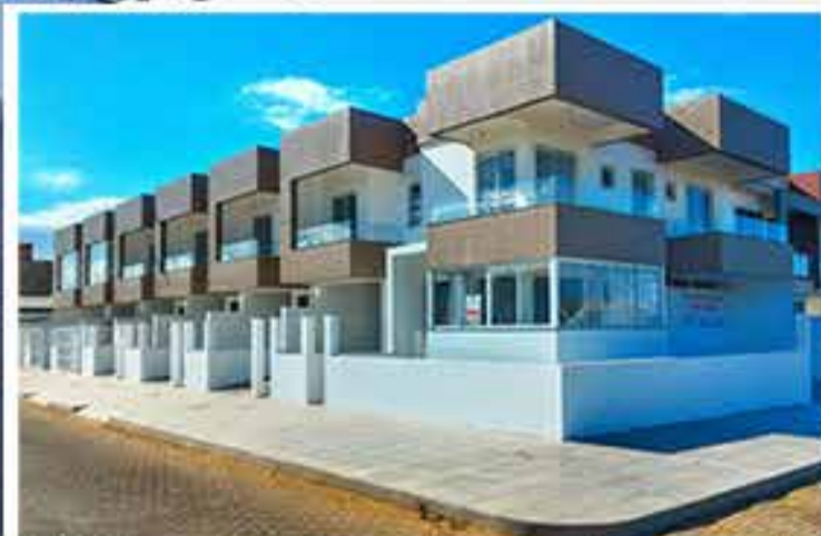
02 Dormitórios c/ suite + vaga de garagem Prontos para morar

Apartamento no centro; Dois dormitórios c/garagem, sala, cozinha, banheiro, área de serviço, fica semi-mobiliado por R$. 275.000,00. Imóvel junto a tudo que usamos no dia - dia.