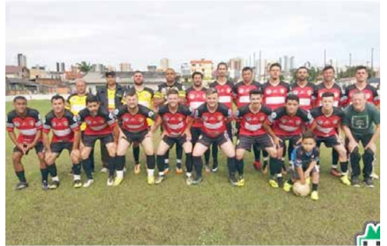
Equipe titular do Adescom venceu sua partida

• NO BAIRRO SÃO JORGE, O E.C. São Jorge recebeu a equipe do E.C. São Miguel. ASPIRANTE = São Jorge 0 x 1 São Mi-