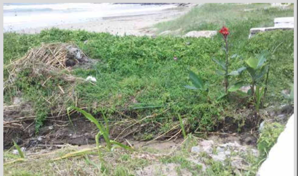
Esgoto sai do parque da Guarita, corre pelo meio fio e desemboca no mar (foto).

Não se pode deixar criar despejo de esgoto no ambiente sem ser tratado, principalmente quando ele chega ao mar. Além dos SÉRIOS problemas de Saúde, a contaminação de água em praia expulsa turista que, por nojo, talvez nunca voltem. Olho no lance!