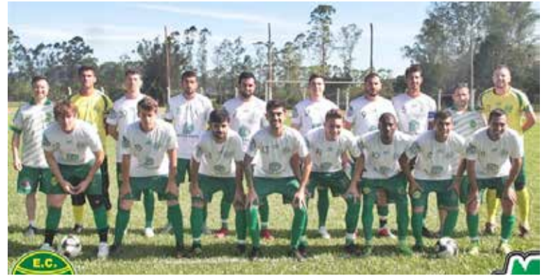
Formações aspirante do Guarani (e) e titular do São Miguel (d) venceram jogo da ida na semi

****Na VILA SÃO JOÃO, a S.E. São João recebeu o E.C. Mar Azul.