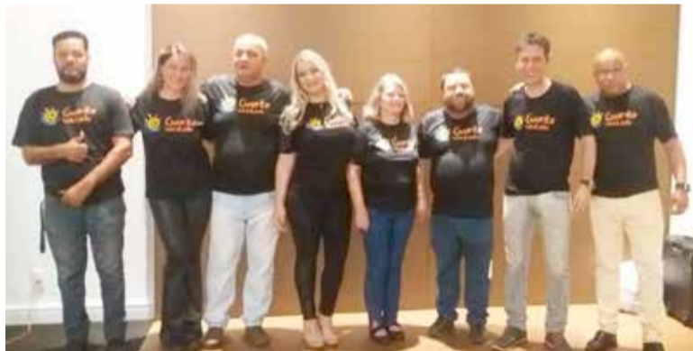
Equipe da Guarita Web Rádio reunida

A cidade de Torres conta a partir de agora com uma emissora de rádio online 24 horas. A Web Rádio Guarita foi apresentada oficialmente no dia 30 de outubro a empresários, amigos e autoridades em um happy hour de lançamento. E na última segunda-feira, dia 5 de novembro, iniciou sua transmissão para todo o mundo através de WEB.