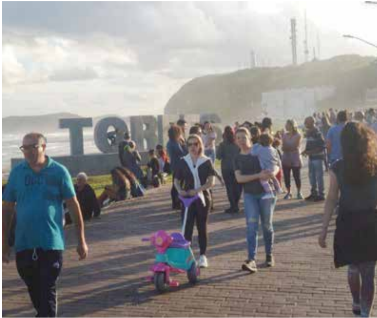
Monumento Torres, em meio ao movimento do final de semana

De acordo com a posição da prefeitura de Torres, o local está apropriado e com a obra ainda é possível aos tor-