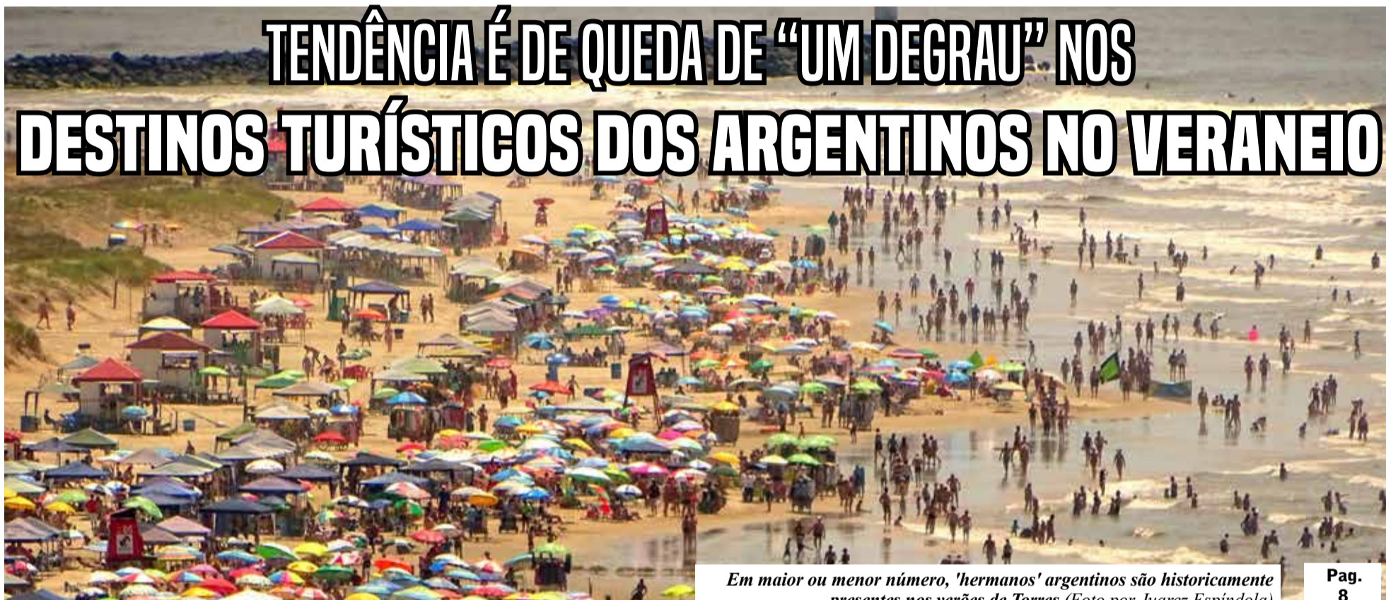
Em maior ou menor número, 'hermanos' argentinos são historicamente presentes nos verões de Torres