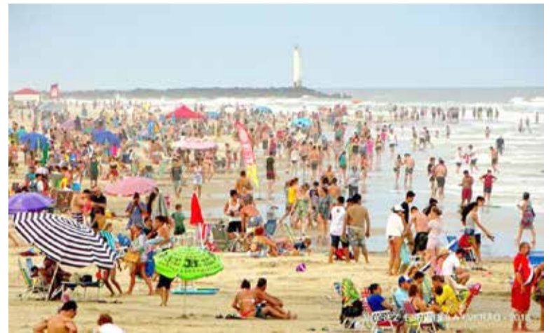
Em maior ou menor número, 'hermanos' são historicamente presentes nos verões de Torres

para o nordeste brasileiro vai ficar no Rio de Janeiro; quem quiser ir ao Rio e não tiver dinheiro suficiente pode escolher Florianópolis. e assim por diante, de Florianópolis para o norte do RS”, sentencia a reportagem. “A desvalorização é uma oportunidade para o Brasil”, projeta a tendência do turismo dos “Hermanos” no verão conforme estudo feito pelo jornal portenho Clarín.