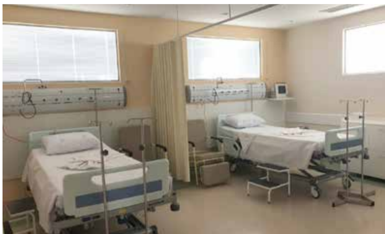
Após reforma da UTI do Hospital Navegantes, espaço agora está apto para ter o dobro de leitos

O corpo técnico do Hospital Nossa Senhora dos Navegantes (HNSN, em Torres) esteve