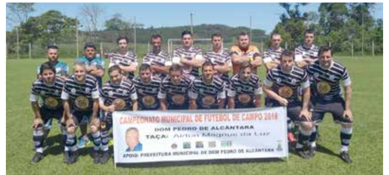
11/11 - em Porto Colônia (Baixada dos Eucaliptos)