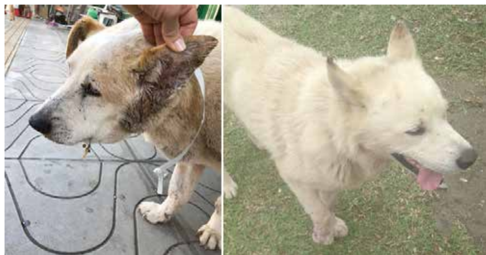
O cão Alemão, resgatado com muita dor e bicheiras nos ouvidos, recebeu atendimento veterinário e medicação