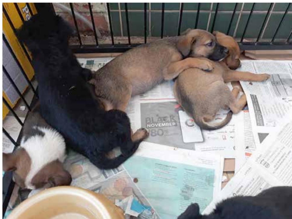
Brechó terá também feirinha de adoção