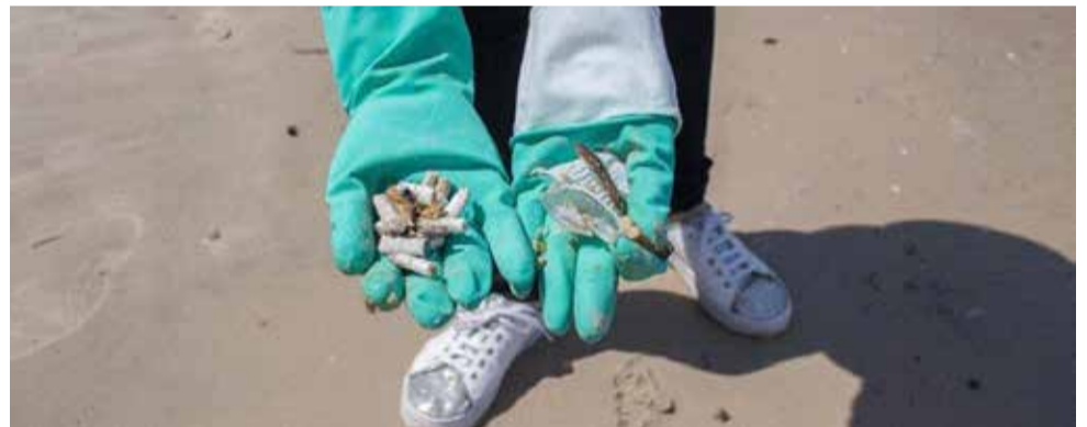
Bitucas estão entre os resíduos mais encontrados nas praias

30 minutos. Destacaram-se as bitucas de cigarro (encontradas em grande quantidade), embalagens plásticas e até alguns resíduos inusitados como uma "grelha de alumínio" e uma "peça de suspensão automotiva".