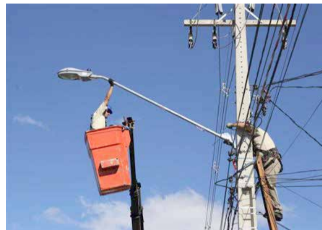
Imagem meramente ilustrativa.

Uma emenda apresentada por vereadores da oposição e aprovada junto com o projeto limita o pagamento da prestação de serviço extraordinário e gratificação dos servidores a, no máximo, 50% do salário mensal. Isto foi feito para que não fosse criada uma espécie de brecha para que pessoas retirassem remuneração adicional sem limites.