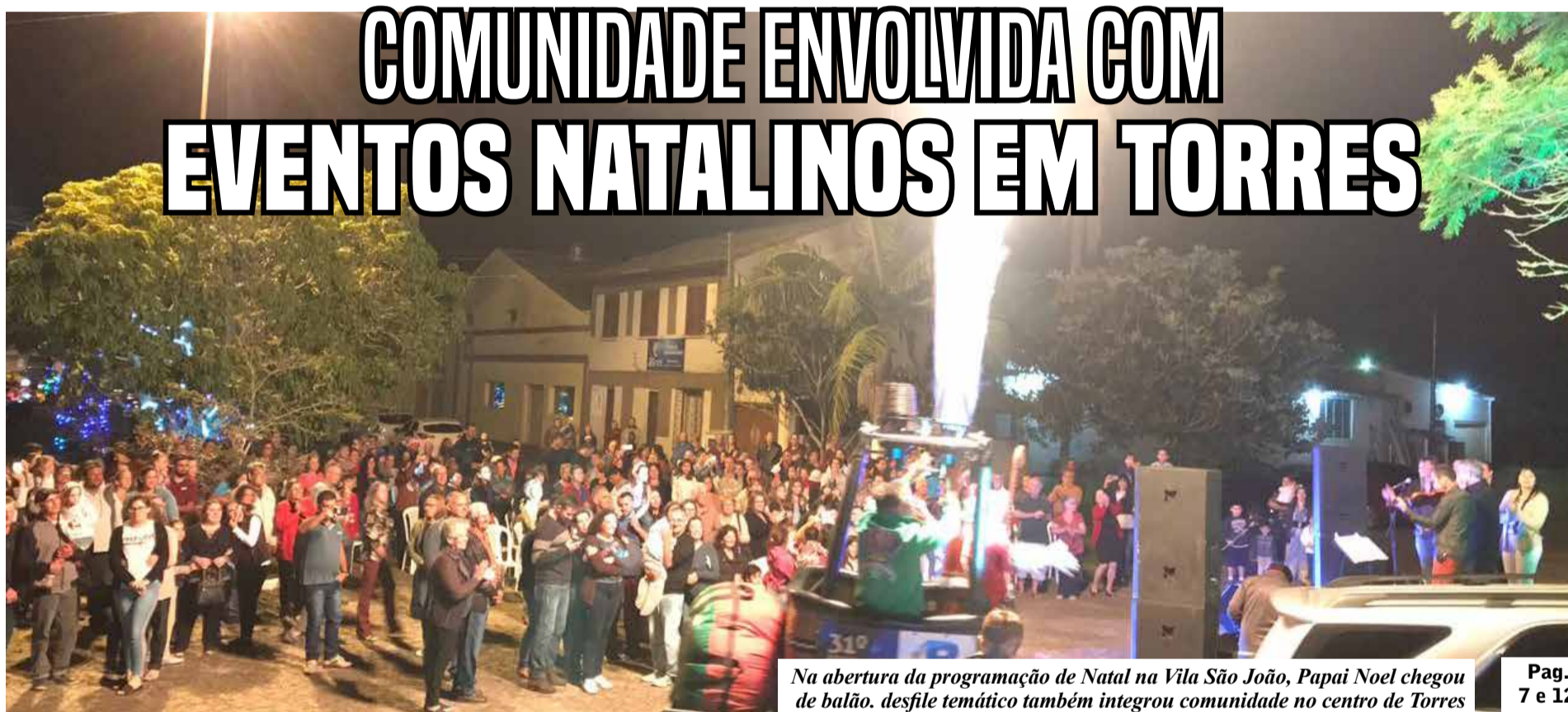
Na abertura da programação de Natal na Vila São João, Papai Noel chegou de balão. desfile temático também integrou comunidade no centro de Torres