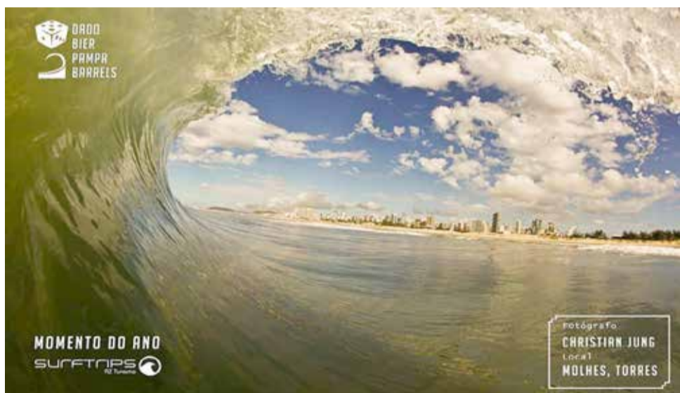
Foto de Chistian Jung na Praia dos Molhes - uma das concorrentes na categoria 'Momento do Ano'

Idealizado e gerido pelo surfista gaúcho Thiago Rausch, o campeonato interativo Pampa Barrels tinha premiação marcada para a noite de quinta-feira, 6 de dezembro, no Royal Black Pub, da Dado Bier Bourbon Country, a partir das 19h30min. Na busca por valorizar e difundir o surfe do Rio Grande do Sul, o campeonato consiste em premiar surfistas que tiveram imagens captadas surfando tubos. Uma votação escolhe o vencedor.