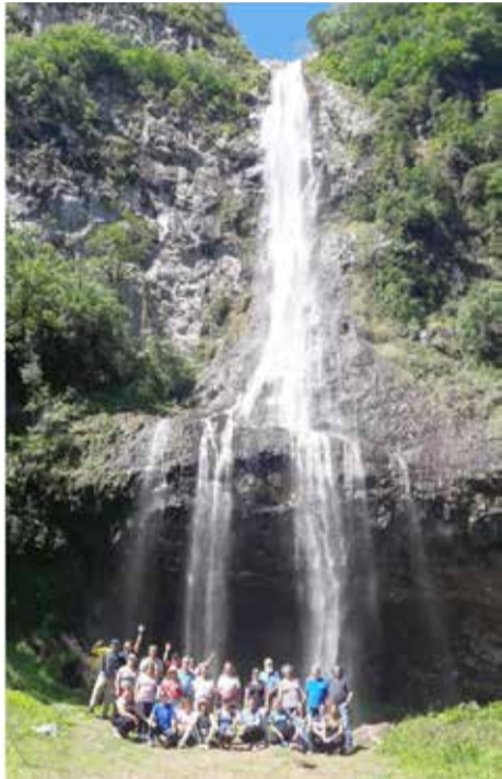
Grupo junto a Cascata Pedra Branca

Após o passeio por Dom Pedro de Alcântara, realizado no final de novembro, a ROTA TURÍSTICA CAMINHO DOS VALES E DAS ÁGUAS - ferramenta de integração turística a qual fazem parte os municípios de Arroio do Sal, Dom Pedro de Alcântara, Mampituba, Morrinhos do Sul, Itati, Terra de Areia, Três Cachoeiras, Três Forquilhas e Torres - realizou mais um passeio, desta vez no município de Três Forquilhas. Este foi realizado na última terça-feira, dia 4 de