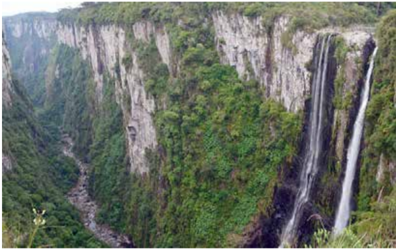
Cachoeira no Cânion do Itaimbézinho - parte do Geoparque Cânions do Sul

O Geoparque Cânions do Sul busca impulsionar o desenvolvimento sociocultural, econômico e ambiental da região, por meio do turismo e o reconhecimento deste território como um Geoparque Mundial da UNESCO. A iniciativa busca o reconhecimento da região como um Geoparque Mundial da Unesco, por reunir neste território, sítios geológicos de relevância internacional. Atualmente, existem 140 Geoparques da Unesco em 38 países. No Brasil, existe apenas um, o Geoparque Araripe, localizado no Ceará.