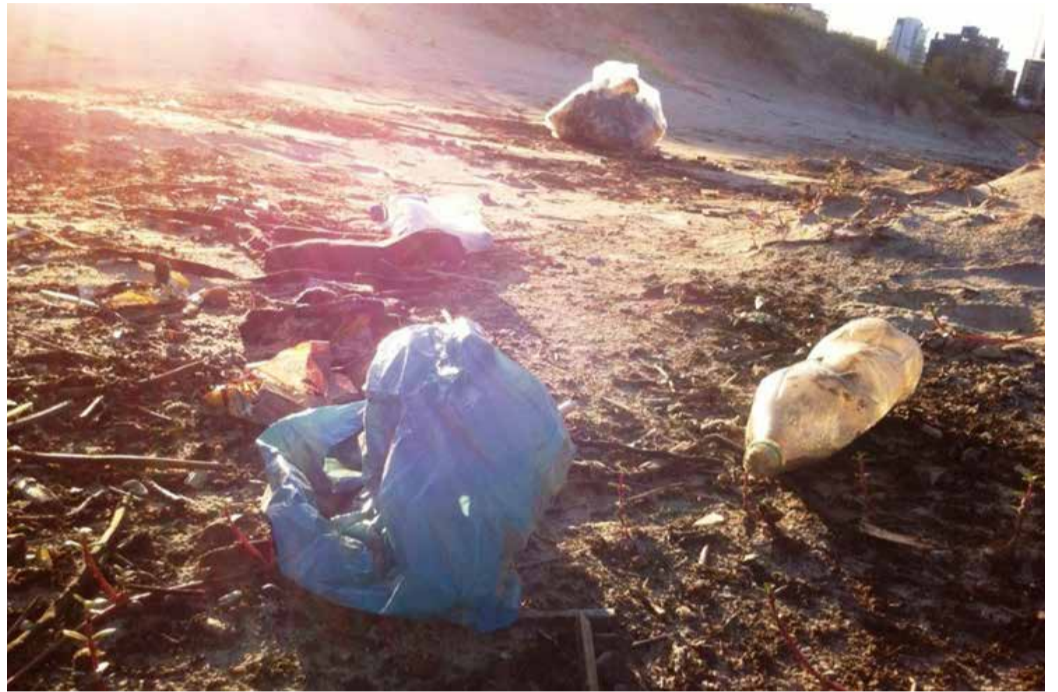
Lixo na Praia Grande

"Nestes locais venha somar-se aos grupos de voluntários. E caso você esteja em qualquer outra PRAIA do LITORAL GAÚCHO ou do Mundo, faça sua AÇÃO LOCAL e ajude a gerar RESULTADOS GLOBAIS usando o Hashtag #somoslixozero. Faça também sua ação individual ou coletiva em prol de praias e oceanos limpos. Todas as fotos marcadas com essa Hashtag serão divulgadas... Mais atitude, menos blábláblá!", complementa Alexis Sanson.