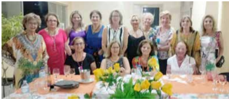
Jantar do grupo da Confratorres