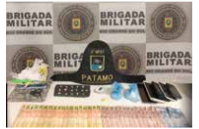
foi Lavrado APF para ambos por Tráfico de Entorpecentes