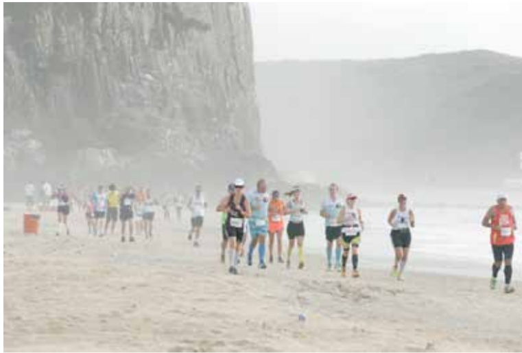
Largada da corrida do ano passado, em Torres

Conforme os organizadores do evento, as 3.000 vagas existentes na competição foram preenchidas rapidamente, formando cerca de 150 duplas, 250 quartetos e 150 octetos. "Além disso, procurou-se valorizar a participação dos solos, aqueles que encararão os 82 km da prova sem qualquer parada ou interrupção. Eles serão facilmente identificados pelo boné de cor diferente dos demais e receberão ainda, no final da prova, uma camiseta especial de Finisher para lembrarem do seu feito para