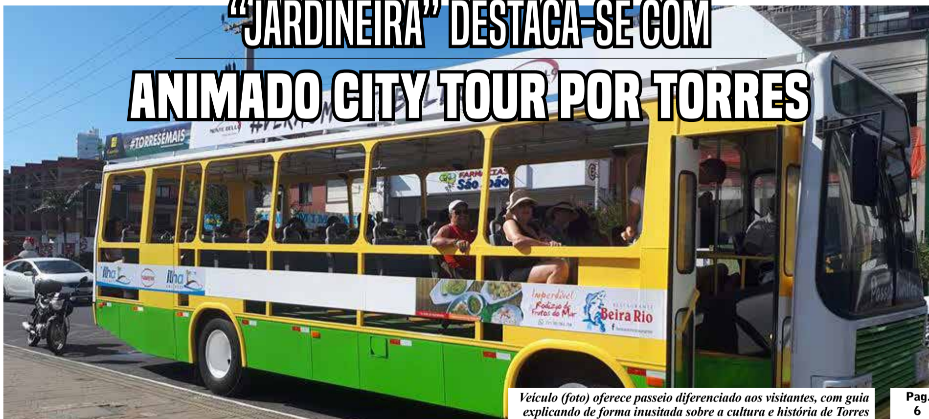
Veículo (foto) oferece passeio diferenciado aos visitantes, com guia explicando de forma inusitada sobre a cultura e história de Torres