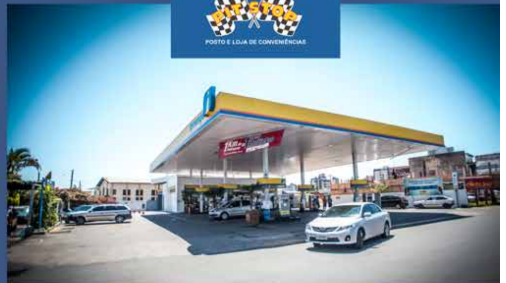
AV. BARÃO DO RIO BRANCO, 617 - TORRES/RS