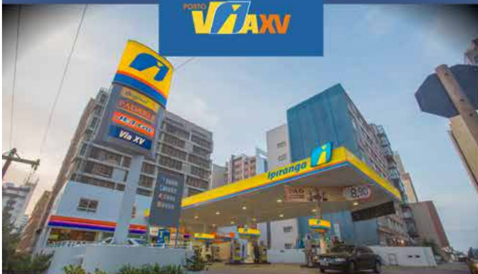
RUA JULIO DE CASTILHOS, 291 - TORRES/RS

Pague com cartão de crédito pelo aplicativo ou em dinheiro direto com o frentista