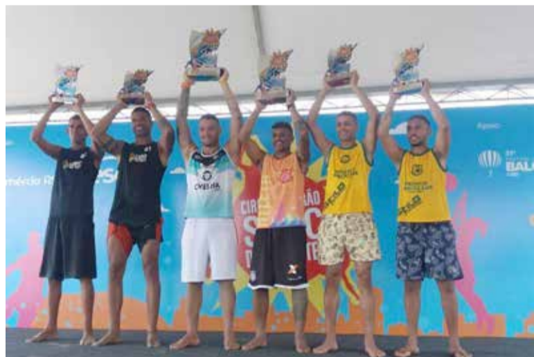
Dupla de Arroio do Sal Sagrou-se campeã no Futevôlei

Para 2020, pela primeira vez Arroio do Sal estará presente em cinco modalidades, são elas: Beach Soccer, Futevôlei Masculino, Vôlei de Dupla Masculino e Feminino e Beach Câmbio Misto.