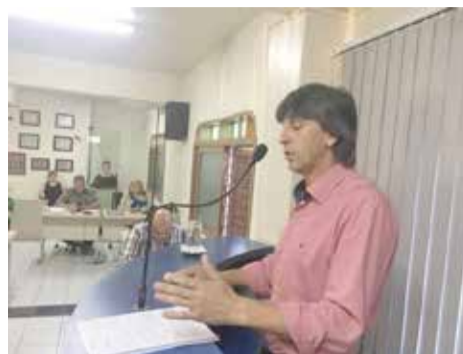
Tubarão (e) além de achar salários caros, fez comparação com valores e vantagens sociais das contratações das feitas através das Frentes Emergenciais de Trabalho. Marcos (d) 'achou' ágio de R$ 2,8 mil por salário terceirizado

afirmando que algumas atitudes da administração municipal acabam efetivamente “não deixando que sobre dinheiro para as demandas da cidade em todas as áreas”. É que a prefeitura, conforme cálculos de seu gabinete, realizou uma renovação de contrato com empresa que contrata auxiliares de serviços gerais, cozinheiras, equipe de limpeza urbana e atendentes. Ele teria sido feito com valores anuais que passam dos R$ 5 milhões. Seu gabinete dividiu o valor total do contrato pelo número de funcionários que trabalham em Torres para este mesma empresa e chegou a um salário MENSAL de R$ 4.079 por trabalhador, quando na prática a informação dá conta (também conforme