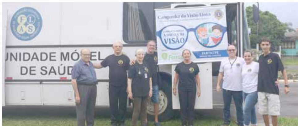
Ônibus da Fundação Leonística que percorre o Estado inteiro fazendo campanhas, esteve em Torres na sexta-feira, dia 5 de abril

As consultas com o médico especializado foram pagas pelo Lions de Torres com recursos oriundos de doações de pessoas ou empresas voluntárias, assim como com recursos do caixa do clube torrense. Os 40 alunos assistidos foram previamente sugeridos pela direção das duas escolas torrenses - levando em conta critérios de necessidade de corrigir eventuais problemas de visão, bem como critérios socioeconômicos que sugerem menos recursos na renda familiar dos atendidos.