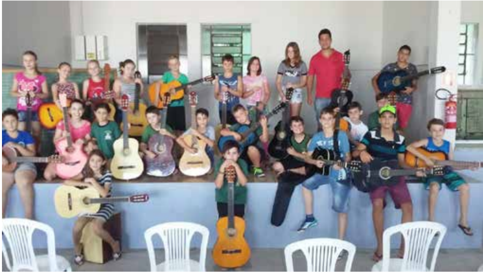
Alunos da oficina de violão, juntamente com o oficineiro

Cerca de 60 crianças entre 6 e 15 anos iniciaram na última semana as oficinas de violão, capoeira e dança alemã desenvolvidas pelo Serviço de Convivência e Fortalecimento de Vínculos de Crianças e Adolescentes do Centro de Referência de Assistência Social (CRAS), em Dom Pedro de Alcântara.