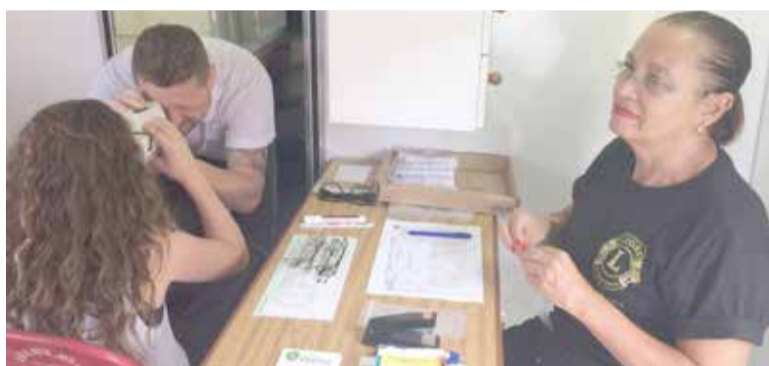
Diagnóstico feito dentro do ônibus em crianças estudantes municipais