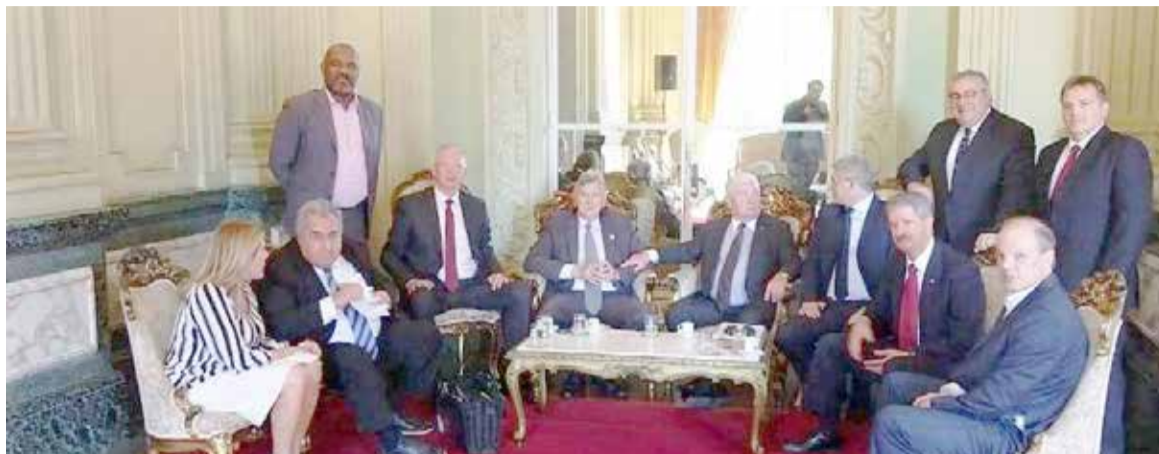
Reunião com políticos no Palácio Piratini, na Capital Gaúcha, onde assunto do possível porto em Torres foi debatido

vo, outra de entidades ligadas diretamente ao Meio Ambiente, e outra de entidades ligadas ao dia-a-dia das comunidades. Ele (Conselho) tem poder de voto - em alguns casos com poder de veto - e as decisões são ba-