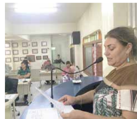
Gisa pede mais atenção e mais transparência nas contratações de espetáculos artísticos pela prefeitura de Torres

do festival só ter sido realizado em maio do mesmo ano.