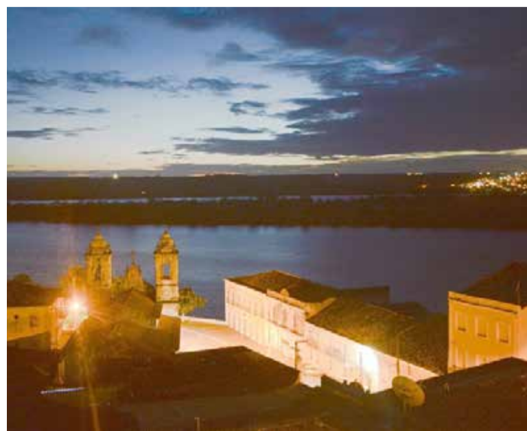
O município de Penedo, em Alagoas.

Também será de responsabilidade do MTur, a definição da forma de seleção pública que será realizada, assim como os modelos de negócios, valores, e outros pontos referentes aos contratos de destinação. Em contrapartida, caberá à SPU a formalização e gestão financeira dos contratos, além da fiscalização, dentre outros procedimentos técnico-operacionais, que serão detalhados em Instrução Normativa que será publicada nos próximos dias.