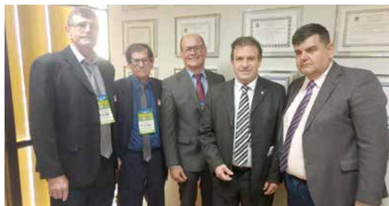
Em Brasília, Comitiva em visita ao gabinete do deputado Pompeo Mattos

A Marcha teve também palestra sobre corrupção com o ministro da Justiça e Segurança Pública, Sérgio Moro. Para o prefeito Dirceu, o encontro foi muito produtivo e importante para a gestão pública.