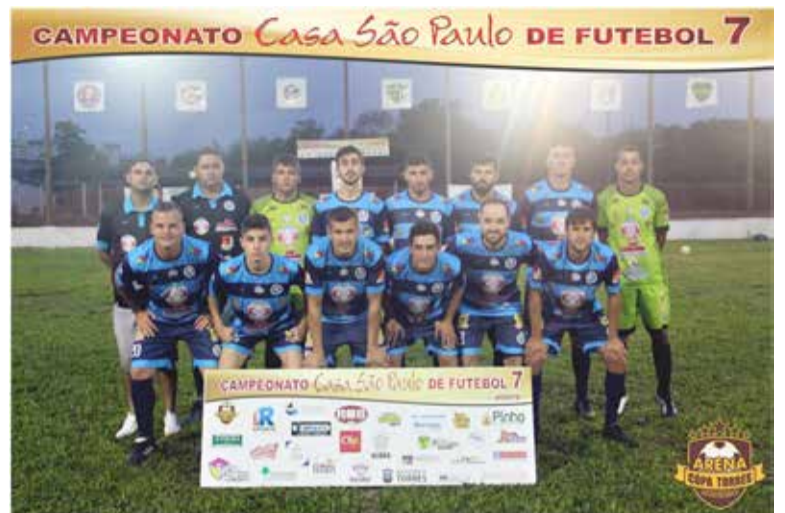
Atual campeão Panela (foto) venceu e garantiu classificação