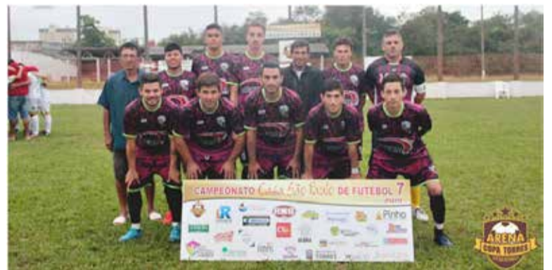
São Luiz (foto) garantiu vaga com uma virada inusitada