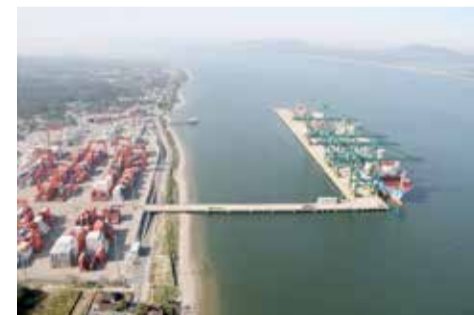
Porto de Itapoá seria modelo para possível terminal portuário no litoral norte do RS