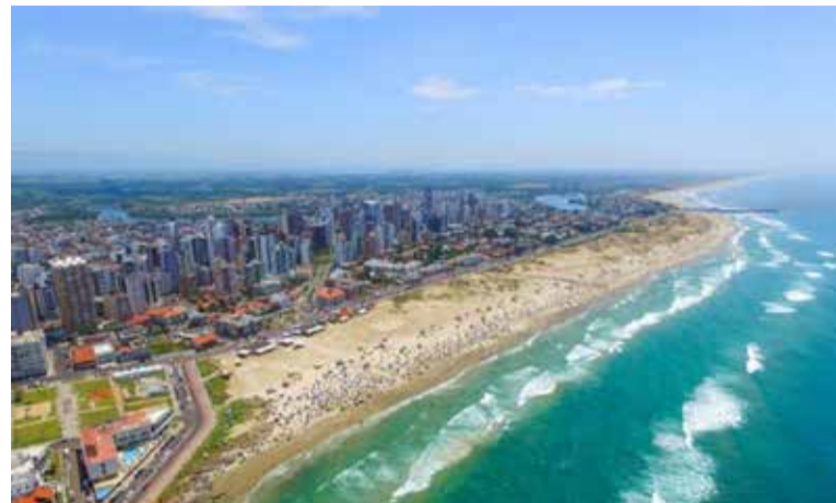
Vista Aérea de Torres

A estrutura do Parador Descubra Torres também contará com um deck; feiras com produtos orgânicos e artesanais; empréstimo de bicicletas, degustação de cervejas e espumantes, exposições em datas especiais, espaço para palestras e música ao vivo, forno de pizza à lenha para confrater-