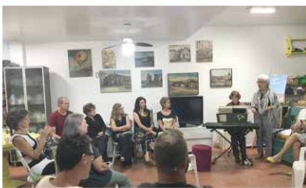
Sarau do Espaço Ten Caten, edição de março de 2019.

ten, que terá edições mensais em 2019, acontece desde 2014, ano de reabertura deste importante reduto cultural de Torres. O ingresso para a participação, é alimento e bebida para com-