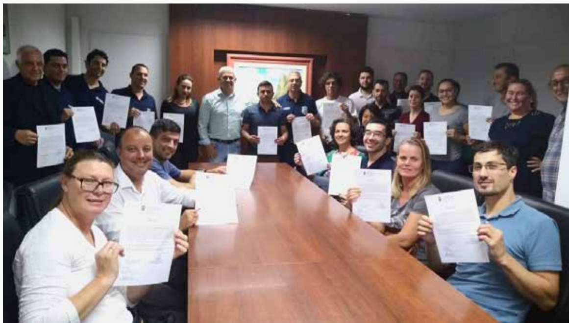
Os servidores mais recentemente empossados pela Prefeitura de Torres