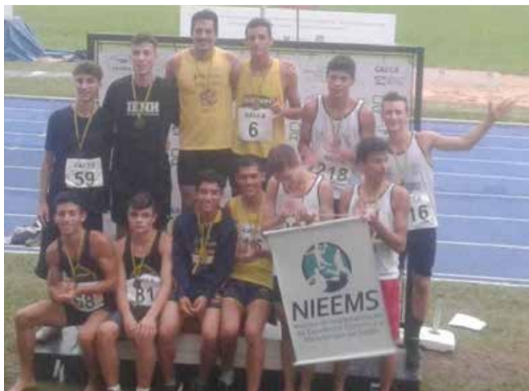
Atletas ficaram com o ouro no revezamento 4x400m Masculino