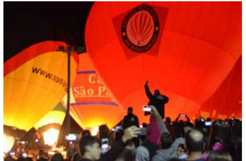
Night Glow de 2017 na Praia Grande

Confira a programação do festival para o final de semana: