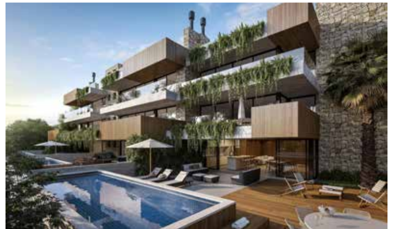
Reserve é um dos empreendimentos em destaque pela R Dimer Incorporadora e Construtora

Todos os pavimentos terão varanda com vista para o mar, piscina privativa e jardim, que naturalmente integram o melhor da paisagem e orientação solar. Duas unidades serão mobiliadas e decoradas exclusivamente com o design da renomada marca Saccaro, que há mais de 70 anos alia a sensibilidade dos artesãos às mais contemporâneas formas de produção, para proporcionar experiências únicas e cheias de personalidade aos consumidores. Os