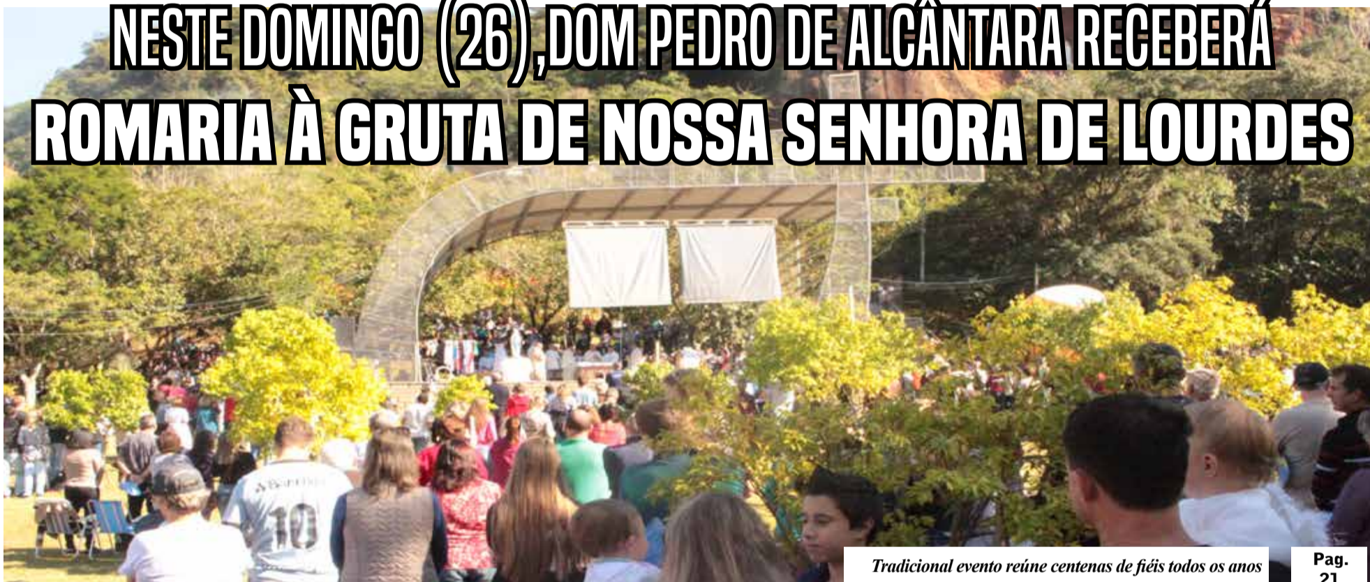
Tradicional evento reúne centenas de fiéis todos os anos