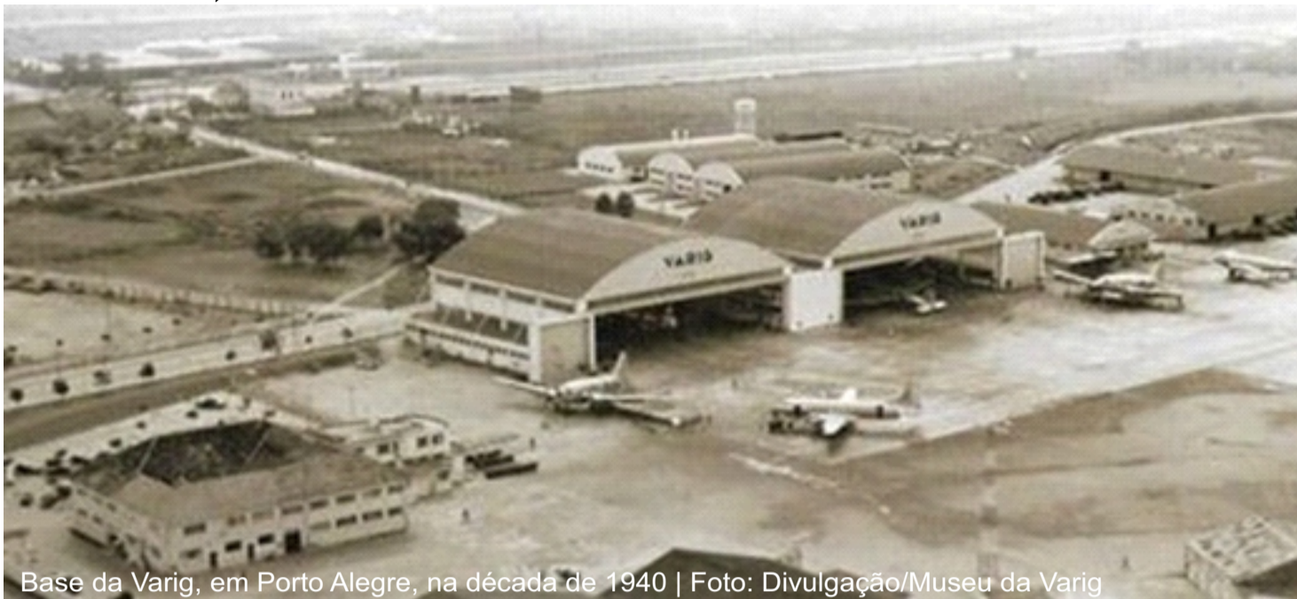
Base da Varig, em Porto Alegre, na década de 1940

Pelo que se sabe havia uma grande colônia de alemães aqui no RS. Dos três milhões de gaúchos contabilizados no final dos anos 1930, 620.000 possuíam sangue alemão e grande parte deles simpatizava com os ideais nazistas. Naquele tempo o nazismo era visto, por eles, como o regime que reconstruiu a Alemanha depois da Primeira Guerra Mundial.