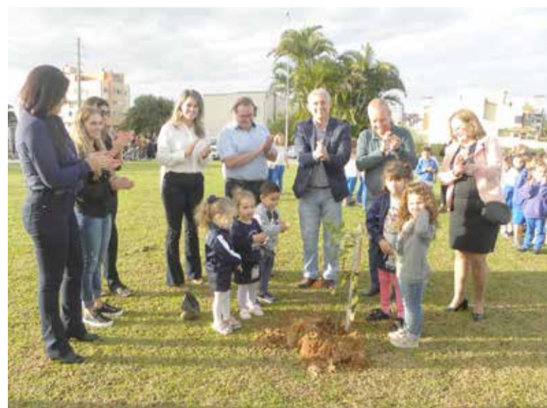
Crianças do Tietboehl plantaram 5 ipês na praça

A Praça da Lagoa anteriormente abrigava o Ginásio de Esportes Municipal, demolido por problemas de estrutura. O projeto arquitetônico de implantação de infraestrutura esportiva inicialmente fora aprovado em 2014, o que gerou uma licitação que teve ordem de serviço em março de 2015 e,