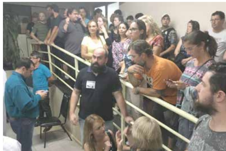
Com o auditório lotado, muita gente ficou de fora da audiência, o que gerou reclamações

O promotor orienta ainda que, "caso se tenha interesse em promover uma debate acerca do tema que envolve a instalação de eventual porto marítimo no Município de Torres, a audiência deverá ser amplamente divulgada, inclusive pelos meios de comunicação do Município, assegurando a participação de todos os interessados no tema, para isso devendo ser realizada em espaço compatível que assegure a franca participação de todos interessados."