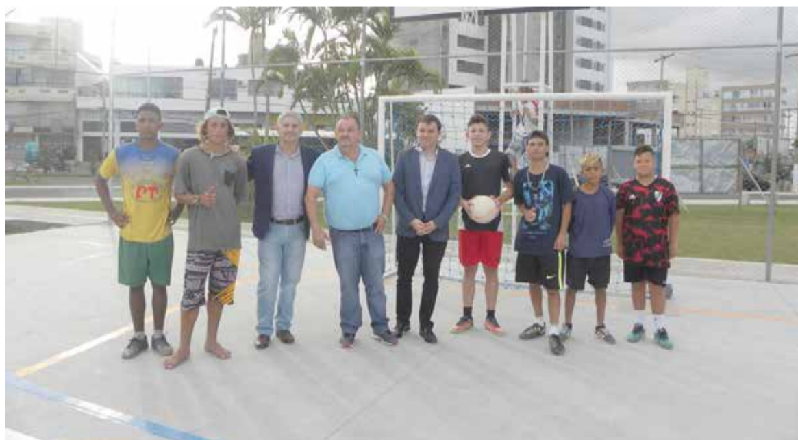
Quadra poliesportiva é um dos destaques do espaço