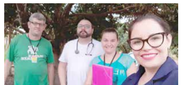
Equipe envolvida com os atendimentos domiciliares

mo que, muitas vezes, a distância de uma residência e outra seja grande, o que dificulta um pouco o trabalho, ainda são atendidos oito pacientes em cada turno", afirmou a enfermeira.