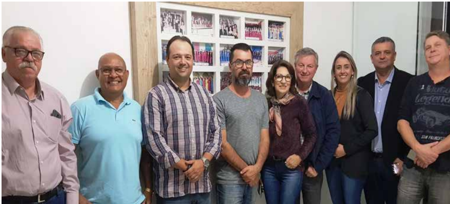
Na foto alguns comendadores com o corpo administrativo da Apae

Conforme nota dos comendadores para a imprensa, o baile foi considerado um sucesso pelas mais de trezentas pessoas que se fizeram presente naquela noite especial. "Esta foi uma agradável forma de doação e empenho em prol de uma entidade que presta serviços tão relevantes para sociedade", afirma a nota dos mesmos comendadores, que também se lembram de agradecer a todas as empresas que, de uma forma ou de outra, apoiaram esse importante evento.