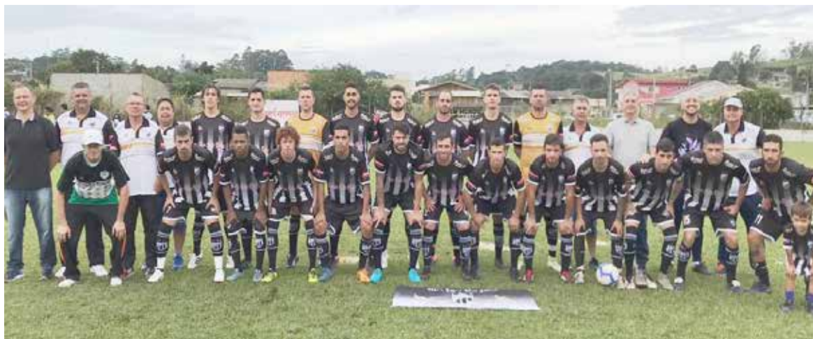
Time do São João (foto) iniciou com vitória

Os jogos do Campeonato reiniciam domingo, dia 2 de junho, respectivamente com partidas marcadas às 13h15min para o Aspirante e 15h15min para o Titular. A realização do evento é da Prefeitura de Torres, por meio da Secretaria Municipal de Cultura e Esporte.