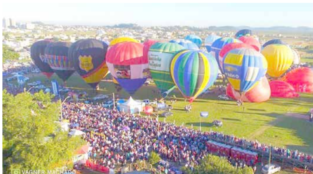
Evento de destaque, Festival de Balonismo faz parte do calendário do ano que vem

Proposta busca dar mais transparência aos municípios e dar mais agilidade para os servidores municipais trabalharem