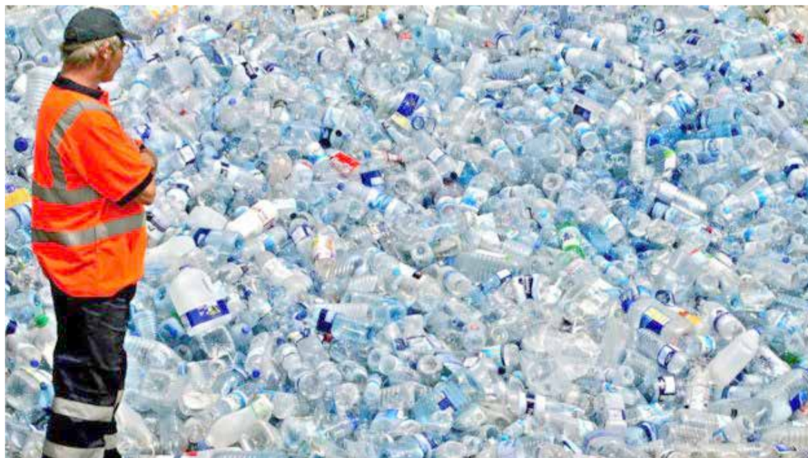
Alguns estudos sugerem que a água engarrafada contém mais microplásticos do que a água da torneira

ladores de água potável se concentrem em "riscos conhecidos". "Dois bilhões de pessoas bebem água contaminada", disse Gordon. "E isso causa um milhão de mortes por ano. Esse tem de ser o foco." No entanto, a OMS considera a poluição por plástico um problema urgente. Aconselha reduzir o uso de plásticos sempre que possível e melhorar os programas de reciclagem.