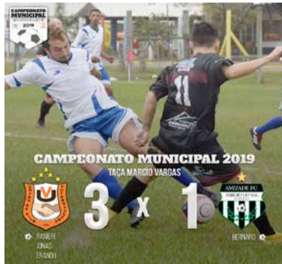
União da Vila venceu time do Amizade

A próxima rodada segue dupla, com enfrentamentos de ECAS x Millonários F.C e União da Vila F.C x F.C Rondinha, no campo do União da Vila. Enquanto isso, no campo do Areias Brancas as disputas serão entre S.E.R Atlântico x Amizade F.C e S.E.R Areias Brancas x E.C Figueirinha. Os jogos iniciam às 13:30h em ambos os campos.