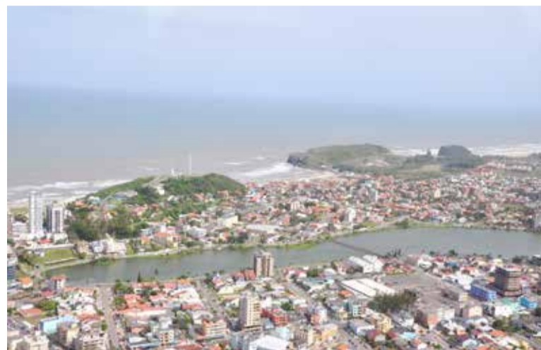
Imagem aérea de Torres

Foi contratada a Empresa Vanin e Ferreti Consultoria Turismo e Cultura Ltda, estabelecida na cidade de Cambará do Sul/RS. O primeiro produto a ser apresentado pela empresa será o diagnóstico, onde deverá ser analisada a situação atual do município, através das informações coletadas sobre a oferta, a demanda, os projetos existentes, mão de obra, legislação pertinente e envolvimento da comunidade. Será elaborada uma matriz com os pontos fortes e fracos, em parceria com entidades e setores ligados ao turismo. O trabalho tem previsão de ser concluído em 180 dias.