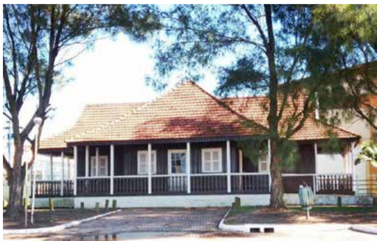
Chalé Memorial do Surf

270/2019, para exposições no Chalé Memorial de Surf, puderam inscrever-se pessoas físicas e jurídicas interessadas em expor temporariamente no Chalé pelo período de um ano nas modalidades de Fotografias, Troféus e Equipamentos de Surf. Em breve será divulgado a data de abertura da primeira mostra no local.