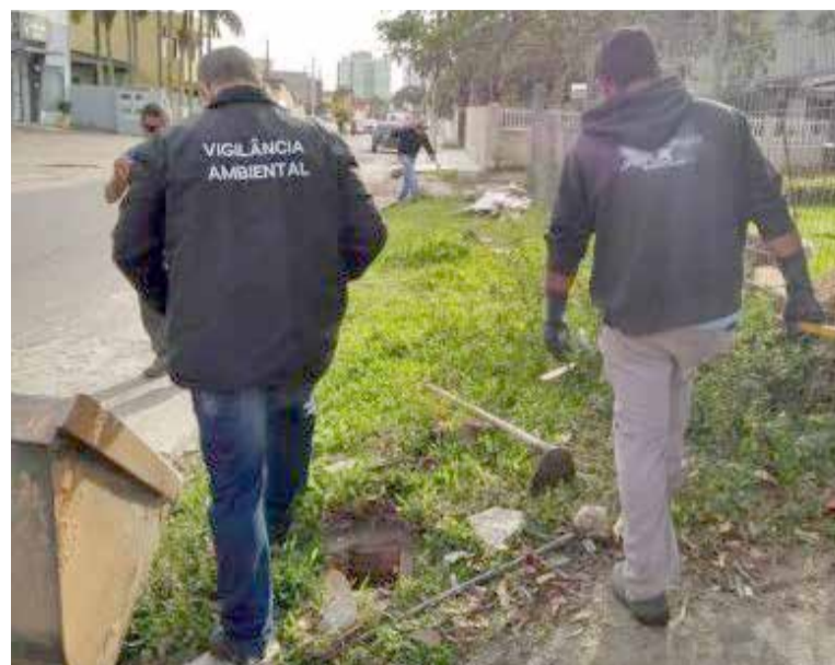
Prefeitura já esteve fechando caixas de esgoto irregulares nesta semana na mesma rua