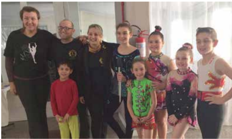
Crianças realizaram apresentação de Ginástica Rítmica

campanhas anuais de captação e doação de recursos para causas sociais locais.