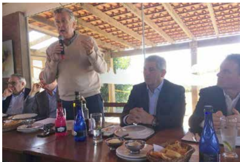
Em Torres Senador explicou os motivos de Torres ficar praticamente fora do páreo em reunião solicitada pelo Fórum Empresarial

Apesar dos esforços por parte da prefeitura de Torres, Arroio do Sal foi a cidade escolhida para ser a provável sede do novo porto previsto para o Litoral Norte do Rio Grande do Sul. A definição saiu por conta da distância da margem de praia ao ponto de calado necessário (profundidade a que se encontra o ponto mais baixo da quilha de uma embarcação) ao fundo do mar. Na localidade prevista em Arroio do Sal, essa distância é 25% menor do que seria em localidade também estudada em Torres (em balneário no sul do município). E isto por si só já barateia muito aquela