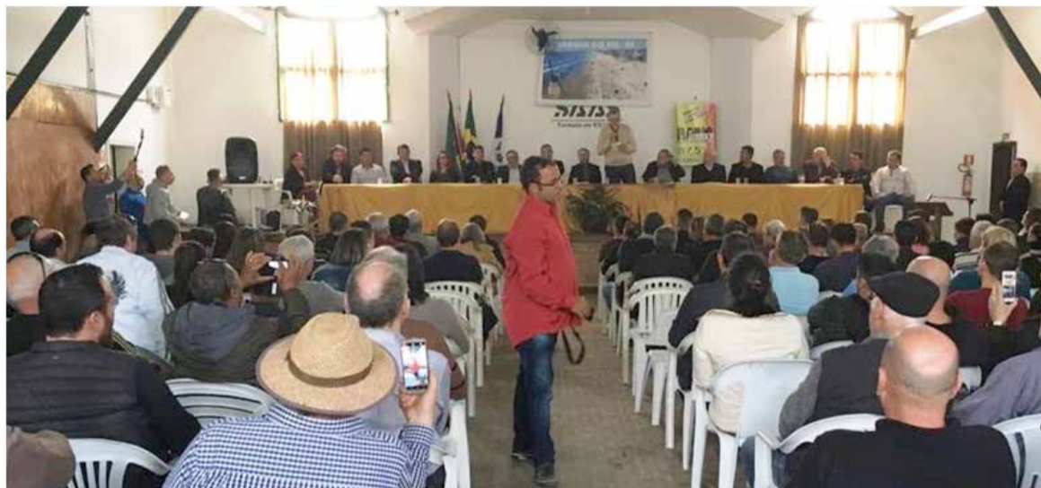
Casa Cheia em Arroio do Sal para receber a boa notícia: Porto deve sair no município

Conforme a comitiva, o projeto do terminal portuário a ser instalado na região vem andando bem nos últimos meses. E após estudos técnicos e econômicos, já há um lugar ideal para o empreendimento ser instalado. Isto não garante em 100% que o litoral Norte gaúcho terá um porto. E isto não garante, muito menos, que o processo será rápido. Mas se tudo der certo, talvez daqui a 12 meses uma reunião possa ser realizada para formalizar a chamada "Licença Prévia" de Implantação, a primeira das várias licenças necessárias para a construção de um terminal portuário em qualquer lugar do Brasil. É