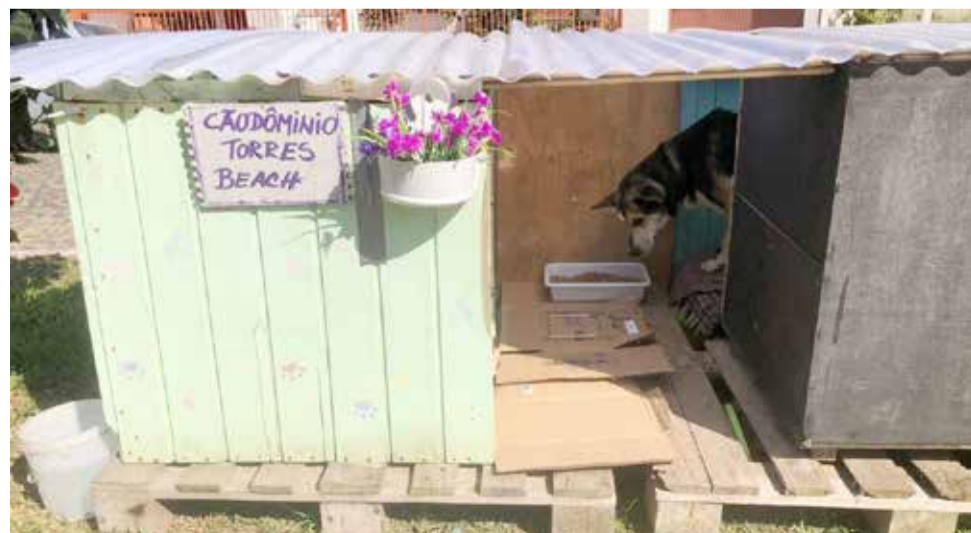
Espaço para cães comunitários em Torres

Visite nossa página no facebook: facebook.com/atpa94