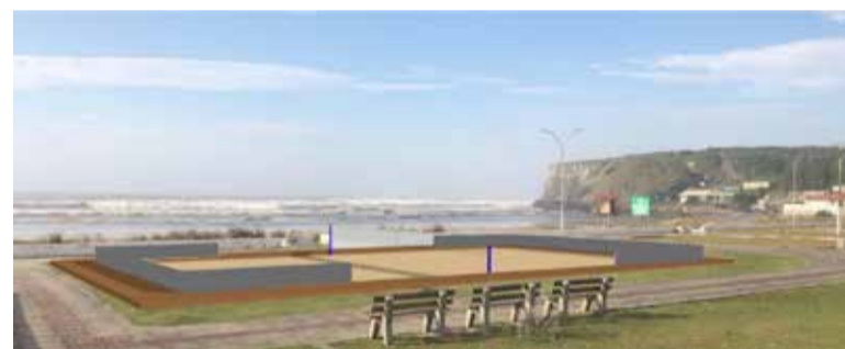
Projeção de como ficará a quadra (por Marcos Vinícios Rosa de Matos)

Inclusão social: Além da prática desportiva, a quadra pública de