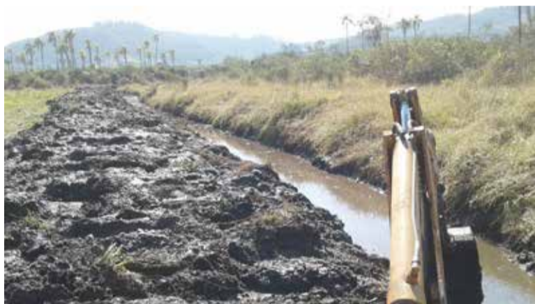
Limpeza de valo foi realizada