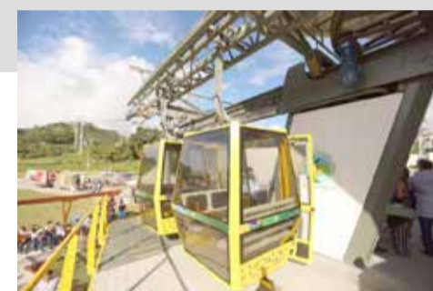
Teleférico na cidade de Bonito. Torres poderia ter o seu

Parques de diversão, teleféricos, Uso do Parque Itapeva com viés turístico, promoção e fomento a passeios pelo mar de barco, estruturação de marinas mais estruturadas no mar, no Rio e na lagoa, são algumas ideias de equipamentos que podem melhorar a captação de turistas e reter os mesmos na cidade por mais tempo.