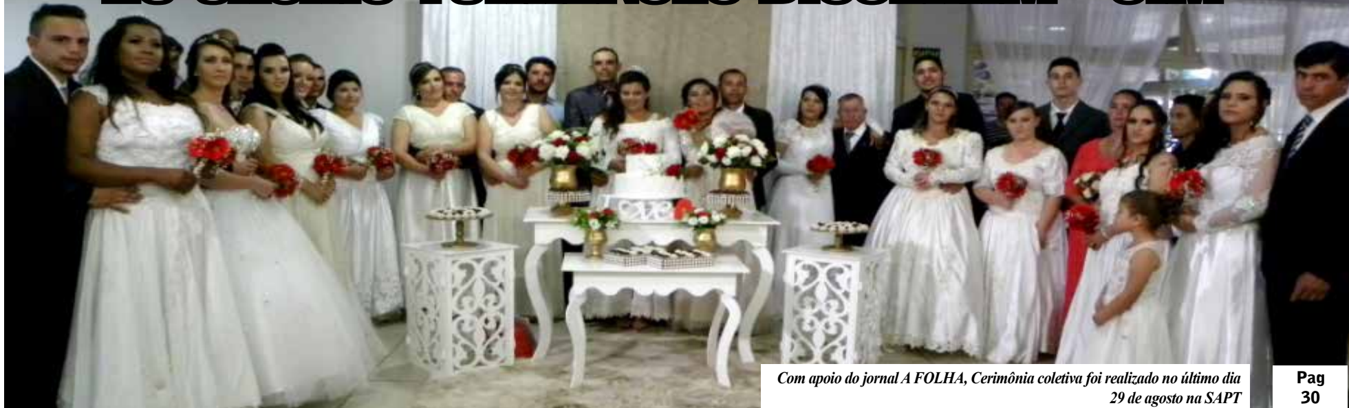
Com apoio do jornal A FOLHA, Cerimônia coletiva foi realizado no último dia 29 de agosto na SAPT