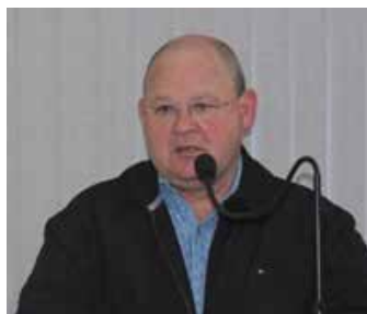
Rogerinho buscou mais liberdade na retirada de árvores em propriedades privadas

Casuarinas, Pinheiros, Seringueiras, dentre outras são algumas das espécies exóticas com maior ocorrência em Torres. Com a nova lei, haverá menos burocracia para a retirada destas árvores em áreas privadas, caso os proprietários assim queiram.