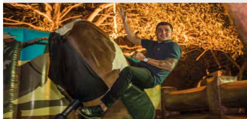
Touro mecânico também garantiu a diversão