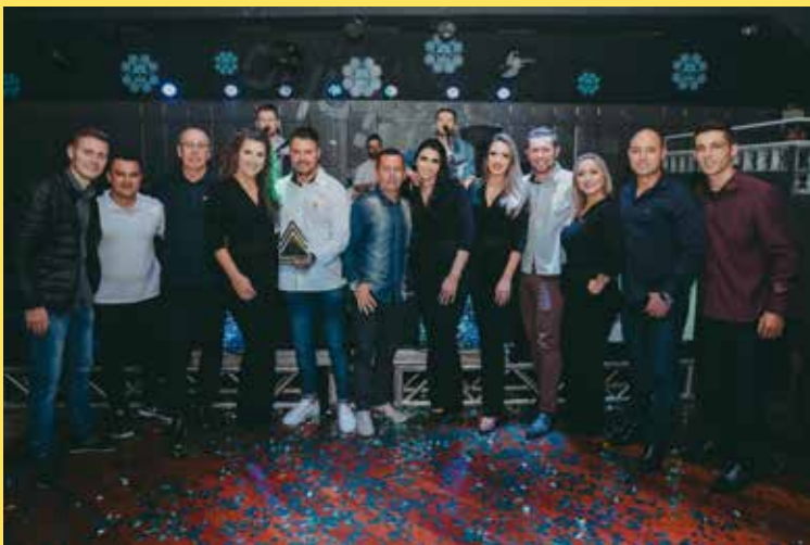
Equipe Imobiliária Guarita