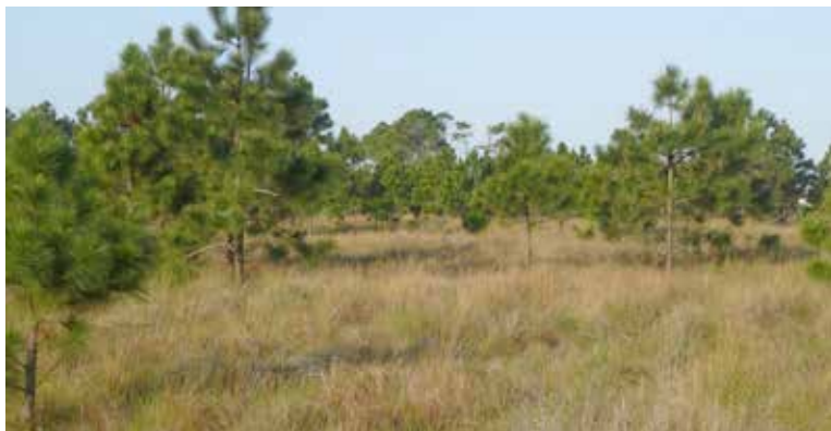
Casuarinas (foto) são consideradas uma das espécies exóticas da região