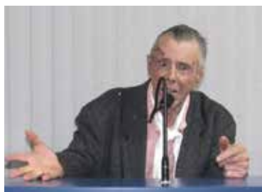
Tradicionalista Ajos Dutra

Guerra dos Farrapos ou Revolução Farroupilha foi como ficou conhecida a revolução ou guerra regional, de caráter republicano, contra o governo imperial do Brasil, na então província de São Pedro do Rio Grande do Sul, e que resultou na declaração de independência da província como