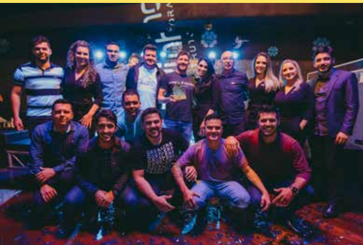
Equipe Imobiliária Noble