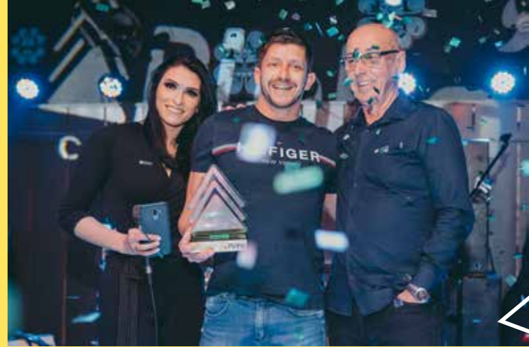
Noble Imóveis | Imobiliária Destaque 2019