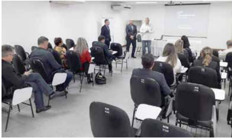
Reunião em Torres para debater o tema com autoridades

Já o segundo encontro na sede do Ministério Público Estadual (MPE)