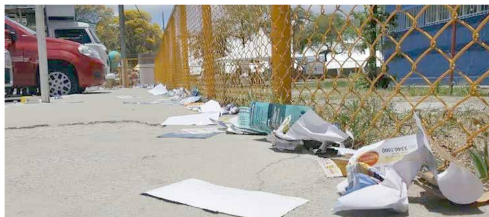
Sujeira dos panfletos é um dos problemas (Imagem meramente ilustrativa)

A entrega em mãos continua permitida, mesmo se o PL for aprovado de forma original. Mas o texto lembra que deve ser aceita pelo transeunte ou pessoa abordada em outras situações. Continua permitido também o depósito de panfletos e assemelhados de propagandas nas respectivas caixas ou locais próprios para correspondências dos imóveis.