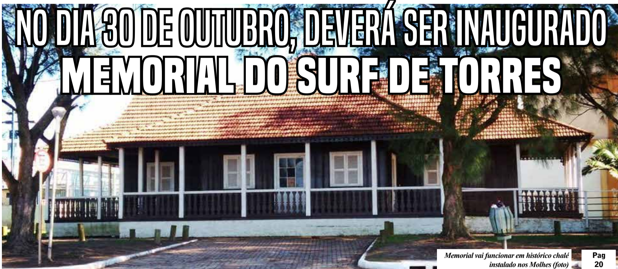
Memorial vai funcionar em histórico chalé instalado nos Molhes (foto)