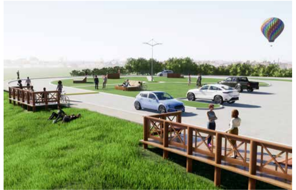
Imagem computadorizada projetada como ficará a revitalização