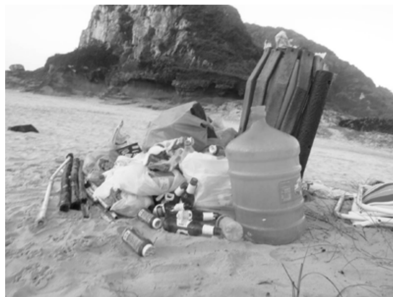
imagem do lixo na Praia da Guarita, na segunda-feira (18)

Mas quanto às lixeiras, Tubarão reclamou da falta do equipamento no centro da cidade, principalmente para pedestres que circulam nas calçadas e compram em estabelecimentos de alimentação, comércio estes que não colocam lixeiras em frente a