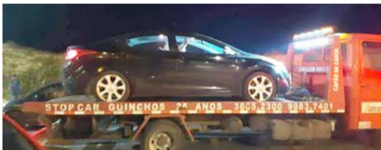
Carro (e motorista) estavam perturbando o sossego, foram multados e apreendidos

O objetivo é evitar brigas em final de festas e crimes decorrentes