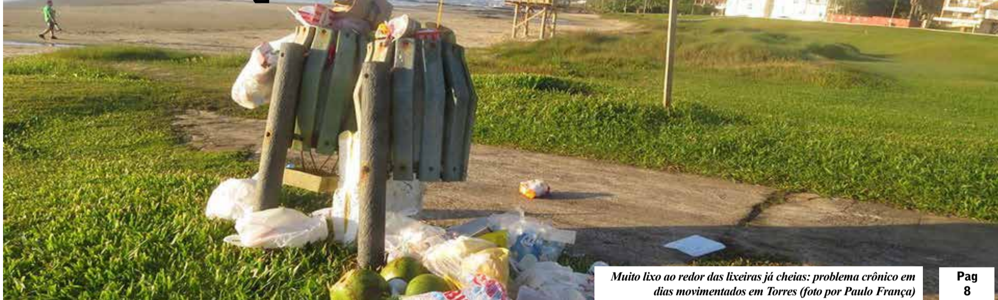
Muito lixo ao redor das lixeiras já cheias: problema crônico em dias movimentados em Torres