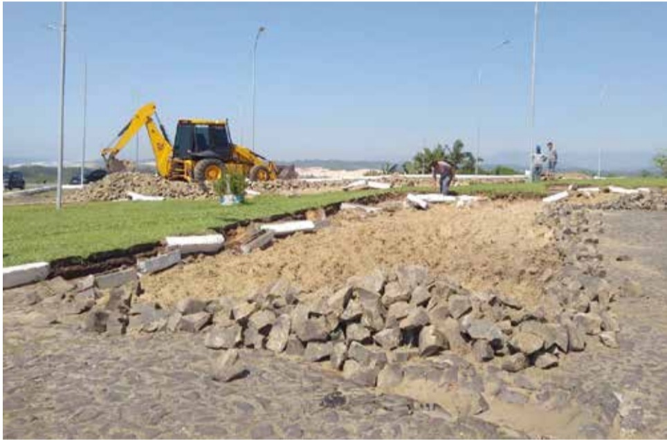
Obras já iniciaram no Morro do Farol

deixará de usufruir da excelente vista, que inclui parte da cidade, mar e paredões. Durante todo o período, o pedestre terá acesso. Esta obra faz parte do Transforma Torres, Pacote de Obras de Infraestrutura Urbana e Turística. A empresa vencedora da licitação é a Construção e Pavimentação Bauer Eireli, de Passo de Torres.