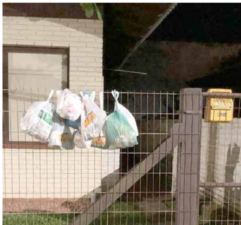
Residências em bairros nobres sequer têm lixeiras (e exigência firme faz parte das sugestões)