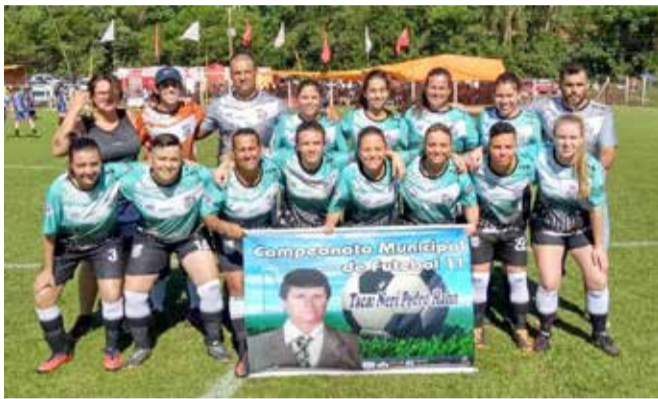
Meninas do Soccer Girls venceram no feminino