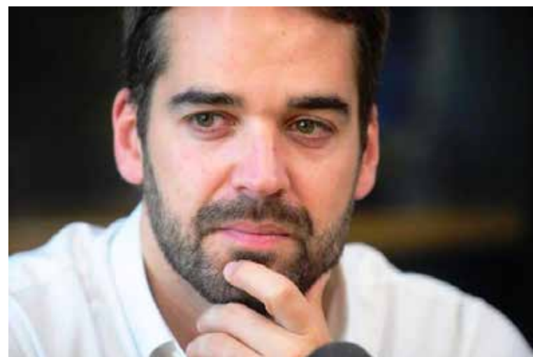
Governador Eduardo Leite (foto) - chefe do executivo estadual

A justificativa do documento emitido pela Câmara de Torres encerra a Moção de Repúdio afirmando que "não aceita a ideia de que a superação dos problemas do Rio Grande do Sul se dará através de cortes que vão prejudicar os servidores e comprometer os serviços públicos oferecidos à população".