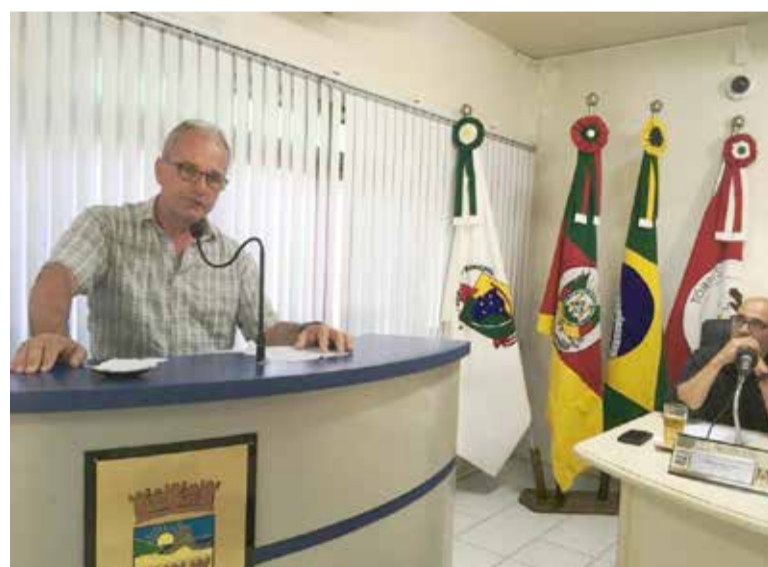
Branco (foto): O Conselho trabalha com a lei atual

nhecido como "Branco", explicou que definir o prazo da entrega da proposta inicial do Projeto de Lei - que quer "atualizar" o Plano Diretor, conforme a lei federal brasileira (tem que ser atualizado de 10 em 10 anos e o Plano Diretor de Torres é de 1995) - não é uma atribuição do Conselho do Plano Diretor. Ele indicou que o CMPD trabalha para aconselhar os rumos do poder executivo em decisões sobre novas obras ou reformas que acabam ficando em uma espécie de "área cinzenta" da lei atual (uma vez que o Plano Diretor em vigência é de 1995). Ou seja: o Conselho do Plano Diretor vota sistematicamente somente as aprovações ou propostas de adequações, nas obras que estão sendo (ou serão) feitas conforme a