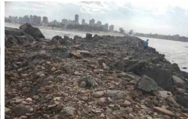
Local logo após recuperação (e), os Molhes com fácil acessibilidade. Mas após a ressaca de 02 de dezembro, local ficou praticamente inacessível (d)

da praia, o saibro ainda deixa o caminho menos acidentado em meio as