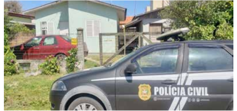
Idosa foi atacada com facadas dentro de sua casa

Diante das informações repassadas à polícia, guarnições da Brigada Militar e da PM de Passo de Torres se deslocaram até a residência da vítima onde conversaram com populares. Uma pessoa relatou ter ouvido um barulho vindo da casa da idosa que fica nos fundos e foi