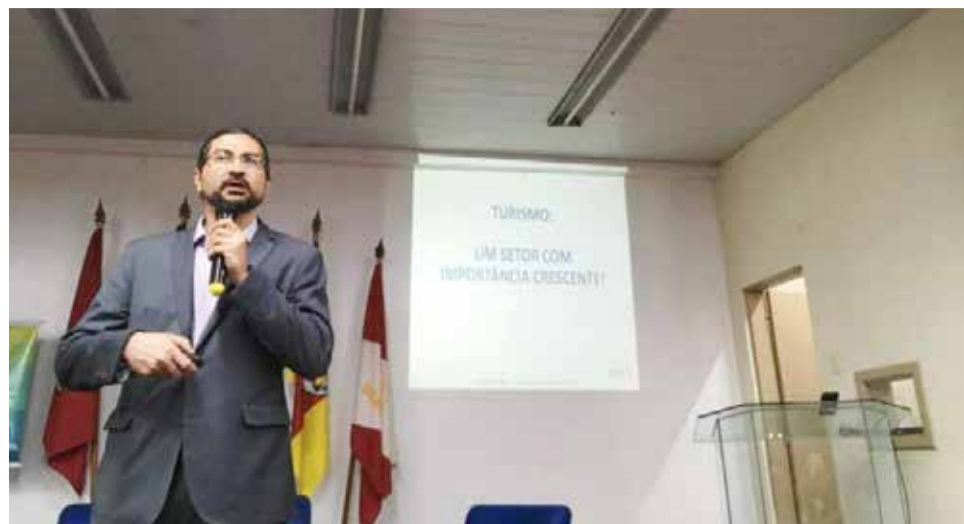
Professor do pós graduação da UCS foi um dos palestrantes