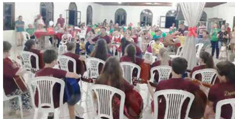
Apresentação de alunos da Oficina de violão foi um dos destaques

O último dia de atividade do programa Criança Cidadã de 2019, realizado na quinta-feira (28), tam-