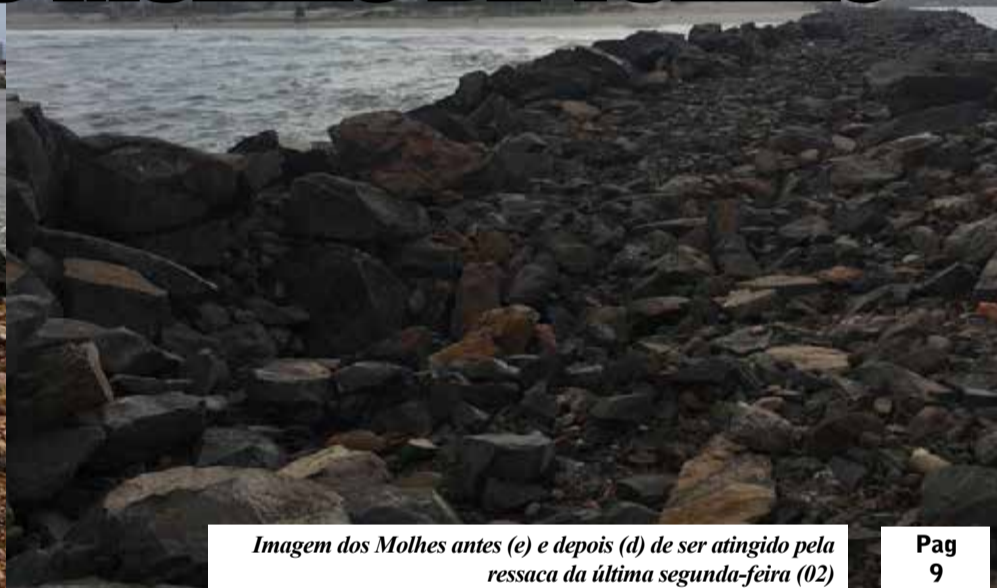
Imagem dos Molhes antes (e) e depois (d) de ser atingido pela ressaca da última segunda-feira (02)