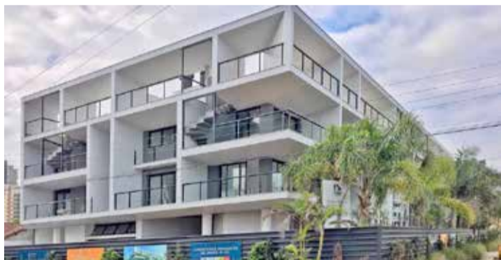
Le Dune Residencial será entregue no sábado (14)