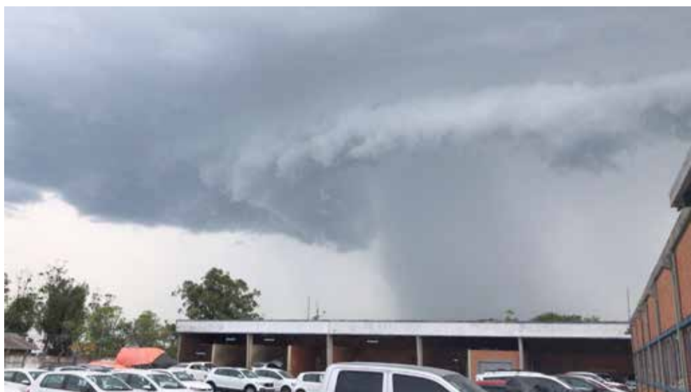
Imagem de temporal se formando em Torres

Um temporal causou estragos e deixou os moradores de Torres, no Litoral Norte do estado, sem luz na tarde desta quinta-feira (12). Conforme a concessionária CEEE, a queda de um elevador andaime de uma obra sobre uma linha de transmissão da rede danificou os cabos e deixou a energia sem funcionar entre 13h32 e 14h35.