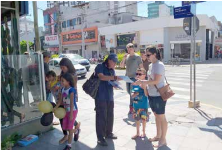
Ações de conscientização contra a dengue vem sendo realizada