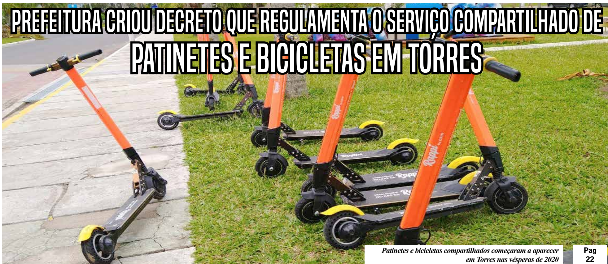
Patinetes e bicicletas compartilhados começaram a aparecer em Torres nas vésperas de 2020