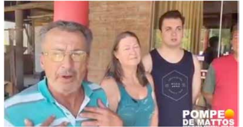
Proprietário de um dos comércios prejudicados manifestou-se no vídeo

esta atitude, buscando que haja adequada abertura para os comércios locais, que estariam "condenados ao seu fim" por conta do fechamento