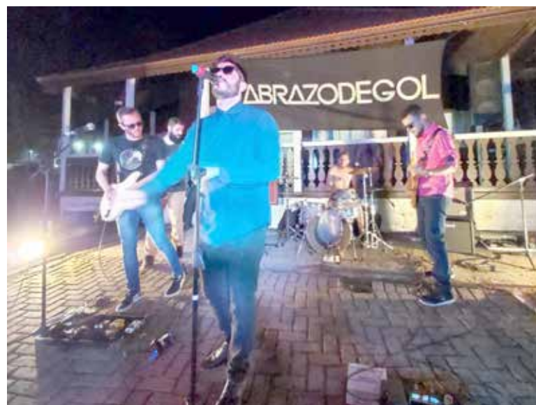
Abraço de Gol no Chalé do Surf

No domingo, aconteceu a abertura da programação de verão do Coreto Musical da Praça XV - com o SamBatuque. E a partir de agora, o Coreto Musical terá atrações todas às quartas e sextas-feiras, em torno das 20h. E para começar, o SamBatuque trouxe um espetáculo de Samba&Poesia, que levou o público a pedir bis, conforme a Prefeitura de Torres. “A proposta, em caráter sacro, tem como base o poema Escapulário do modernista Oswald de Andrade e Samba da Bênção de Vinícius de Moraes. SamBatuque tam-