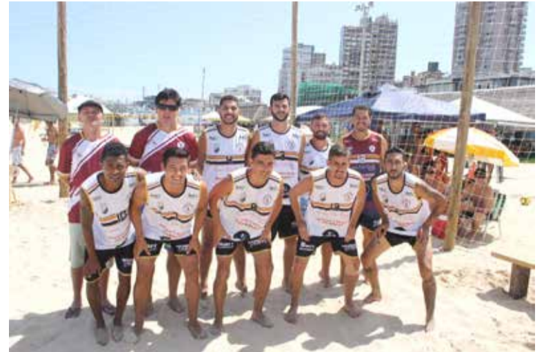
No jogo de abertura, Leões da Praia venceu nos pênaltis

14h30min- Aberto- Grupo B- São Brás X ADEM 15h30min- Aberto- Grupo A- Panela/Heineken X Guarita 16h30min- Aberto- Grupo A- Guarani/Nova Geração X Leões da Praia/São João 17h30min- Master+35 Grupo B- Guarita X Mar Azul 18h30min- Master+35- Grupo A- Pequeno X ADEM 19h30min- Feminino- Chave Única- Supernova X Soccer Girls 20h30min- Veterano Chave Única- São João X Guarita