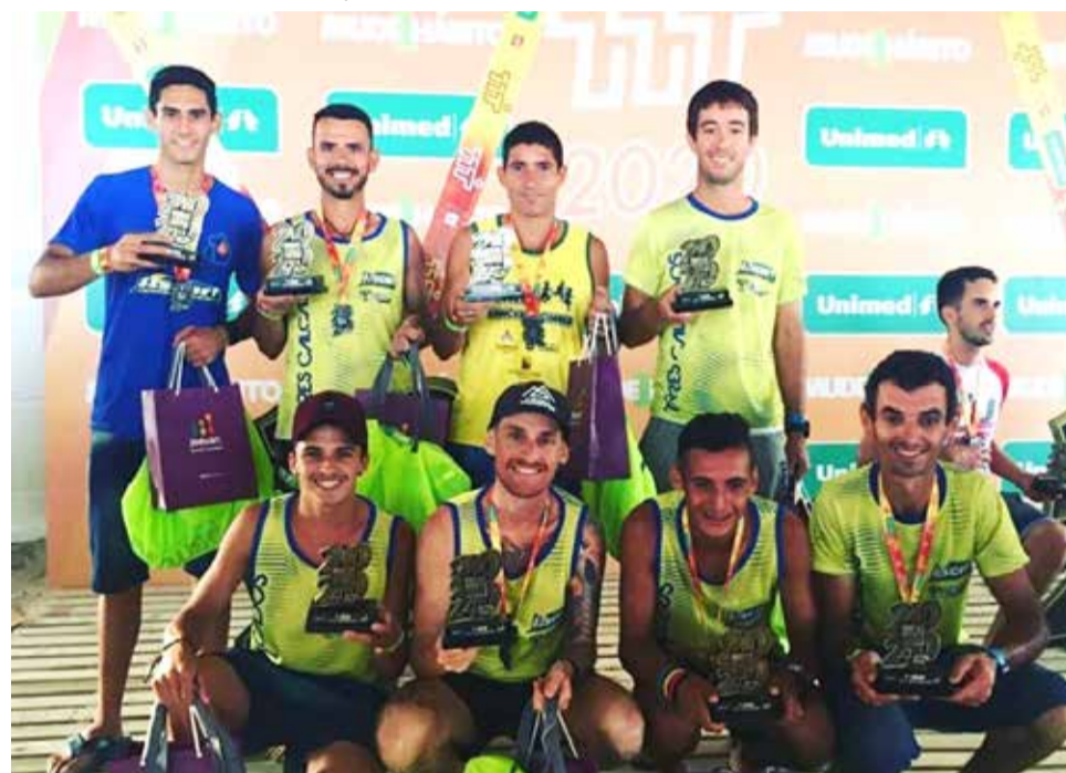
Octeto campeão da TTT