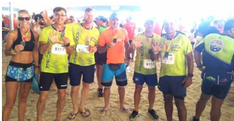
Equipe que garantiu o quinto lugar