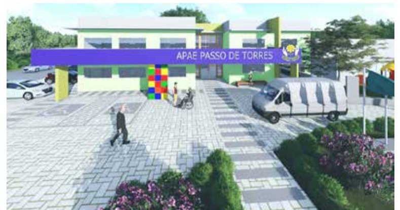
Projeção da nova sede da APAE Passo de Torres

lidária da Impacto Arquitetura na elaboração do projeto da sede nova e ressaltou que outros interessados em ajudar de alguma forma na concretização desse sonho podem procurar a entidade. "O espaço físico maior, adequado e acolhedor, permitirá qualificar ainda mais e ampliar os serviços, bem como receber um número maior de alunos, pois a demanda existe", concluiu o presidente da Apae de Passo de Torres.