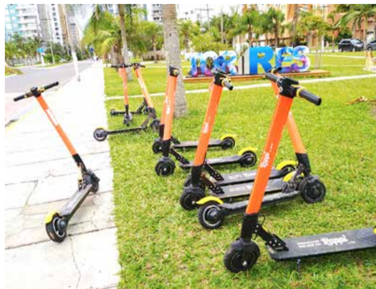
Patinetes da Rappi nas 'Quatro Praças'