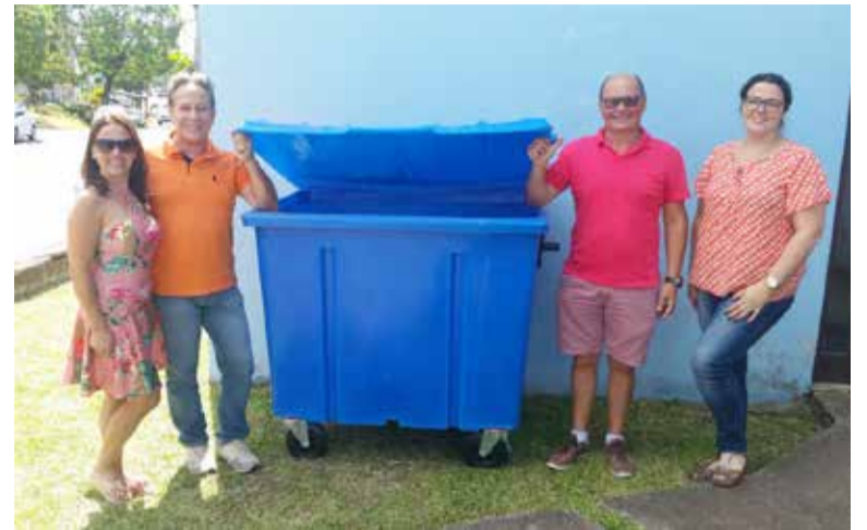
Prefeito e equipe, junto a um dos pontos de coleta (foto de arquivo, tirada antes da pandemia e suspensão das aulas)

O caminhão da coleta seletiva passará a cada 15 dias, tendo em vista o baixo volume de resíduos recicláveis que estão sendo descartados. Desta forma, ele passará na