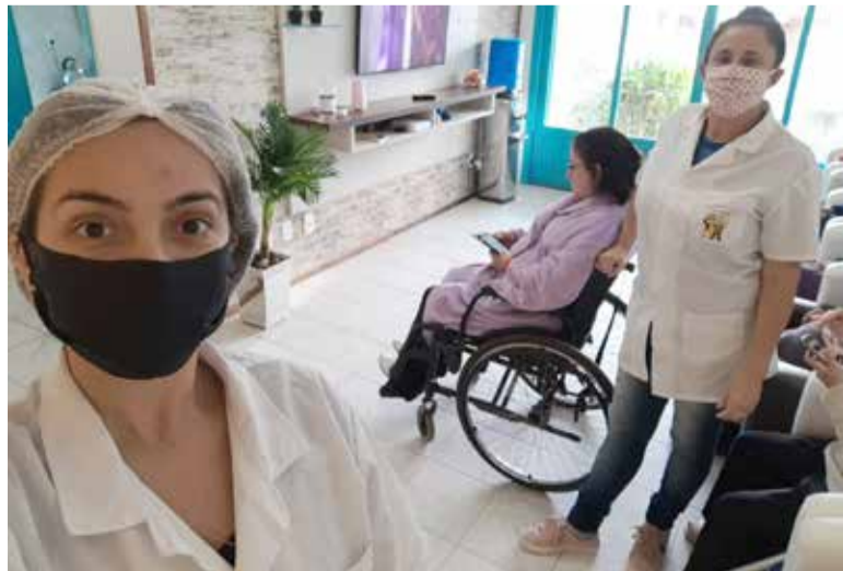
Funcionárias usam máscaras e redobram atenção neste período

As três instituições consultadas por A FOLHA, obviamente, destacaram que trabalham com os cuidados de higiene e etiqueta pessoais exigidos nestes períodos. Isto ajuda para que os cuidados e o respeito ao próximo sejam parte da educação e servem, portanto, para que os idosos inclusive evitem adquirir qualquer vírus através do tempo, um legado da quarentena do Coronavírus.