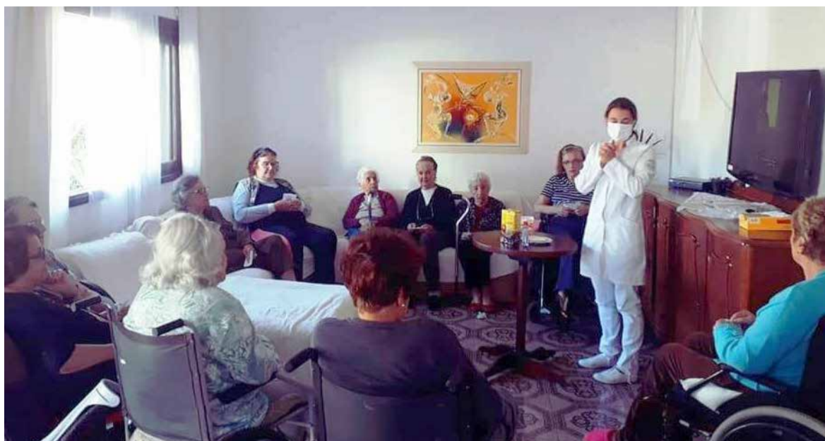
Idosos se reúnem para atividade coletiva em casa de repouso, neste período de quarentena

Torres possui algumas destas Casas de Repouso. Felizmente, até esta quinta-feira (07) estas instituições não tiveram nenhum caso - nem de teste positivo de Covid-19, muito menos por hospitalização com sintomas similares a mesma.