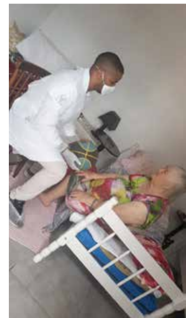
Fisioterapeuta atendendo uma das idosas em casa de repouso

Dentro da residência só transitam os funcionários que trabalham na casa. E cuidados para que estes trabalhem são normatizados, para que as idas e vindas dos mesmos de casa para o trabalho na casa de repouso tenham o mínimo de risco.