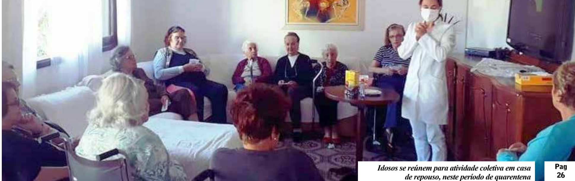
Idosos se reúnem para atividade coletiva em casa de repouso, neste período de quarentena