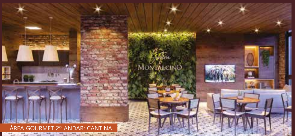
ÁREA GOURMET 2º ANDAR: CANTINA