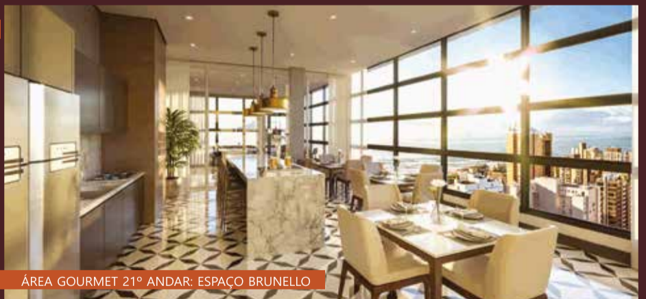
ÁREA GOURMET 21º ANDAR: ESPAÇO BRUNELLO