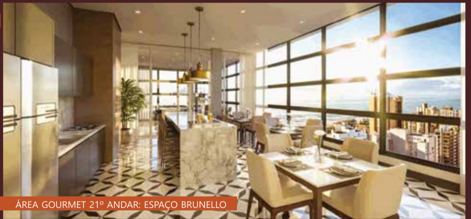
ÁREA GOURMET 21º ANDAR: ESPAÇO BRUNELLO