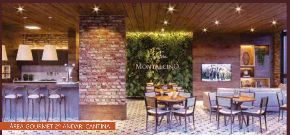
ÁREA GOURMET 2º ANDAR: CANTINA