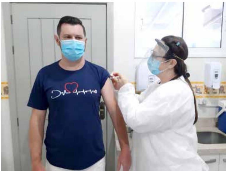
Início da Vacinação em Três Cachoeiras

Centro do COVID-19); idosos acima de 60 anos e pessoas com deficiência que moram em lar de longa permanência (Lar Dr. Paim Cruz), assim como seus funcionários.