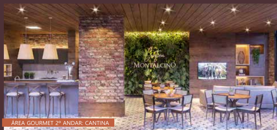
ÁREA GOURMET 2º ANDAR: CANTINA