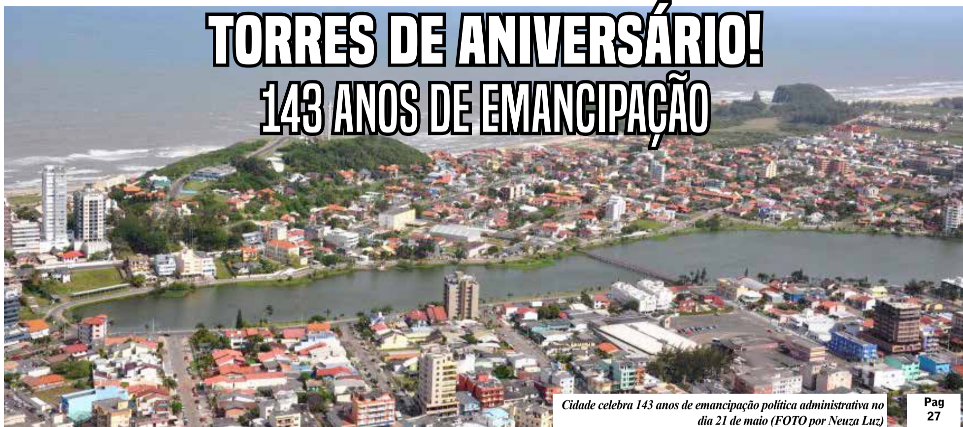
Cidade celebra 143 anos de emancipação política administrativa no dia 21 de maio