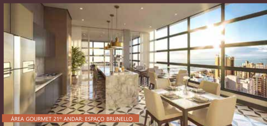
ÁREA GOURMET 21º ANDAR: ESPAÇO BRUNELLO