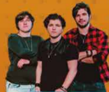
MY BLOOD 31/07 - 20H