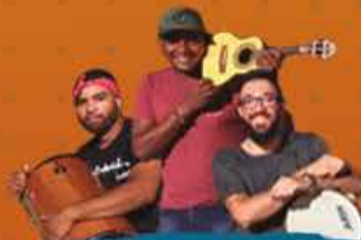
SAMBEIRA 31/07 - 21:30H