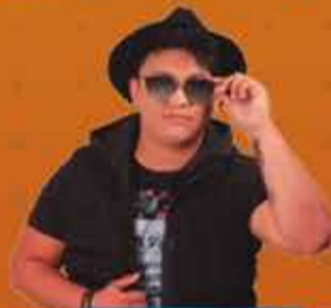
ZÉ FELIPE 31/07 - 20:45H