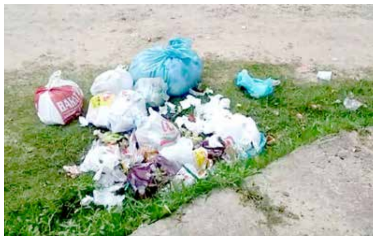
Sacos de lixo as vezes são rasgados por cães e gatos, por sua localização aberta e baixa

Moisés Trisch anexou ao Pedido de Providências fotos de situações recebidas dos reclamantes assim como relata que também já recebeu vídeos que estampam a mesma situação, onde afinal o lixo revirado nos sacos furados por animais fica no chão, sendo espalhado pelo vento e podendo entupir bocas de lobo (bueiros), trazendo uma série de prejuízos.