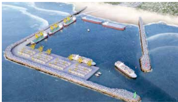
Croqui da DTA Engenharia Portuária e Ambiental - projeção estimada do Porto de Arroio do Sal

“Será uma oportunidade única de se conhecer o projeto do Porto Meridional em Arroio do Sal, esclarecer dúvidas e realizar entrevistas com os responsáveis pelo projeto”, ressalta a comunicação de Arroio do Sal. (Com informações de Melissa Maciel - ASCOM PMAS)