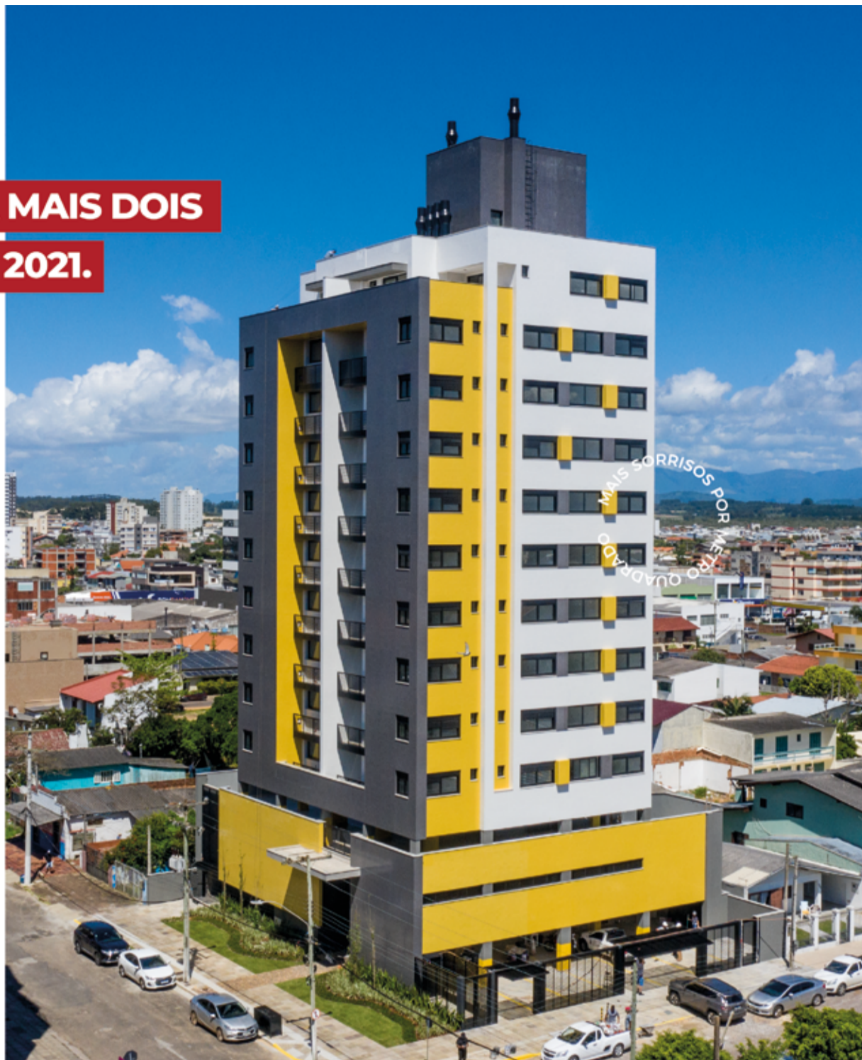
Residencial Vicino foi entregue no final de Outubro. Os bastidores da entrega você confere no Diário de Obra, no nosso canal do YouTube.