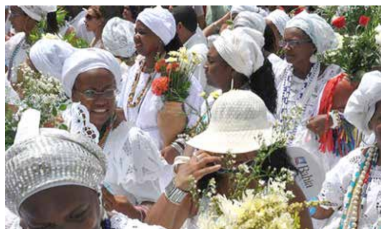
Imagem meramente ilustrativa

Moisés enquadra também sua ideia de PL lembrando que já existe uma lei na cidade, aprovada em 2021, que institui a "Semana Municipal da Cultura Evangélica", o que sugere os conceitos de Lai-