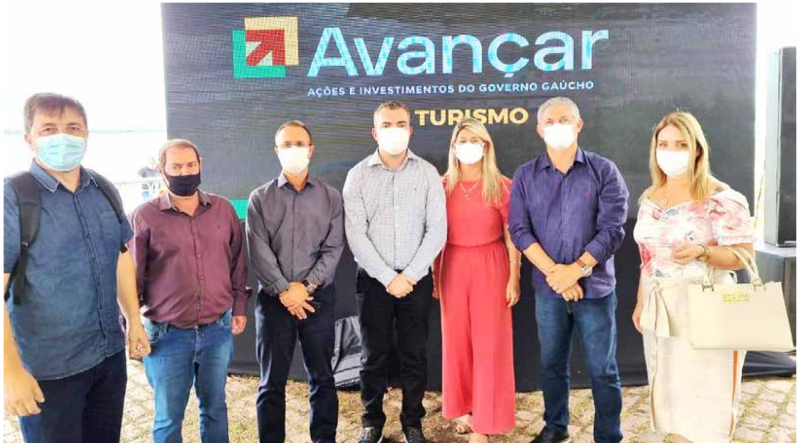
Prefeitos da região estavam juntos na formalização de verbas para a região em evento feito no cais do Porto na Capital Gaúcha

O ato de formalização faz parte do lançamento do programa Avançar no Turismo, com aporte de R$ 131 milhões em recursos do Estado para investimentos nesse