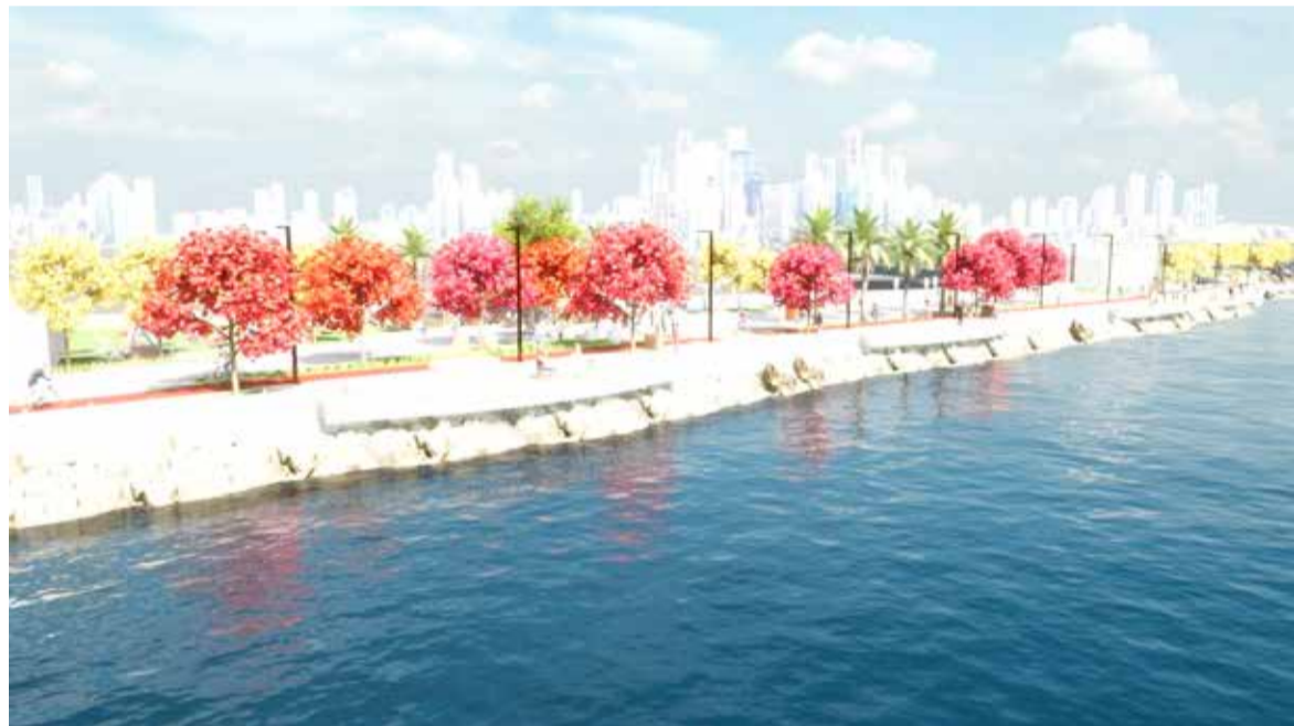
Maquete eletrônica mostra conceito moderno e arborizado do projeto

No projeto elaborado pela Secretaria Municipal de Planejamento e Participação Cidadã, visando a priorização do pedestre, áreas de passeios serão am-