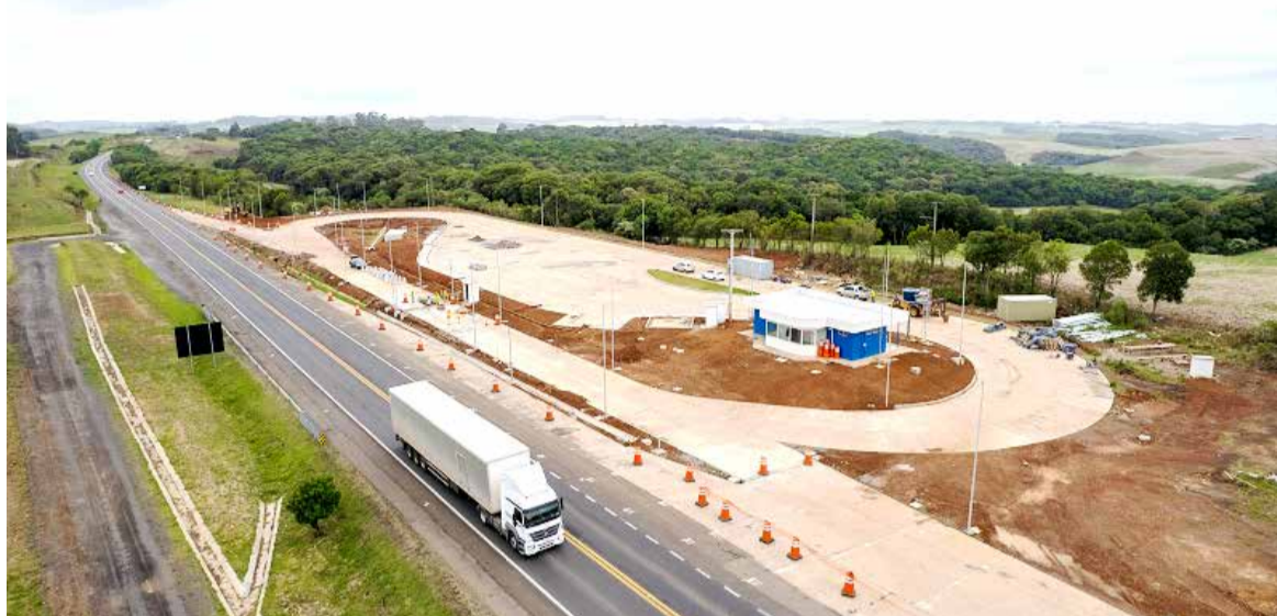
Estruturas auxiliarão na fiscalização de veículos de cargas nas rodovias diminuindo depreciação da estrada e aumentando a segurança dos motoristas em geral

Na balança de precisão o veículo passa por uma nova