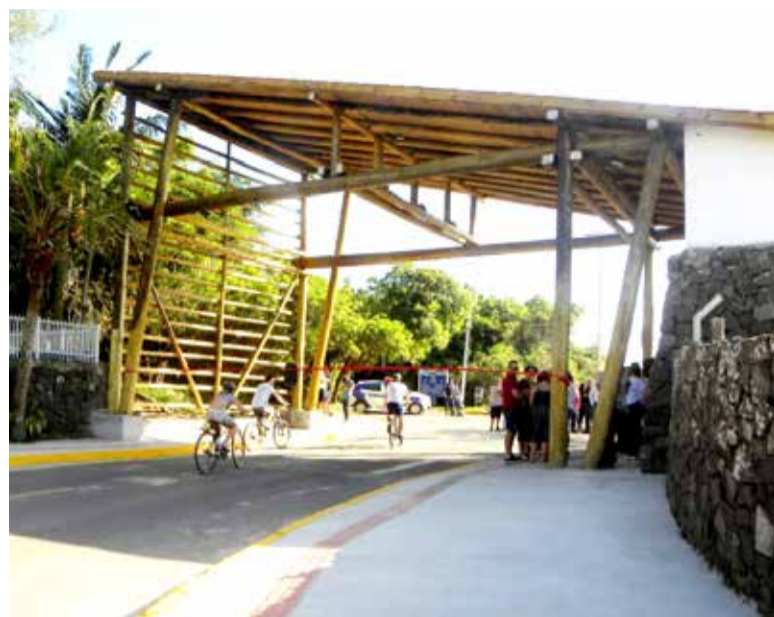
Entrada do Parque da Guarita

sulta pela numeração. As cancelas serão instaladas na parte lateral do pórtico de acesso, área que atualmente possui chão batido e serve como uma espécie de estacionamento. O local está sendo pavimentado para receber a estrutura. A empresa vencedora do processo licitatório para este serviço foi a Sigapark Automação Ltda, de Parobé.