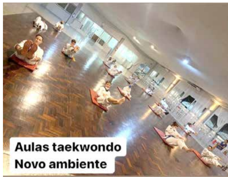
Aulas taekwondo Novo ambiente