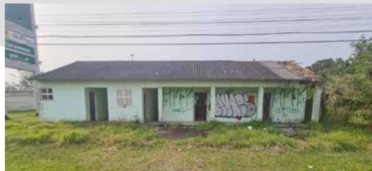
Escola abandonada está sendo alvo de furtos

há pelo menos mais três imóveis no mesmo estado e pelo mesmo motivo em Torres. O mais antigo é o da cooperativa Corlac, no Campo Bonito, desde o século passado (anos 1990). O segundo, a cooperativa de pesca que sequer funcionou por alguns meses e faliu, no bairro Salinas (desde 2008). O terceiro é o da antiga