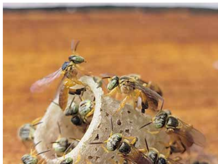
Abelhas Jataí, sem ferrão