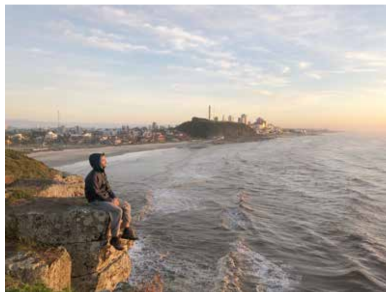
No Morro das Furnas, em Torres

trada. Havia muito Brasil pela frente ainda... Na semana que vem falo de quando retornei ao Tocantins e de uma das histórias mais marcantes que tenho até hoje, quando resolvi passar também uns dias no estado do Pará. Até lá!