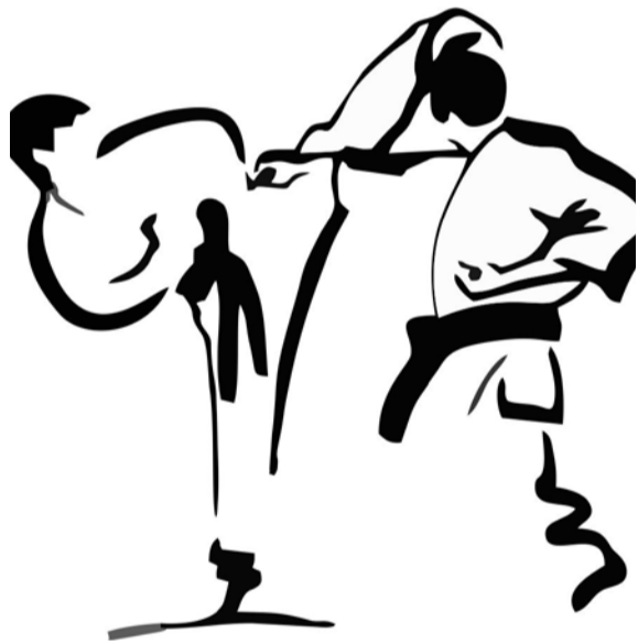
Imagem meramente ilustrativa