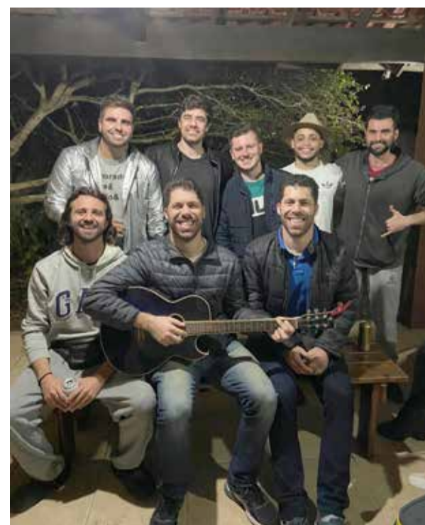
Pipe com amigos de Torres

Além disso, de que sempre que eu quiser, posso estar por lá de novo. Mensagem que deixei muito clara principalmente para os meus pais. Que minha vida continuaria sendo a estrada mas eu sempre estaria por ali.