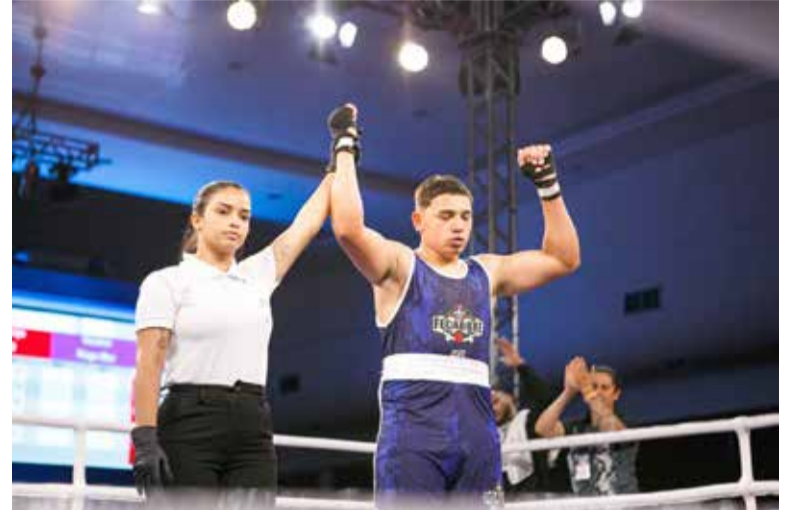
medalha da ONG Torrense nos campeonatos nacionais.