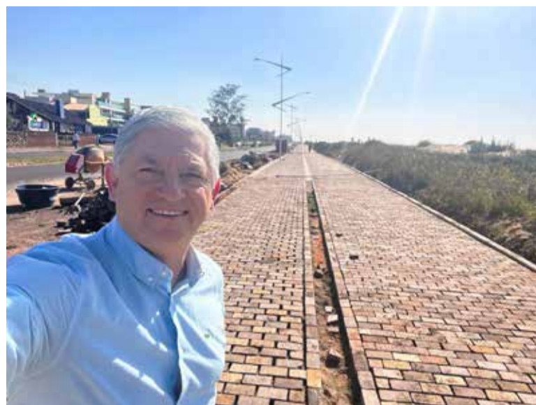
lor, contrato, descrição da obra, porcentagem de conclusão, entre outras informações.

A população pode acompanhar o andamento das obras, acessando o site da Prefeitura. No Menu, em Acesso Rápido, clicar em Transforma Torres (Pacote de Obras de Infraestrutura Urbana e Turística de Torres) e logo, em Mapa das Obras de Torres, buscar a obra de interesse. Neste espaço, constam informações sobre o início da obra, previsão de término, va-