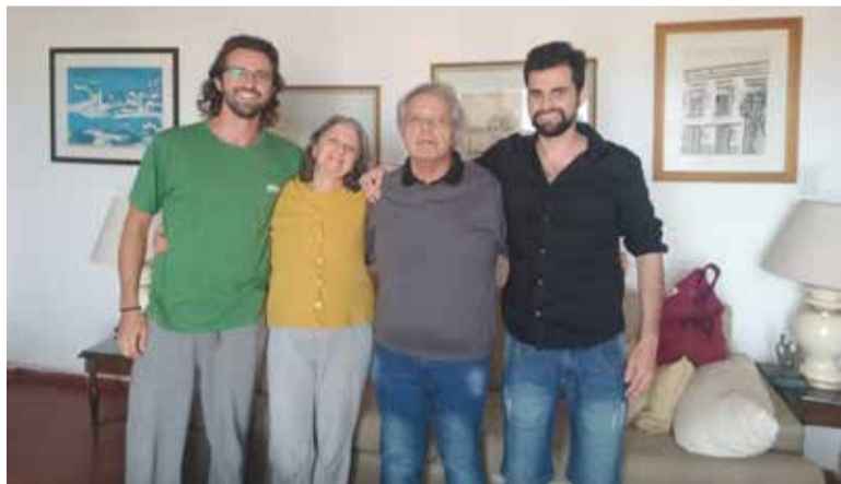
Com a família

Quando o avião começou a aterrissar na capital gaúcha, tive uma primeira sensação estranha. Ver aquela cidade de novo. Sentimentos bons e ruins ao mesmo tempo. A segunda grande sensação que tive foi a do frio. Era inverno no sul e eu, praticamente desde o início de minha viagem, frequentava apenas estados com muito calor. Já fui preparado e agasalhado. De Porto Alegre, já peguei um ônibus para Torres, cidade em que meus pais