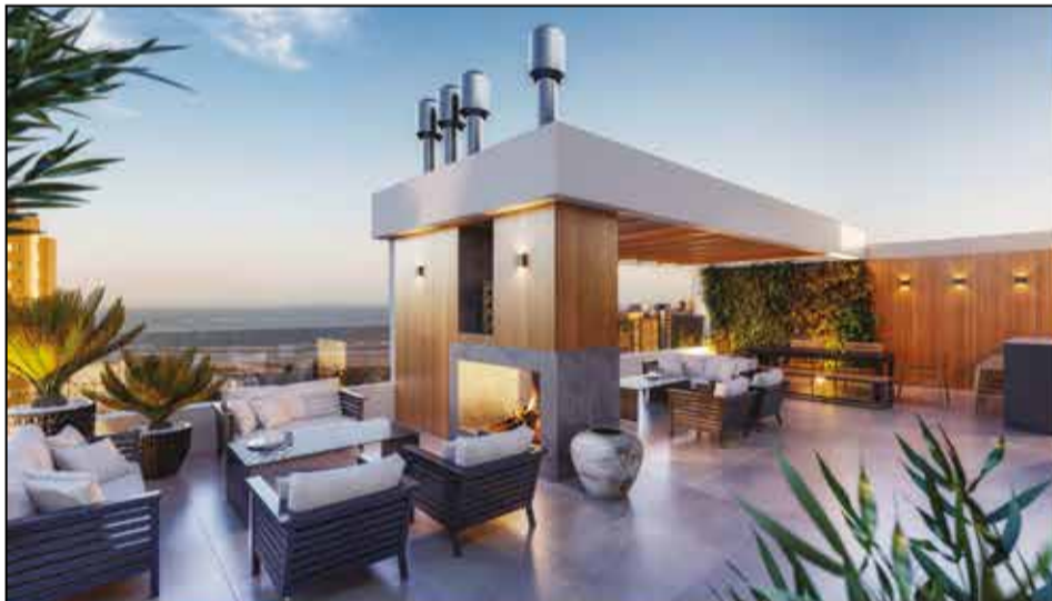
ROOFTOP COM VISTA RIO E MAR