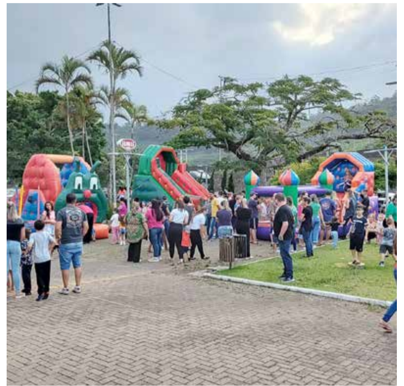
Festa das Crianças, dia 1º