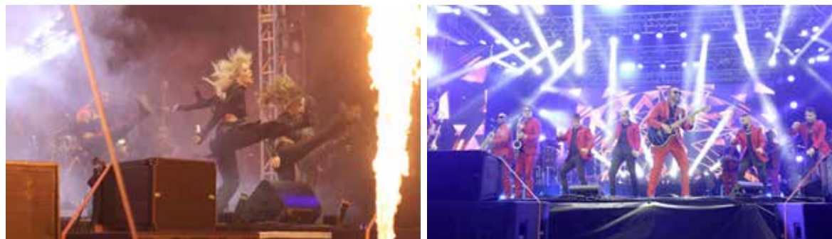
Shows de Luísa Sonza (e) e Alexandre Pires (d)

E no feriado de 1º de maio, última noite do Festival de Balonismo de Torres em 2023, a dupla sertaneja César Menotti e Fabiano fechou a agenda de shows nacionais do evento, cantando sucessos como Ciumenta, Fogão de Lenha, dentre outras.