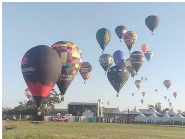
Vários balões reunidos para uma das provas durante o Festival de 2023