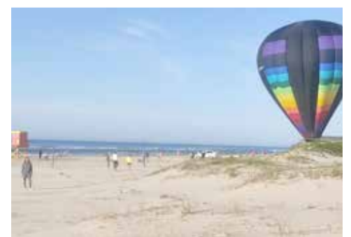
Um balão pousou na praia grande, e esquerda de cinza é a Liliana Cavalheiro Boll