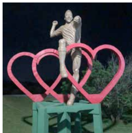
Rápida passagem por Três Corações, terra do Rei Pelé