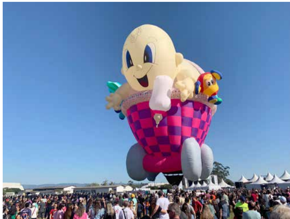
Balão em forma de carrinho de bebê gigante foi atração surpresa

Também chamaram atenção os peculiares balões de forma: foram 7 durante o evento, sendo um uma atração surpresa – um balão em formato de carrinho de bebê, que parece um brinquedo gigante. Com 40m de altura e 3.700 m 3 ., este foi premiado como balão mais bonito no Festival Internacional do México, e já esteve em diversos países.