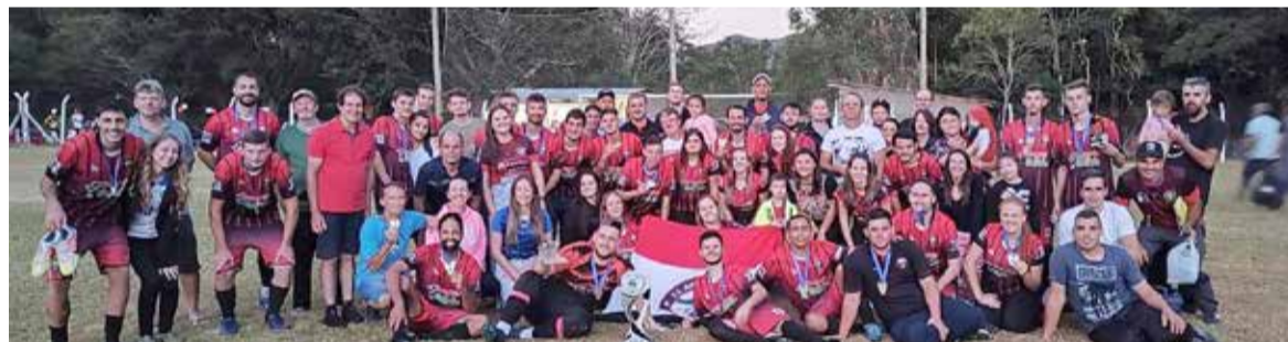
E.C. Rio do Terra – Vencedor da I Taça Cidade