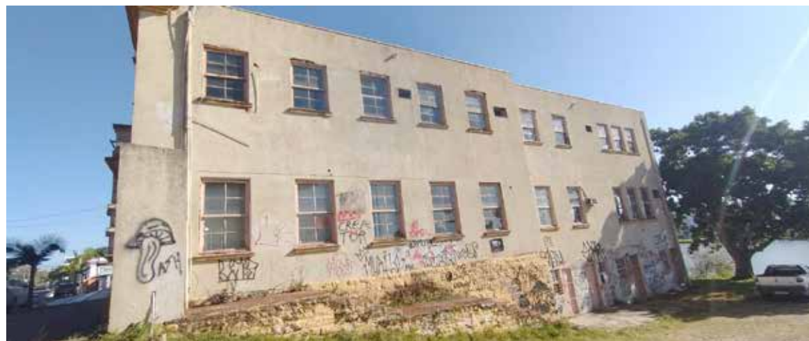
Pixações marcam paredes do museu inativo

-se de aplicar recursos federais oriundos de emenda parlamen-