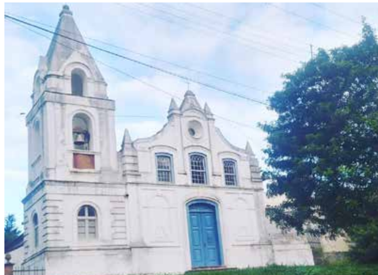
"A igreja foi inaugurada em 1824 e ampliada em 1857/58, quando passou por obras de manutenção. Em 1898 foi construída a torre, à esquerda da igreja, conforme inscrição em relevo existente ainda hoje".