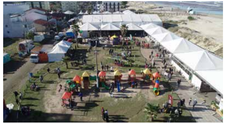
Festa do Pescador (foto) é um exemplo de Cultura local que o sistema deve organizar quando implementado

O Projeto de Lei deve ir a debate nas próximas sessões da Câmara Municipal. Ele pode receber emendas que a seguir também