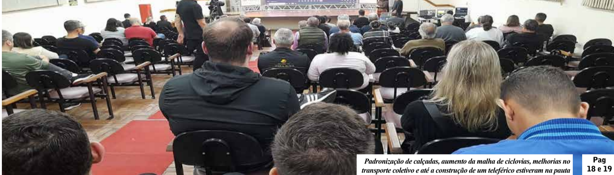
Padronização de calçadas, aumento da malha de ciclovias, melhorias no transporte coletivo e até a construção de um teleférico estiveram na pauta

SINTETIZANDO A APRESENTAÇÃO REALIZADA EM TORRES PARA O PLANO DE MOBILIDADE HUMANA SUSTENTÁVEL