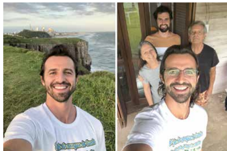
Pipe no Morro das Furnas (e); e com a família em Torres (d)

Essa foi uma angústia que me acompanhou por uns 3 meses, quase que diariamente. Porque eu já sabia que aquele meu estilo de vida não fazia mais sentido. Mas qual seria meu futuro? Como já disse, não queria decidir nada antes dessa volta para casa. Lembro também que algumas semanas antes eu havia feito um voluntariado em um hostel (albergue) em Jericoacoara, no litoral do Ceará, o qual os proprietários me fizeram uma oferta para ser gerente. E ainda aguardavam uma resposta minha. Que como eu havia falado para eles, só viria depois de eu chegar em casa. Enfim, essa chegada ao Rio Grande do Sul, meu estado, após mais de um ano da minha última visita, iria definitivamente ser o responsável por definir meu futuro. E eu estava ansioso por isso.