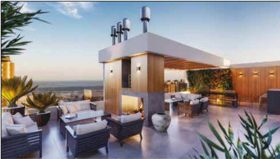
ROOFTOP COM VISTA RIO E MAR