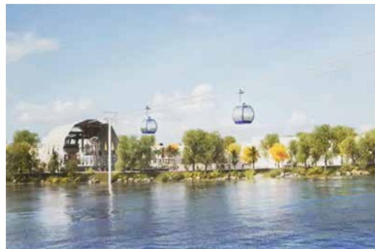
Teleférico ligando Lagoa ao Morro do Farol foi imaginado

Segundo as estimativas da GO Projetos, a curto prazo o investimento para o Plano de Mobilidade Humana Sustentável, com investimentos em diversos pontos já destacados neste texto e outros ainda, seria de cerca de R$42 milhões, sendo que o custo total (contabilizando investimentos de curto, médio