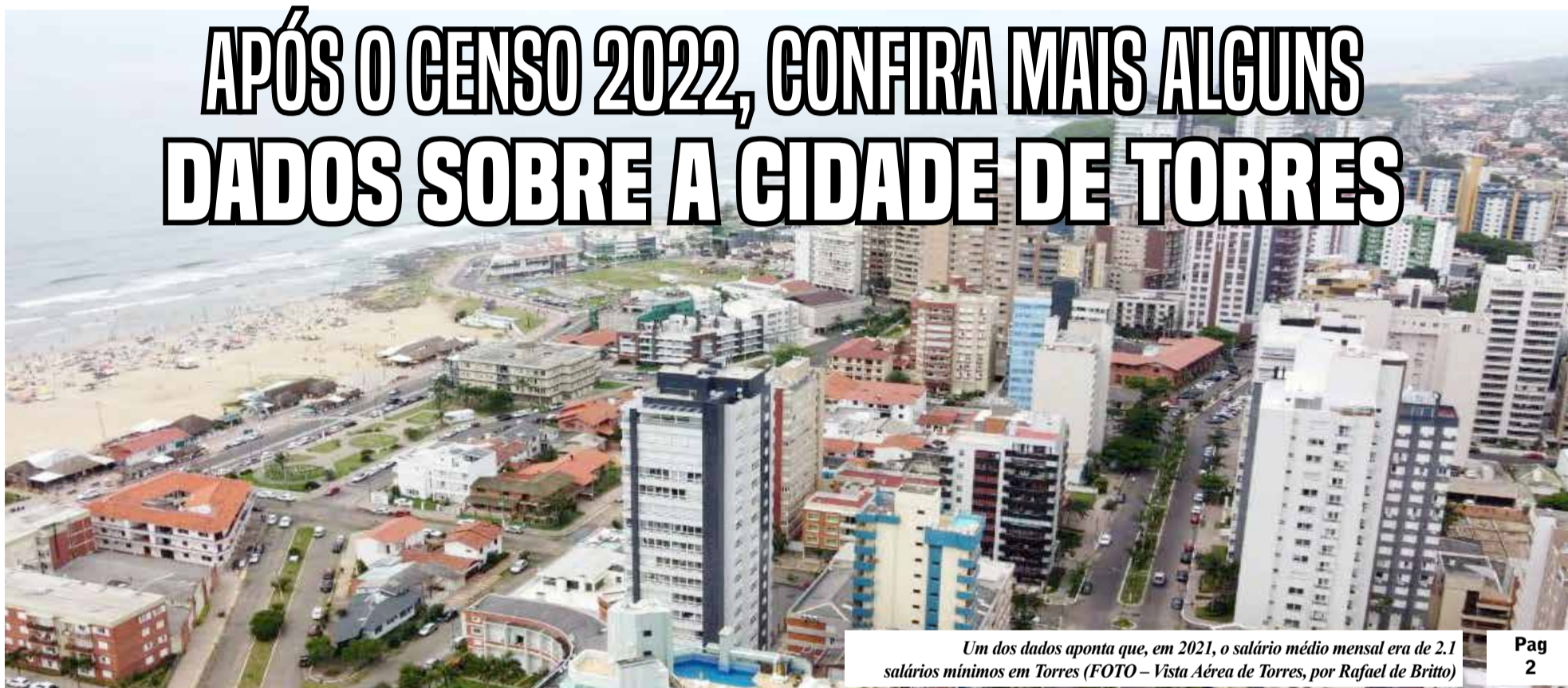
Um dos dados aponta que, em 2021, o salário médio mensal era de 2.1 salários mínimos em Torres (FOTO – Vista Aérea de Torres, por Rafael de Brito)