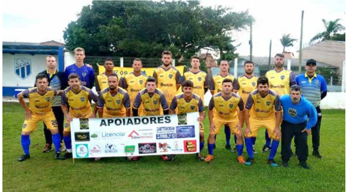
Equipe do Meia Boca foi um dos destaques da 4ª rodada, com vitória fora de casa

PRÓXIMA RODADA - No próximo domingo, 23 de julho, acontece a quinta rodada do Municipal de Futebol de Campo de Torres. No campo do Torrense, terá Adem x Heineken; no Manecão os jogos são entre CEI x Meia Boca; já no estádio Edu Matos Carneiro, se enfrentarão São João x Vida Jack e no São Brás o time da casa contra o Mara Azul. Os jogos dos Aspirantes começam às 13h15min e dos titulares às 15h15min.