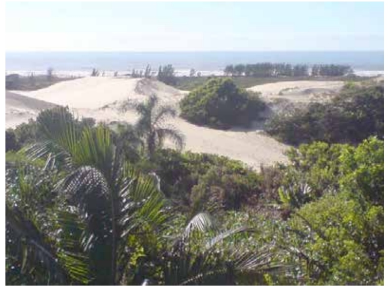
Parque Itapeva em Torres: Trilhas podem ser solicitadas, após marcação junto aos gestores

Para as plantas, não é recomendado arrancá-las ou degradá-las. Leve da natureza apenas fotos, boas recordações e lembre-se que esse ambiente vai proporcionar uma experiência maravilhosa a você e a quem vier desbravar o Brasil no futuro.