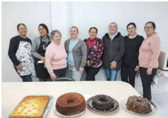
Oficina de bolos foi um dos destaques recentes