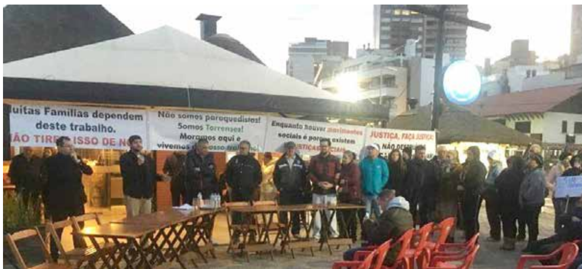
Evento aconteceu junto aos próprios estabelecimentos. MPF considera que quiosques estão em área de preservação permanente. Já defesa indica que ela se trata (e sempre se tratou) de Área Urbana Consolidada

munidade local ligada a este tipo de empreendimento. Todos os presentes manifestaram-se a favor da manutenção dos Quiosques torrenses, assim como a favor da segurança jurídica para que os empresários envolvidos possam investir em manutenção e melhorias em seus estabelecimentos gastronômicos. Os autores do ato tiveram, inclusive, apoio e participação da população local que defende os mesmos interesses, das dezenas de famílias e trabalhadores que seriam diretamente prejudicados por uma eventual demolição dos quiosques que abrigam os empreendimentos. É que os negócios são a maioria das vezes a única fonte de renda