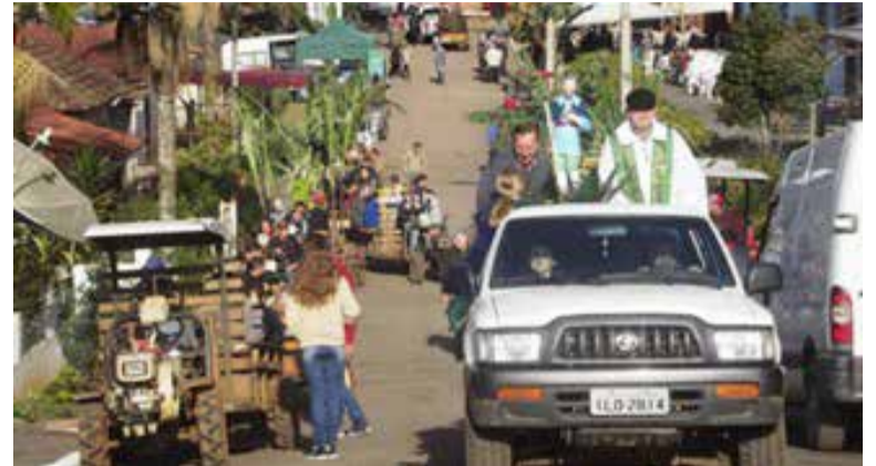
FOTO DE ARQUIVO: Procissão motorizada é um dos momentos marcantes da festa

A celebração contará, também, com a exposição de implementos agrícolas antigos,