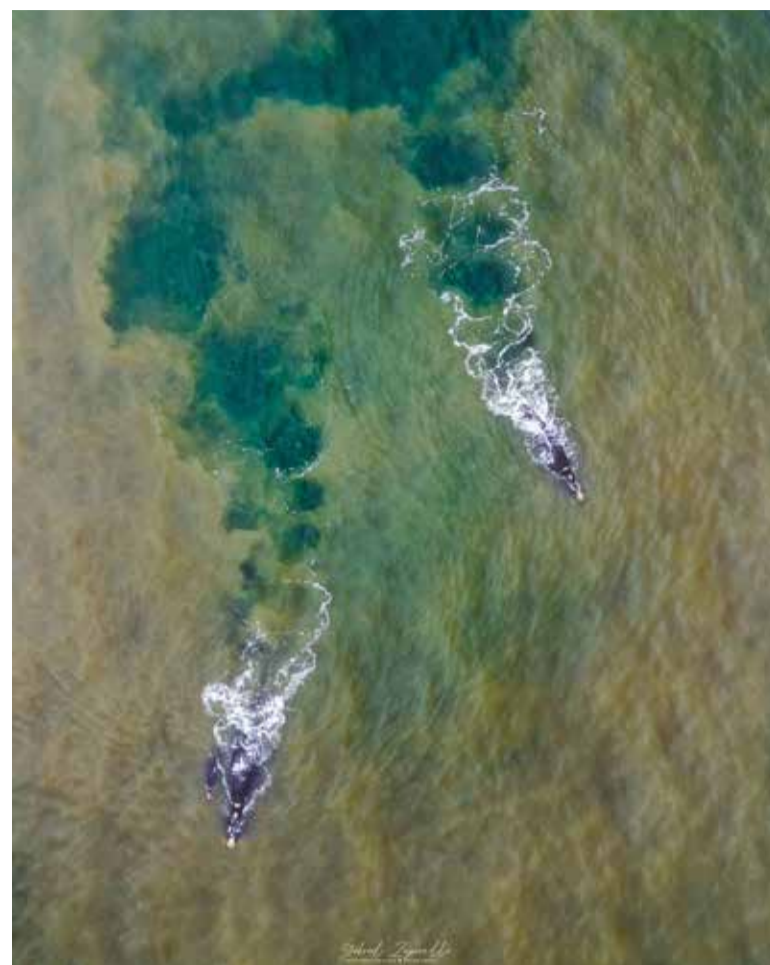
Baleias nas proximidades da Praia da Guarita

– A baleia-franca é a única espécie de baleia do Atlântico Sul que não apresenta nada