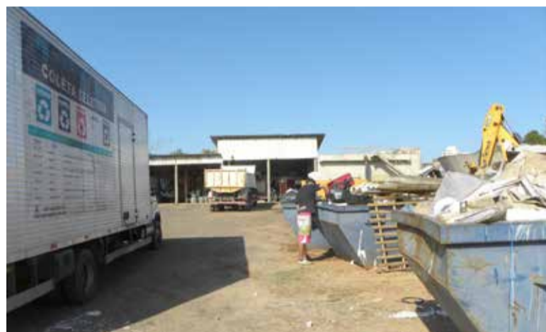
Imagem meramente ilustrativa - prefeitura de Torres