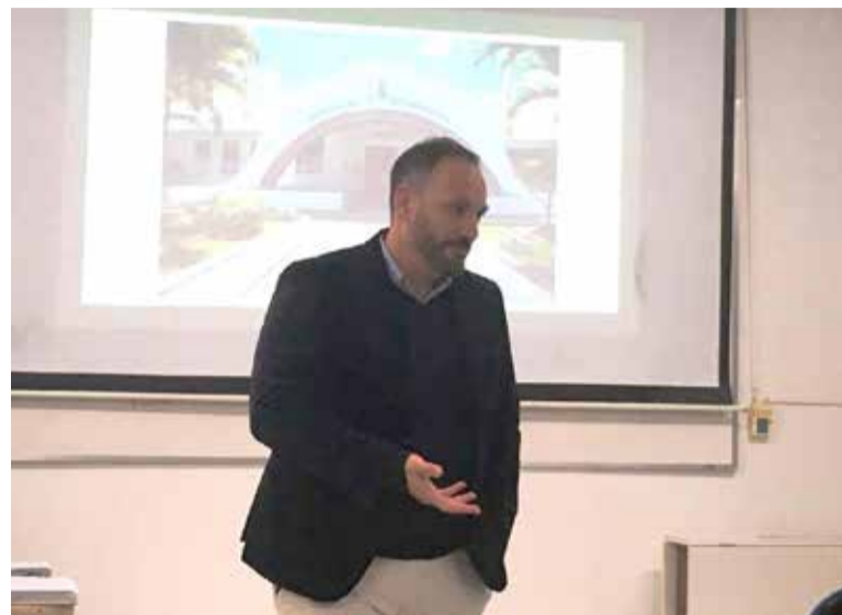
Diretor da entidade de saúde esclareceu que o processo é tranquilo por conta de ser troca de gestão, não de venda aberta

sões que se apresentaram após o anúncio da troca de comando do estabelecimento de Saúde - principalmente acerca dos serviços oferecidos pelo SUS para os torrenses e realizados pelo hospital.