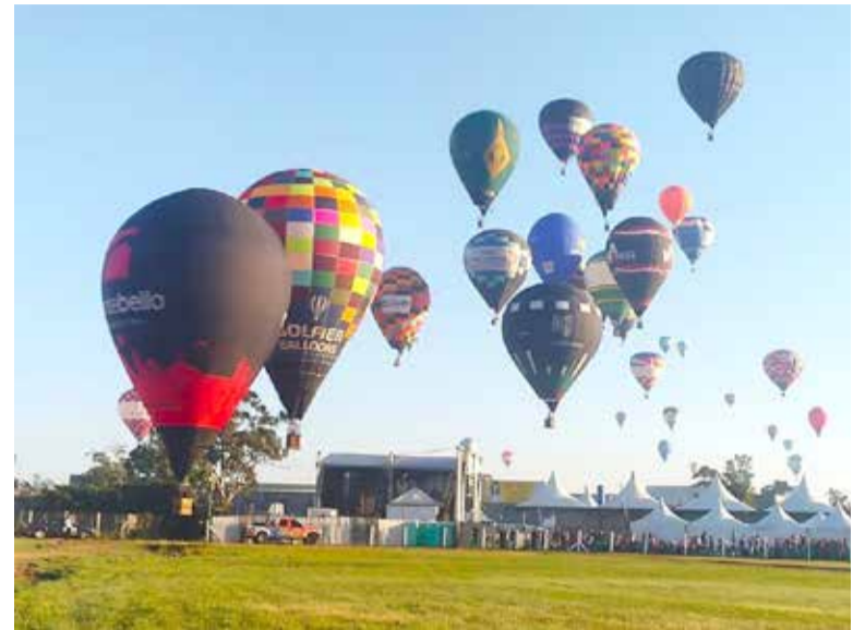
Vários balões reunidos para uma das provas do Festival Internacional do Balonismo de 2023, em Torres

A proposta busca potencializar ainda mais o turismo de Torres através da atividade do balonismo, amplamente difundida na cidade. Torres possui diversos balonistas profissionais e sedia, anualmente, o tradicional Festival Internacional de Balonismo, evento que há mais de 30 anos reúne dezenas de pilotos em seus balões, shows nacionais, atrações paralelas e milhares de turistas, movimentando a economia da região.