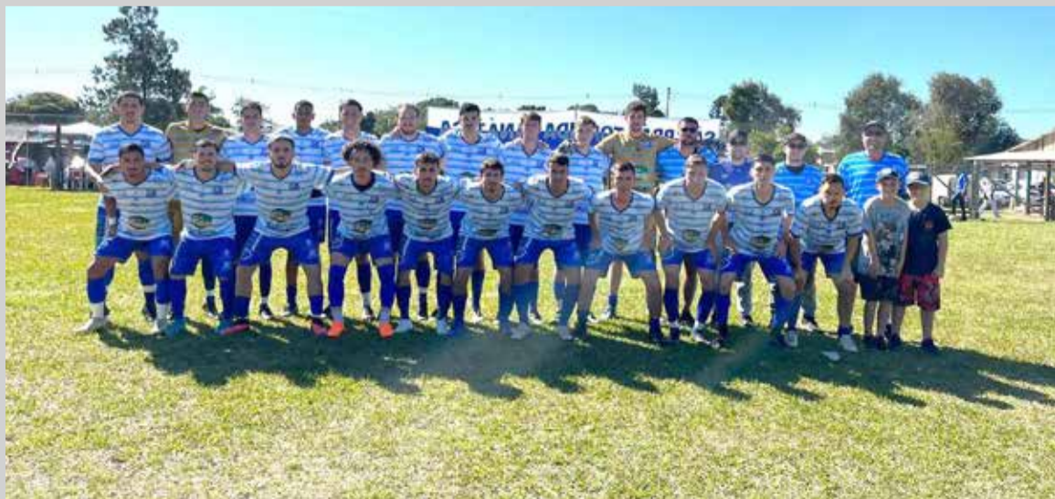
Equipe do São Brás é uma das qualificadas para as semifinais