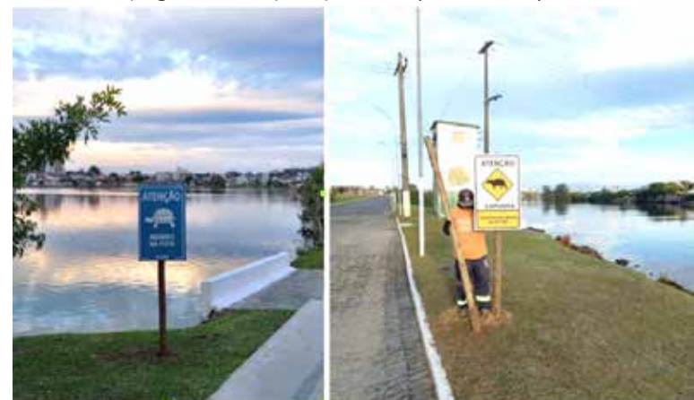
Avisos simples da existência de animais já foram colocados em 2021, na Lagoa e na margem do Mampituba