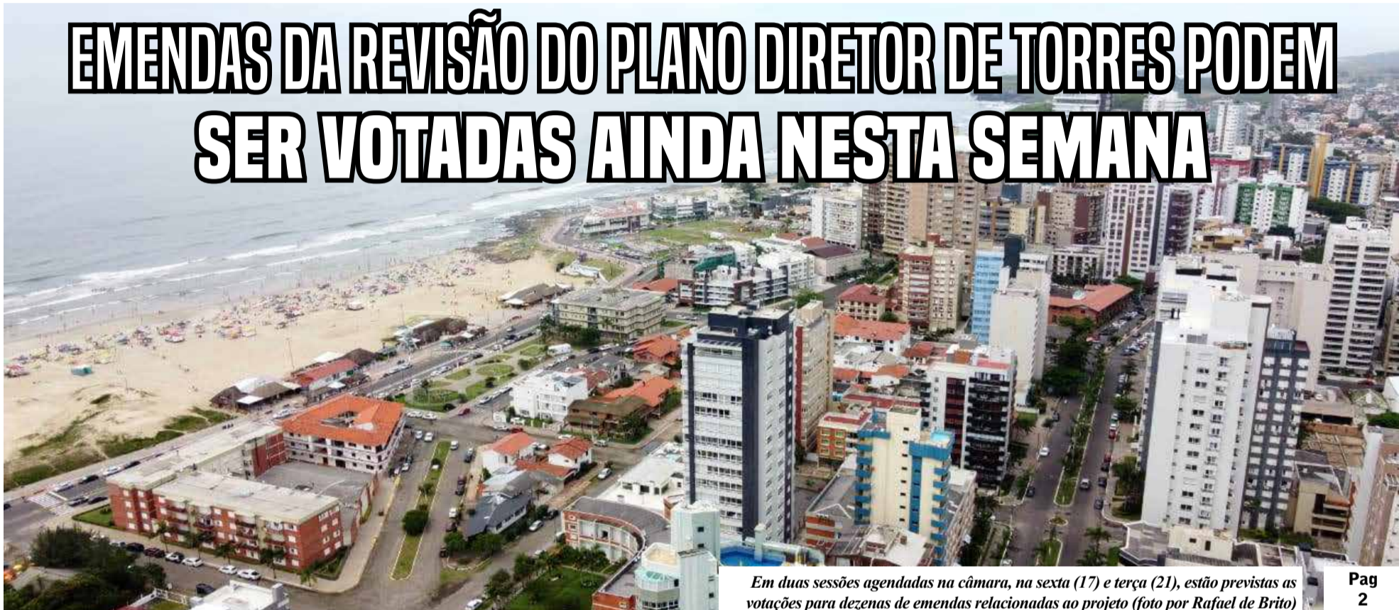
Em duas sessões agendadas na câmara, na sexta (17) e terça (21), estão previstas as votações para dezenas de emendas relacionadas ao projeto