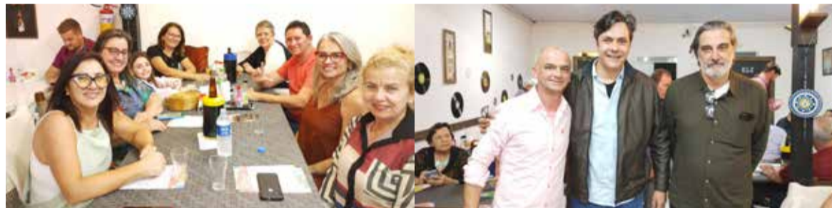
Petistas tradicionais prestigiaram o jantar partidário em Torres (e), que recebeu assessores do ministro Paulo Pimenta (d)

Boa parte dos militantes do Partido dos Trabalhadores de Torres estavam presentes