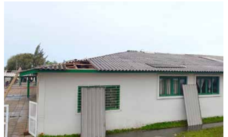
Uma das escolas danificadas pelo temporal em Arroio do Sal