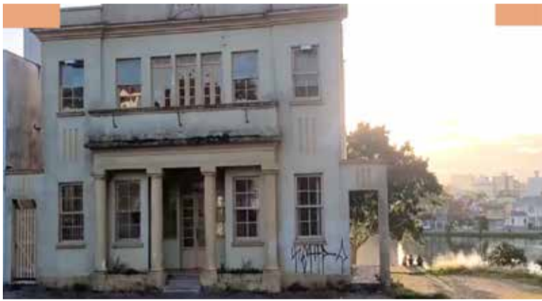
Museu Histórico de Torres, prédio da antiga prefeitura

8 - O Farol de Torres, inaugurado no ano de 1912 e localizado na Torre Norte.