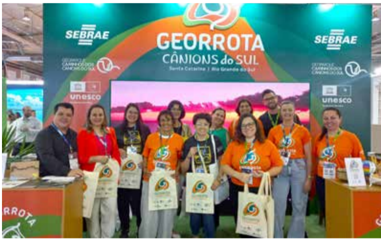
Torres e o Geoparque participaram da Festuris, em Gramado

No dia 23 de novembro, quinta-feira, será realizado em Torres a elaboração do roteiro rural da Georota Cânions do Sul. A atividade vai ocorrer das 13h30min às 17h, na sede do Sindicato dos Trabalhadores Rurais de Torres, com a participação de todas as empresas e demais interessados em integrar este Grupo de Trabalho. O grupo de trabalho tem como objetivo fortalecer a cooperação e a promoção turística do território, será um Workshop de Turismo Rural.