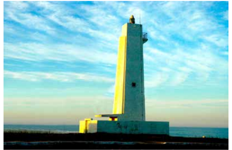
3º Farol de Torres é um dos Patrimônios destacados

4 - Os sítios arqueológicos e coleções cadastrados pelo Instituto do Pa-