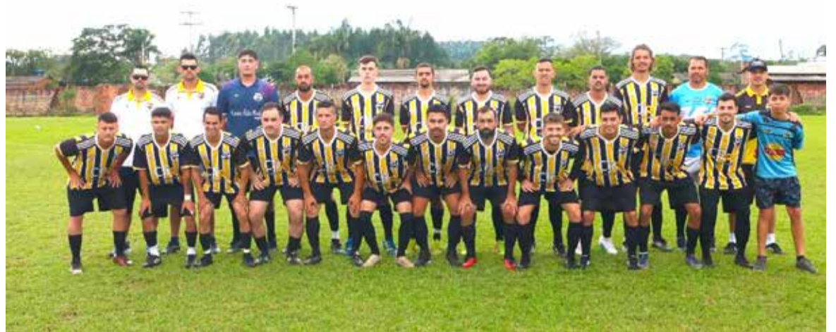
Plantel da equipe campeã da segundona, Amigos do Adri