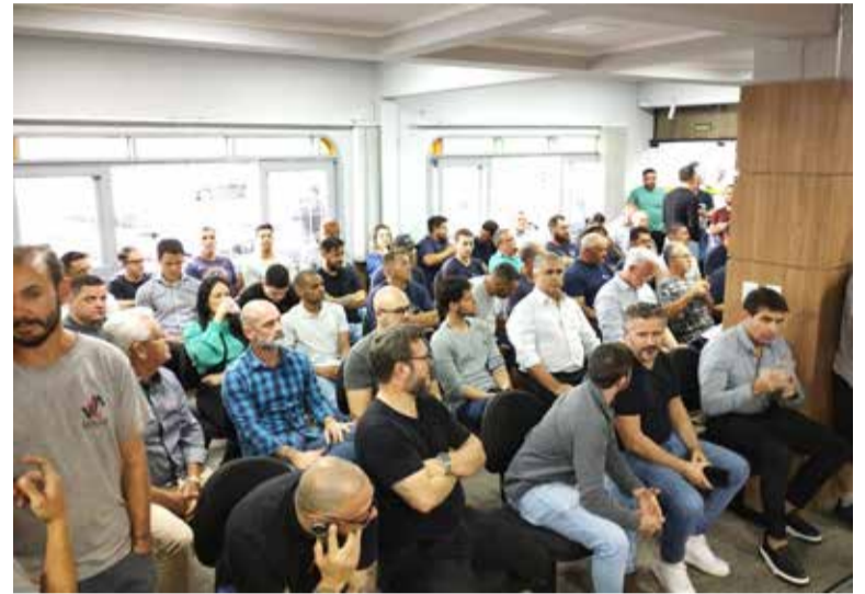
Construtores, corretores e trabalhadores da construção civil lotaram plenário da Câmara na segunda-feira (13/11) e devem voltar a Casa Legislativa na sexta (17/11)

outros locais naturais e edificações. E foram apresentadas também emendas que afirmam, na justificativa, a intenção de maior preservação do meio ambiente e maior insolação da cidade, emendas que visam diminuição da altura máxima de prédios em zonas de beira de praia no centro da cidade, além de diminuição de índices de aproveitamento na cobertura das edificações em outras áreas de Torres.