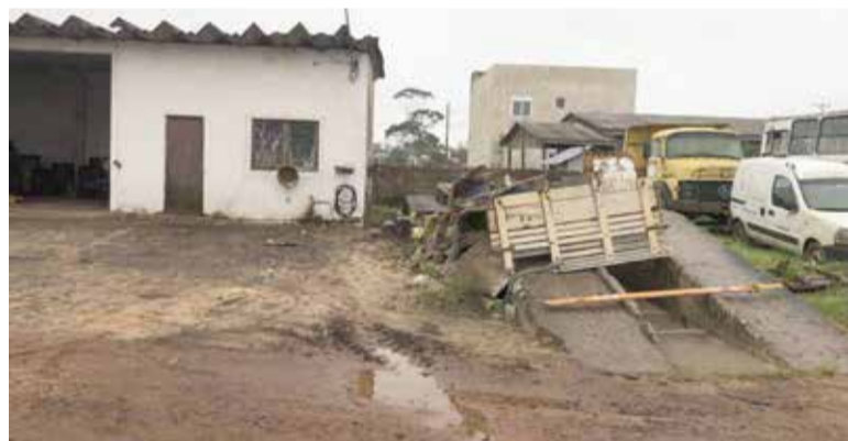
Imagem da área onde funcionava tempos atrás garagem e rampa de lavagem de veículos

A 1ª Vara Federal de Capão da Canoa (RS) condenou o Município de Torres (RS) ao pagamento de R$ 20 mil como indenização por danos ambientais hídricos no Rio Mampituba. A condenação foi motivada pelo desenvolvimento de atividade de lavagem de veículos em área de preservação constante, que acarretou na poluição do rio, através do vazamento de efluentes.