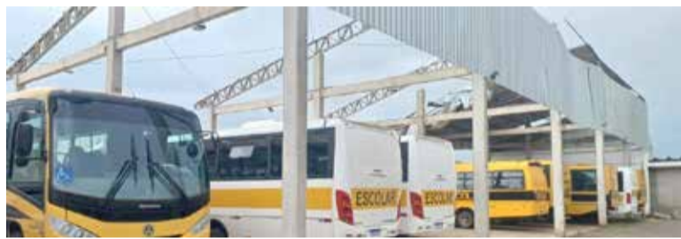
Garagem onde ficam os ônibus escolares também foi danificada

SCAB se identificou a dimensão e a intensidade dos estragos causados pelo efeito climático, sendo assim, se optou pelo Decreto", ressalta a municipalidade.