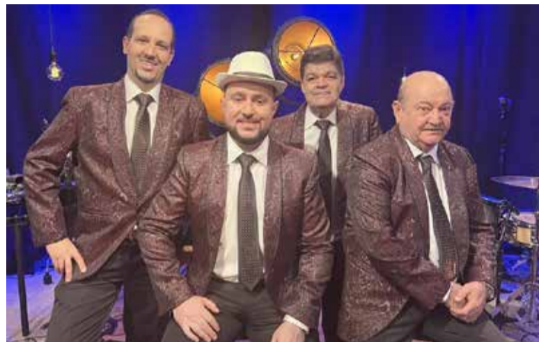
Grupo Demônios da Garoa

A 18ª Convenção Sesc Maturidade Ativa, reunirá grupos de todas as regiões do Rio Grande do Sul para incentivar um envelhecimento ativo e saudável e celebrar os 20 anos do Programa Maturidade Ativa no Estado. A programação, que conta ainda com atividades culturais, como oficina de circo, festa com DJ, passeios turísticos, palestras, jogos, atendimentos de saúde e outras ações também estarão disponíveis para o público 50+.