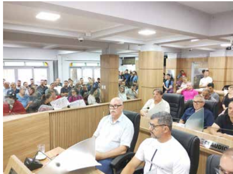
Pessoas de várias vertentes participaram da sessão que votou mais de 140 emendas, a maioria rejeitada