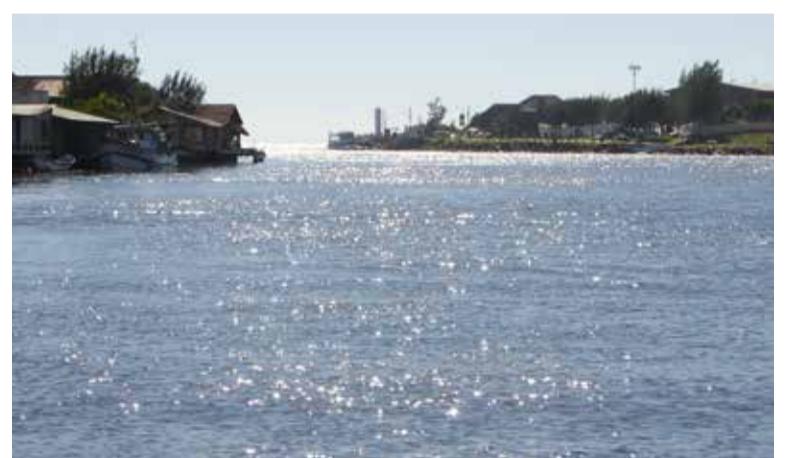
Rio Mampituba (foto meramente ilustrativa – em TRF 4)

O magistrado julgou procedente a ação condenando o réu à cessão imediata de lançamentos de efluentes no canal hídrico, à instalação de esgoto residencial regular e à limpeza de resíduos lançados ao canal. Ele ainda pagará R$ 10 mil por danos extrapatrimoniais e R$ 5 mil por danos patrimoniais. Cabe recurso ao TRF4.