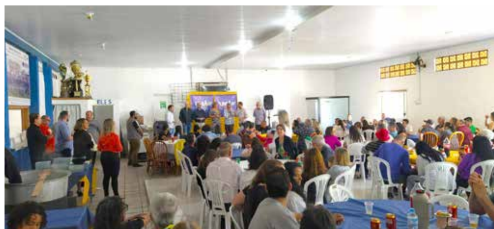
Salão do Mar Azul ficou cheio de partidários do União Brasil, de Torres e de fora da cidade