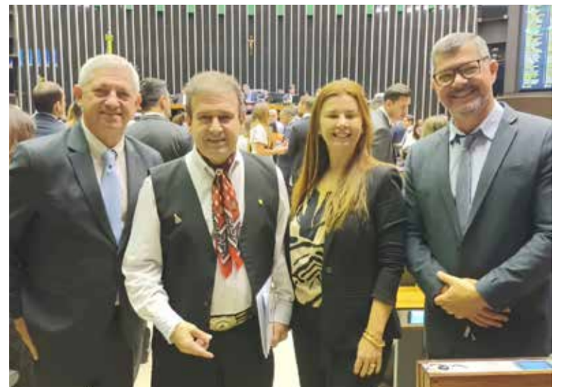
cial de Assuntos Federativos, solicitando liberação dos recursos da