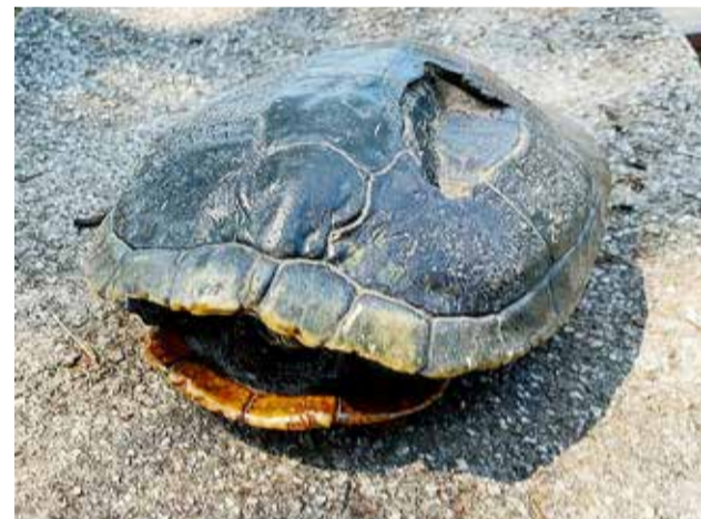
Uma das tartarugas apresenta deformação com afundamento e rachadura no casco, possivelmente resultante de atropelamento em tempo anterior

animais mortos. "Além do alto número de animais que morrem atropelados, também há os que sobrevivem mutilados, agonizantes, em extremo sofrimento", ressaltam, concluindo: "A criação desta prainha cercada é uma forma inteligente e responsável de compensar o meio ambiente pelo que lhes foi indevidamente retirado e com certeza será um novo ponto turístico que encantará visitantes, turistas e moradores de Torres, seguindo os preceitos da modernidade do turismo ecológico".