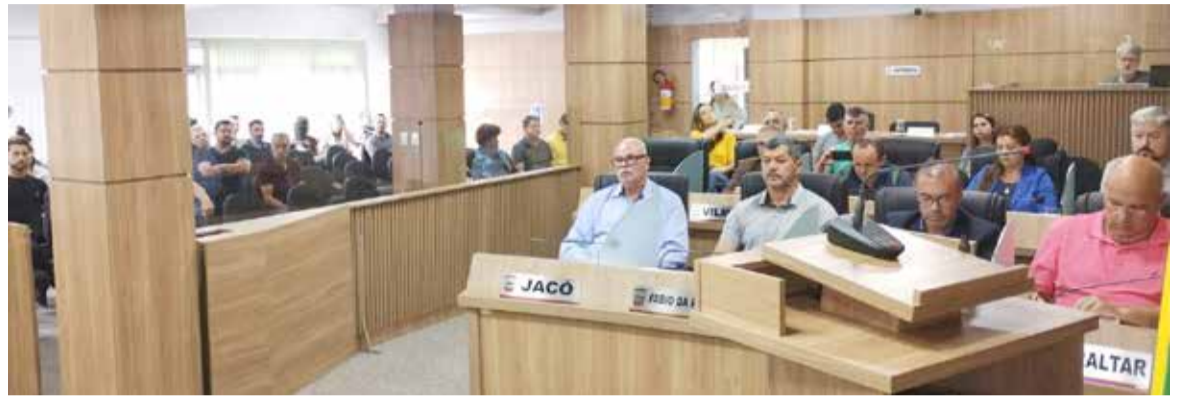
Plenário da Câmara na sessão extraordinária de quarta (29)

Foram apresentadas 142 emendas, sendo 52 rejeitas, 3 retiradas, 1 prejudicada e 86 foram aprovadas e agora fazem parte do Plano Diretor da cidade. As emendas foram votadas em bloco, mesmo quando qualquer vere-