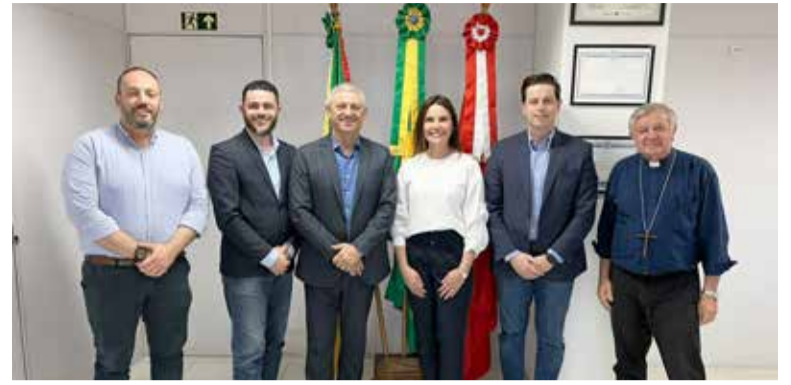
Representantes do IBSAÚDE, da Prefeitura de Torres, da AESC e da Diocese de Osório estão juntos no processo de sucessão da gestão do hospital em Torres

O IBSAÚDE dedica-se também ao processo do conhecimento no ensino e na aprendizagem permanentes, por meio de intercâmbios e acordos de cooperação com organismos, insti-