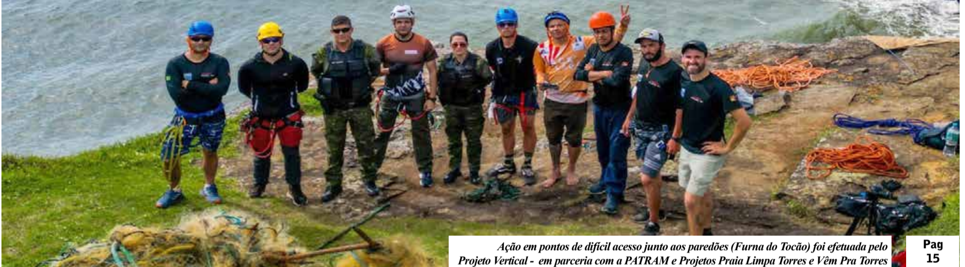
Ação em pontos de difícil acesso junto aos paredões (Furna do Tocão) foi efetuada pelo Projeto Vertical - em parceria com a PATRAM e Projetos Praia Limpa Torres e Vêm Pra Torres