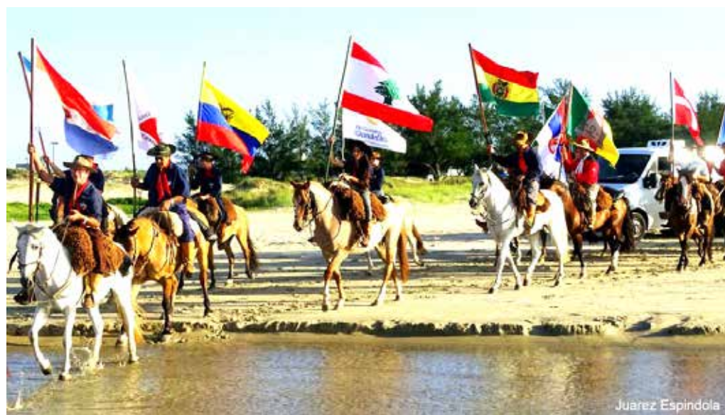
Cavalgada do mar em 2016