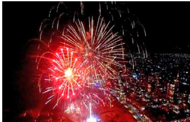
Show de fogos em Réveillon recente em Torres