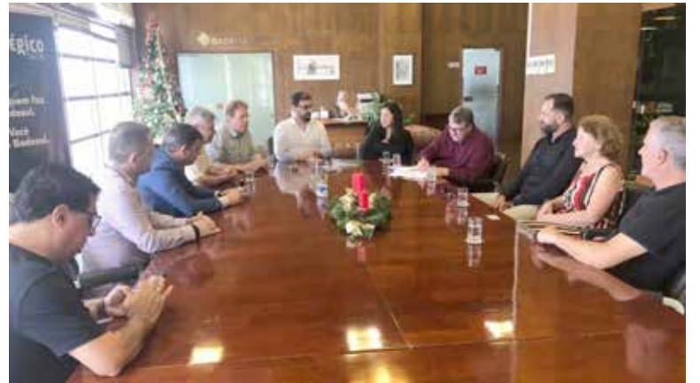
Contrato foi assinado na própria agência de fomento

O objetivo do programa criado pelo Badesul é fortalecer os municípios gaúchos. Em 2023, foram destinados mais de R$ 122 milhões a 27 cidades, beneficiando, aproximadamente, 349 mil pessoas. Melhorias na infraestrutura urbana e rural, construção de postos de saúde e aportes no turismo regional são exemplos de destino desses valores.