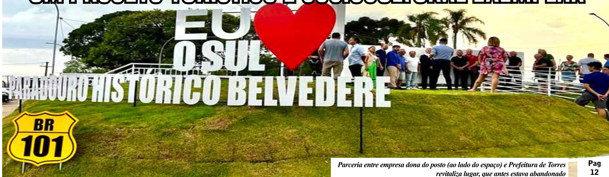
Parceria entre empresa dona do posto (ao lado do espaço) e Prefeitura de Torres revitaliza lugar, que antes estava abandonado