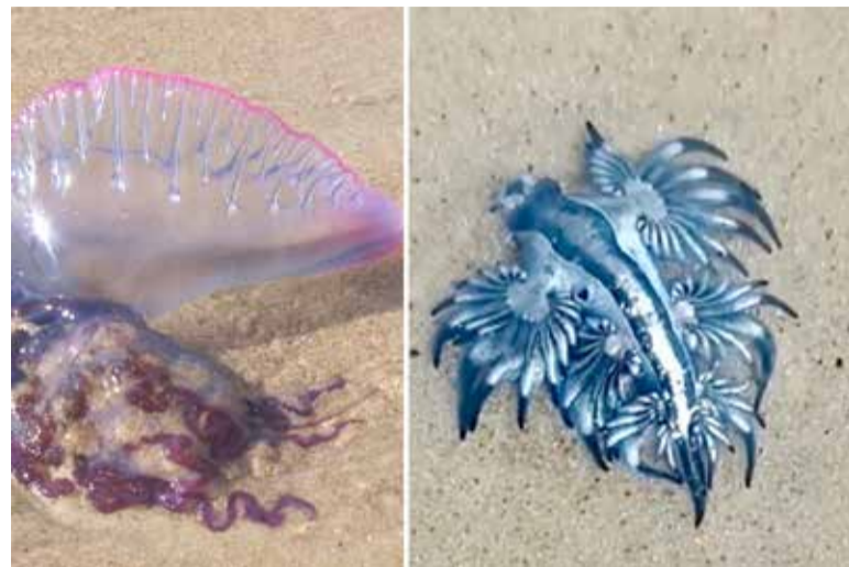
Caravela-portuguesa (e) e dragão azul (d) foram encontrados em Arroio do Sal

-Lave o ferimento com água do mar, para remover os tentáculos que ficaram na pele.