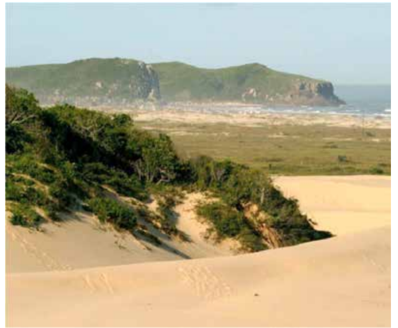
Parque Itapeva (PEVA) preserva uma variedade de ambientes junto a costa de Torres