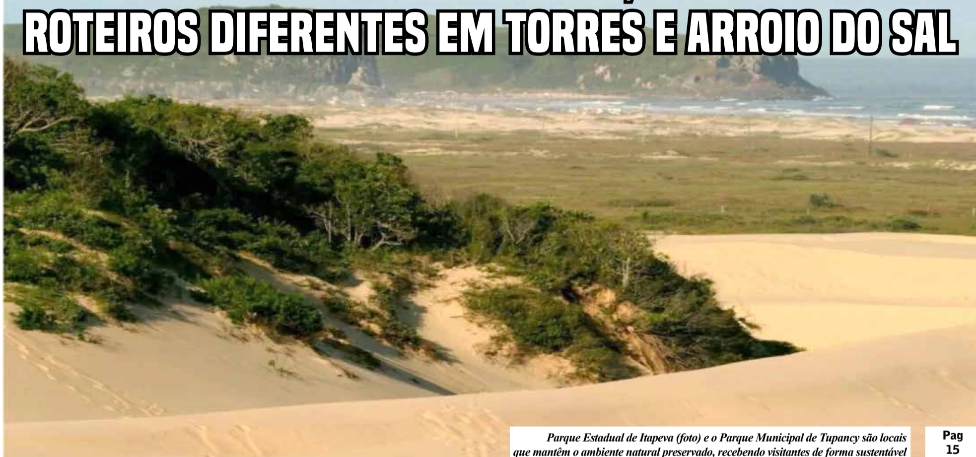
Parque Estadual de Itapeva (foto) e o Parque Municipal de Tupancy são locais que mantêm o ambiente natural preservado, recebendo visitantes de forma sustentável