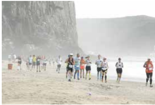
Saída da TTT em Torres, no ano de 2016

Criada em 2005, Antônio conta que a Travessia começou como uma brincadeira entre amigos. "Fizemos três equipes de oito pessoas e disputamos entre nós a primeira TTT. A primeira corrida teve 24 pessoas, a segunda 200 pessoas até chegar a média de três mil corredores por