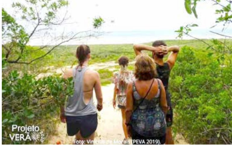
Trilha no Projeto Verão PEVA 2019

No começo dos anos 2000 o Estado do RS tratou de decretar como Unidade de Proteção Integral o Parque Estadual de Itapeva (PEVA), localizado em Torres. Poucos anos antes (no final dos anos 90) o município de Arroio do Sal também se mobilizou para preservar uma área especial, o Parque Natural Municipal Tupancy. Os visitantes de veraneio portanto têm estas duas opções para somar aos seus programas de férias ou de temporadas de passeio em Torres, Arroio do Sal e região. Ao visitar estes parques, eles podem conhecer as peculiaridades dos espaços através de trilhas, eventualmente acompanhadas de guias especializados, conhecerem os seres vivos de cada ecossistema.