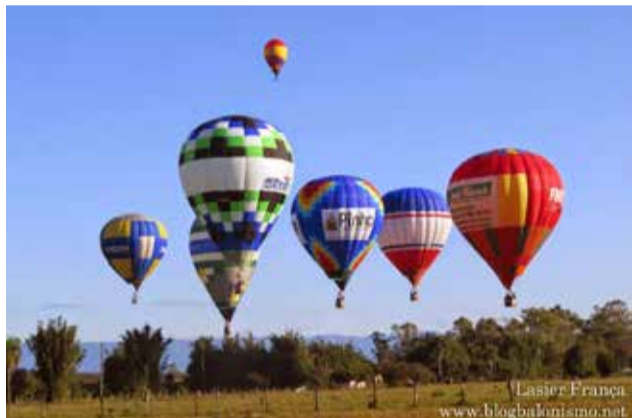
Balonistas em Torres

em parceria com a Secretaria de Desenvolvimento Rural e Pesca e Secretaria da Cultura e do Esporte.