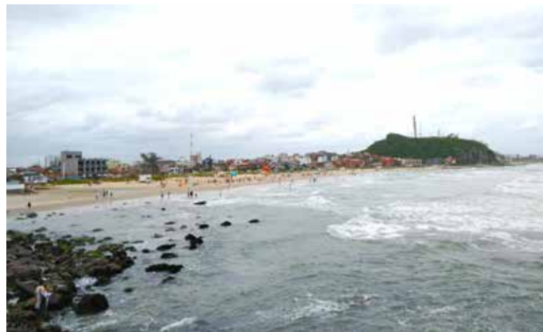
Praia da Cal

A divulgação semanal atualizada pela FEPAM – dos pontos próprios e impróprios – é divulgada sempre nas noites das sextas-feiras, portanto o sétimo boletim estará disponível na noite de 27 de janeiro. “A recomendação é que os banhistas evitem o mergulho nos pontos impróprios e arredores, especialmente junto às águas que chegam às praias por tubulação, arroios ou rios. O alerta vale especialmente para crianças, idosos e pessoas com baixa imunidade. Os principais sintomas após o mergulho em áreas contaminadas são diarreia, dor abdominal e enjoos”, afirma a FEPAM.