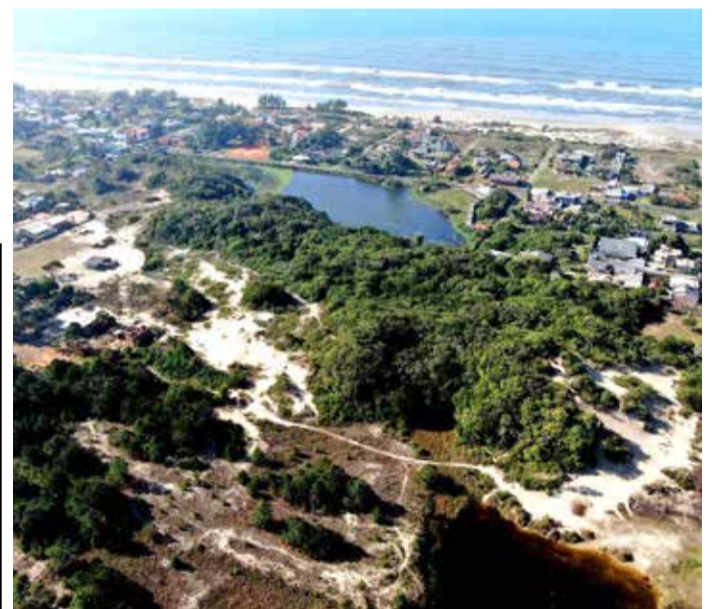
Parque Tupancy, em Arroio do Sal

e usufruir de trilhas com acompanhantes especializados.