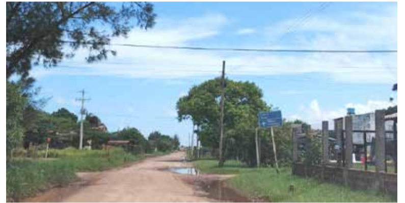
Trecho entre Paraíso e Estrela, na Praia Real, que também seria incluído na melhoria viária