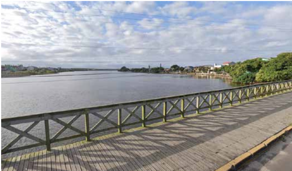
Braço morto do Rio Mampituba, Passo de Torres

Neste sábado (20), o Instituto do Meio Ambiente de Santa Catarina (IMA) divulgou o relatório de balneabilidade com as informações consolidadas das coletas realizadas na semana de 15 a 19 de janeiro. De acordo com as amostras coletadas nos 238 pontos monitorados pelo Instituto, 147 estão próprios para banho, o que representa 61,76%. No Sul catarinense, quatro pontos estão impróprios para banho – incluindo um ponto no Passo de Torres, o braço morto do Rio Mampituba. O outro ponto verificado no Passo de Torres (mar