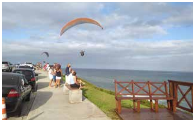
Topo do Morro do Farol atrai muitos visitantes em Torres

A matéria solicita que a prefeitura providencie uma “Operação Tapa Buraco”, na Rua Alferes Ferreira Porto (Subida do Morro do Farol). E na justificativa do pedido, constando no corpo do documento, os vereadores defendem que o