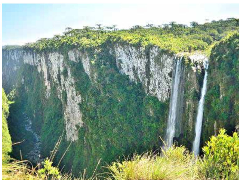
Aparados da Serra, parte do Geoparque

jetivo é organizar a cadeia turística na área de abrangência do Geoparque Caminhos dos Cânions do Sul e posicionar o destino como referência em geoturismo no Brasil. Integram o projeto os municípios de Morro Grande, Jacinto Machado, Praia Grande e Timbé do Sul, em Santa Catarina, além de Cambará do Sul, Mampituba e Torres, no Rio Grande do Sul.