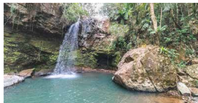
Trilha da Cachoeira Mar Azul, em Mampituba é exemplo de opção para ecoturismo

descidas de morros da Mata Atlântica, até chegar na cachoeira. A cachoeira possui piscina natural onde é possível se refrescar em águas limpas e cristalinas. Próximo à queda d'água existem escadas suspensas de madeira, colocadas lá pelos empreendedoras do equipamento, onde pessoas podem desfrutar de vista exuberante em meio ao ambiente natural da mata. A trilha é considerada de nível médio de dificuldade, e é aconselhável levar água, repelente, boné, protetor solar, roupas confortáveis, tênis ou bota de trilha, além, é claro, de roupas de banho.