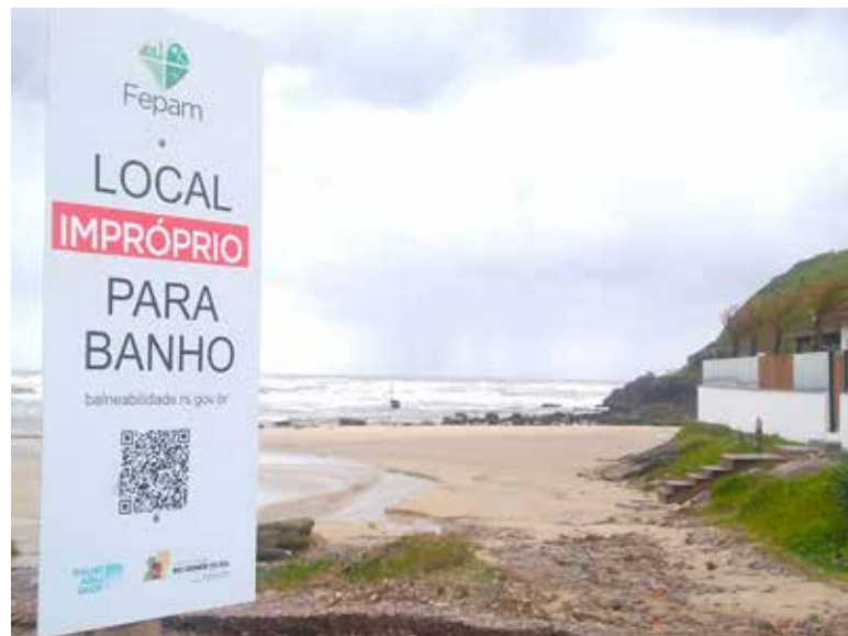
Placa indicativa no canto da Praia da Cal, na última semana

A divulgação semanal atualizada pela FEPAM – dos pontos próprios e impróprios – é divulgada sempre nas noites das sextas-feiras, portanto o oitavo boletim estará disponível na noite de 02 de fevereiro. “A recomendação é que os banhistas evitem o mergulho nos pontos impróprios e arredores, especialmente junto às águas que chegam às praias por tubulação, arroios ou rios. O alerta vale especialmente para crianças, idosos e pessoas com baixa