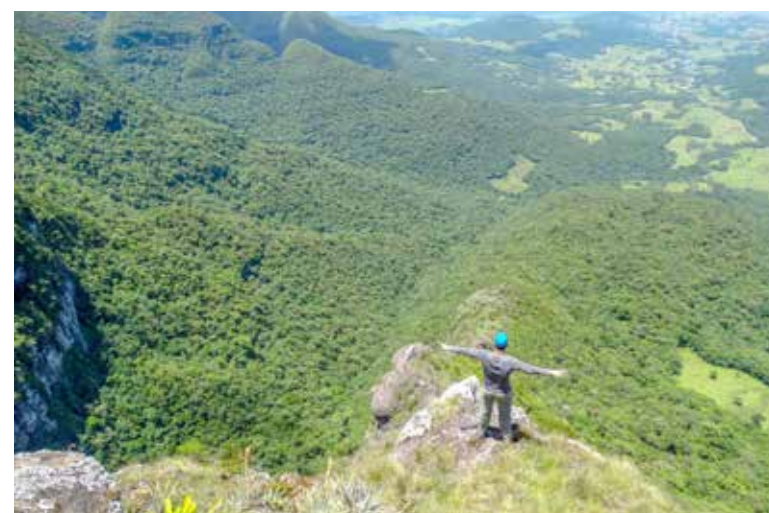
Trecking pelo Cânion Tajuvas

Um dos pontos altos do percurso na natureza durante a subida pelo entorno do cânion Tajuvas é a presença de miradores com vista direcionada para o leste, de onde inclusive pode-se enxergar o mar em dias claros. No percurso também há os vales das cidades