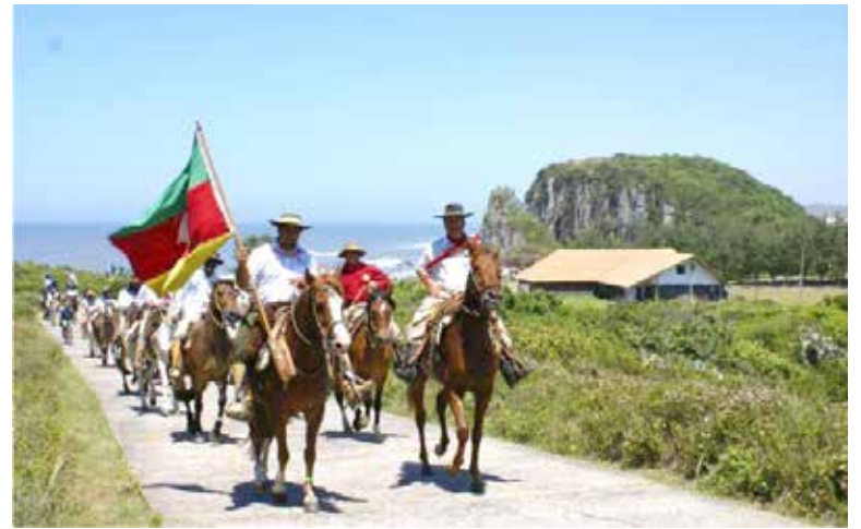
FOTO DE ARQUIVO: Em 2019, Cavalgada do Mar passando pelo Parque da Guarita

A Cavalgada do Mar já foi reconhecida pelo Guinness Book como o maior evento festivo de cavaleiros e amazonas do mundo.