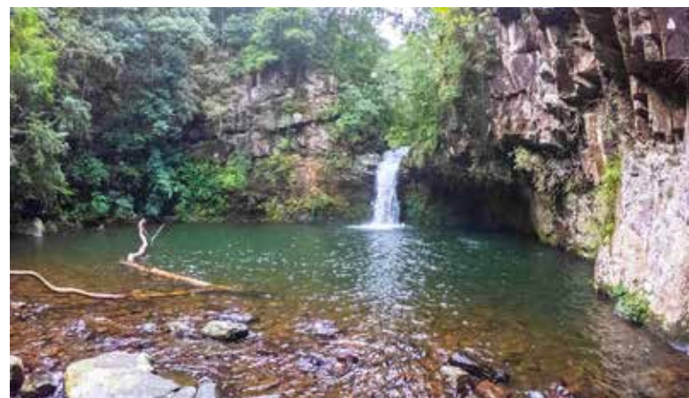
Poço das Andorinhas, em Três Cachoeiras

e declives acumulados, com vários trechos sem trilha demarcada.