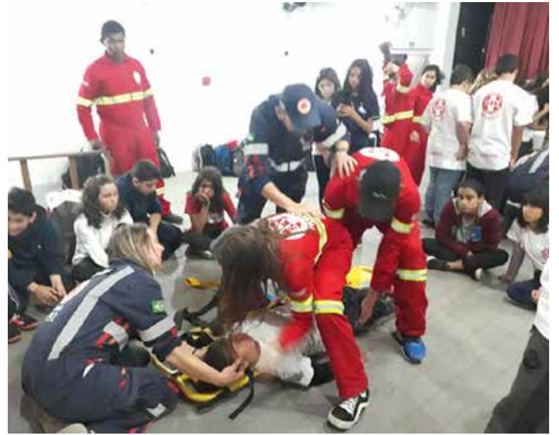
Conhecimentos aplicados no projeto já ajudaram a salvar vidas em Torres

poder público assegurar, com absoluta prioridade, a efetivação dos direitos referentes à vida, à saúde, à alimentação, à educação, ao esporte, ao lazer, à profissionalização, à cultura, à dignidade, ao respeito, à liberdade e à convivência familiar e comunitária das crianças, incluindo a primazia de receber proteção e socorro em quaisquer circunstâncias. E para finalizar o autor lembra que os acidentes em geral ocorrem de forma repentina e sem previsões, e que o primeiro atendimento realizado efetivamente fará toda a diferença. Portanto, repete que isto justifica a escalada de importância do Projeto Primeiros Socorros Salvando Vidas e Resgatando Almas para o status de Patrimônio Imaterial e cultural da cidade de Torres, a ementa da Indicação encaminhada para a prefeitura.