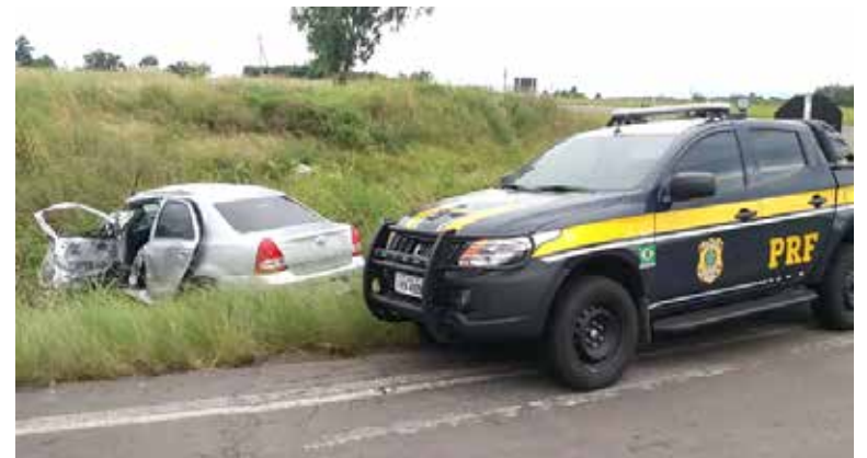
Veículo chegou a ser arrastado após sofrer colisão em Santana do Livramento

tão de álcool. O Corpo de Bombeiros e Serviço de Atendimento Móvel de Urgência (Samu) atenderam a ocorrência, além da PRF. (FONTE – Correio do Povo)