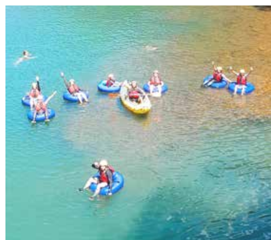
Boia Cross em Praia Grande