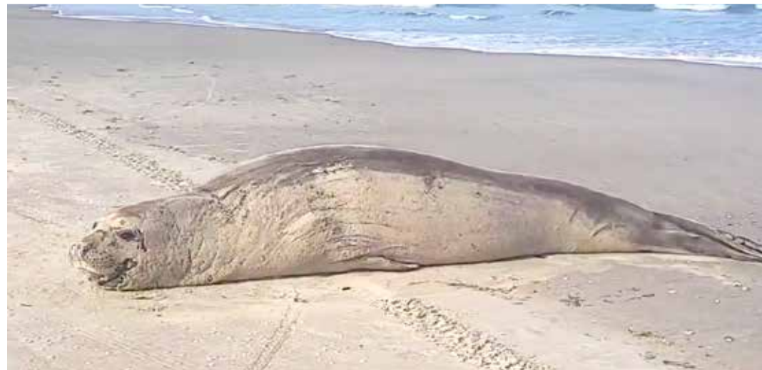
Elefante-marinho-do-sul no Passo de Torres

lizações e passam perto, estressando o animal. Ainda não estamos livres da gripe aviária, possivelmente teremos um inverno complicado para esses animais. Então, ao avistar um na praia, mantenha distância, não deixe seu pet se aproximar e avise imediatamente o órgão ambiental responsável", conclui Roger Maciel.