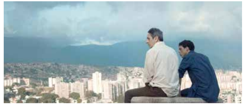
Cena do filme "De Longe te Observo"

O Cineclube Torres é uma Associação sem fins lucrativos, Ponto de Cultura pela Lei Cultura Viva e Ponto