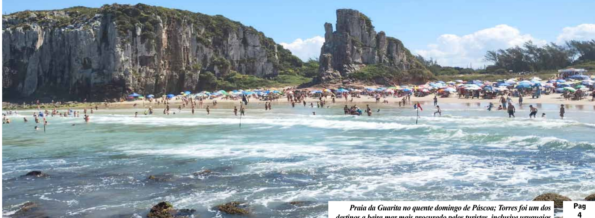
Praia da Guarita no quente domingo de Páscoa; Torres foi um dos destinos a beira mar mais procurado pelos turistas, inclusive uruguaios