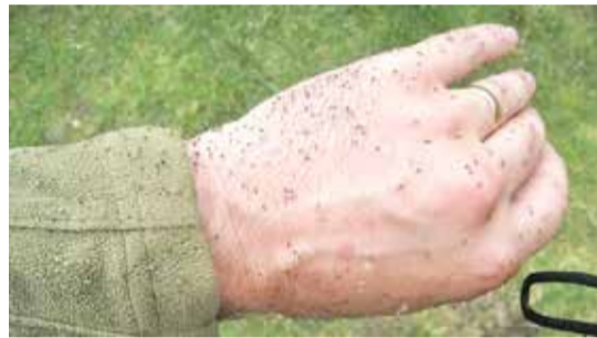
Vários Mosquitos Maruim na mão de uma pessoa