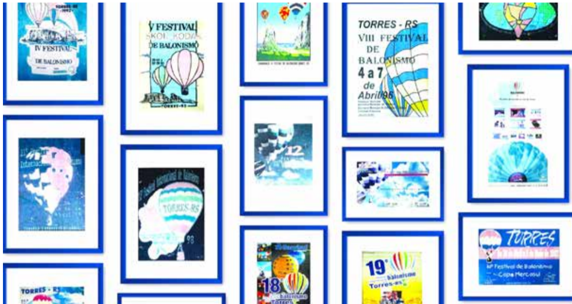
Banners de algumas das edições passadas do Festival em Torres

A expectativa dos idealizadores do balonismo havia sido alcançada. O sucesso do Festival de Balonismo entrou numa crescente ao longo dos anos. Em 1999, o evento se tornou internacionalmente reconhecido e mudou seu nome para Festival Internacional de Balonismo. Pessoas do mundo inteiro vêm para ver ou participar do evento. A realização anual do festival criou uma expectativa muito grande para a cidade, impactando a vida de muitos. Apesar da sede do evento ser no Parque do Balonismo, um local específico, os balões sobrevoam todo o município, o que faz com que a comunidade em geral, viva o clima do Festival.