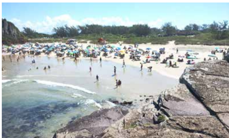
Praia da Guarita foi um dos destinos a beira mar mais procurado pelos turistas uruguaios

Feriado de uma semana dos uruguaios, tempo bom e mar transparente foram os ingredientes do evento de 2024