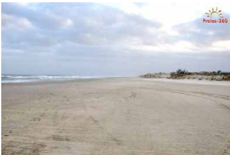
Praia Areias Brancas

RT 920 Capão da Canoa/Torres/Ulbra RT 913 Capão da Canoa/Xangri-lá/Osório/Facos