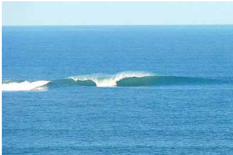
Onda perfeita quebrando sozinha na Ilha dos Lobos

o desenvolvimento sustentável da região."