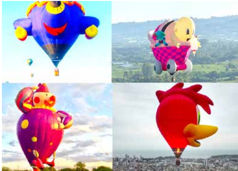
Alguns dos balões de formato especial que marcarão presença em Torres

emocionantes, shows nacionais de prestígio e muita diversão