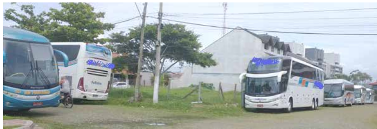
Regulamentação foi feita para evitar casos como os acima, recorrentemente reclamados por moradores e veranistas de praias do centro da cidade (em especial no verão)

É de praxe que a prefeitura, após a promulgação da Lei pelo prefeito, produza uma espécie de manual de instruções para os operadores de turismo e donos de Motor Home possam verificar as regras antes de vender seus pacotes ou iniciar visitas turísticas em Torres. Isto deve ser realizado provavelmente para o verão que vem, através da regulamentação do PL, que pode ainda receber vetos do prefeito.