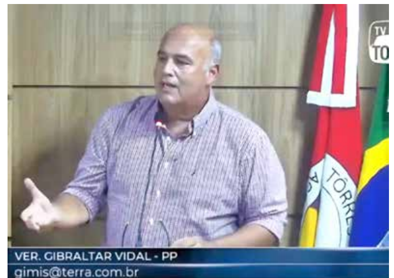
Responsabilidade Fiscal, e que o impacto financeiro dos subsídios proposto na lei vetada ameaçaria esta obrigação.