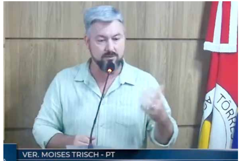
Critico das privatizações da CEEE e Corsan, parlamentar sugere que possa haver privatização do PA de Torres

O opositor fez uma lista de problemas no PA 24h que, para ele, são causados para ele pelo por falhas em etapas anteriores e pela falta de atenção à estrutura do PA – que em sua opinião se encontra precário, com déficit em recursos humanos e com instalações necessitando de reparos básicos: “O aumento de demanda no pronto atendimento tem causado esperas de até 5 horas na fila”, afirmou o vereador. “O lugar está com falta de leitos, falta de manutenção e parece estar sendo sucateado. E esta situação pode ser um sinal para que