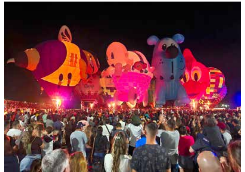
Um dos Night Glow's de 2023

nove balões de formato especial, além da participação do balão do Rio Grande do Sul. Já estão confirmados os balões com formato de Avião, Baby Car, Coração, Gota Dourada, Palhaço, Pica Pau e Zancão. Em todos os Festivais estes balões com formatos diferenciados dão um show à parte, encantam pequenos e grandes.