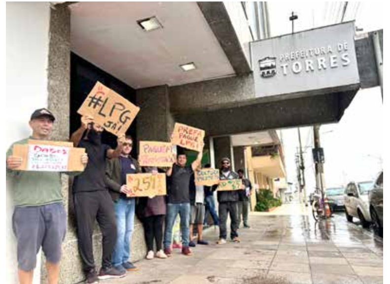
Representantes da Cultura foram para a frente da Prefeitura e levaram cartazes com suas demandas

Cultura), Torres teria recebido no dia 02 de agosto de 2023 (mais de 250 dias atrás) cerca de R$256 mil para o Audiovisual e cerca de R$103 mil para outras áreas da cultura. Entretanto, conforme o mesmo painel de dados, apenas 1,33% destes valores havia sido repassado aos agentes culturais de Torres contemplados pela LPG.