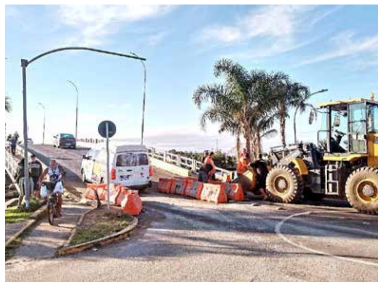
Ponte que cruza o Rio Mampituba, com barreiras de concreto sendo instaladas na quarta-feira

dadões questionando os engarrafamentos, provocados em especial na Avenida Benjamin Constant (Torres) e Rua Manoel Laurentino Machado (Passo de Torres), em decorrência das barreiras na ponte e consequente lentidão no trânsito.