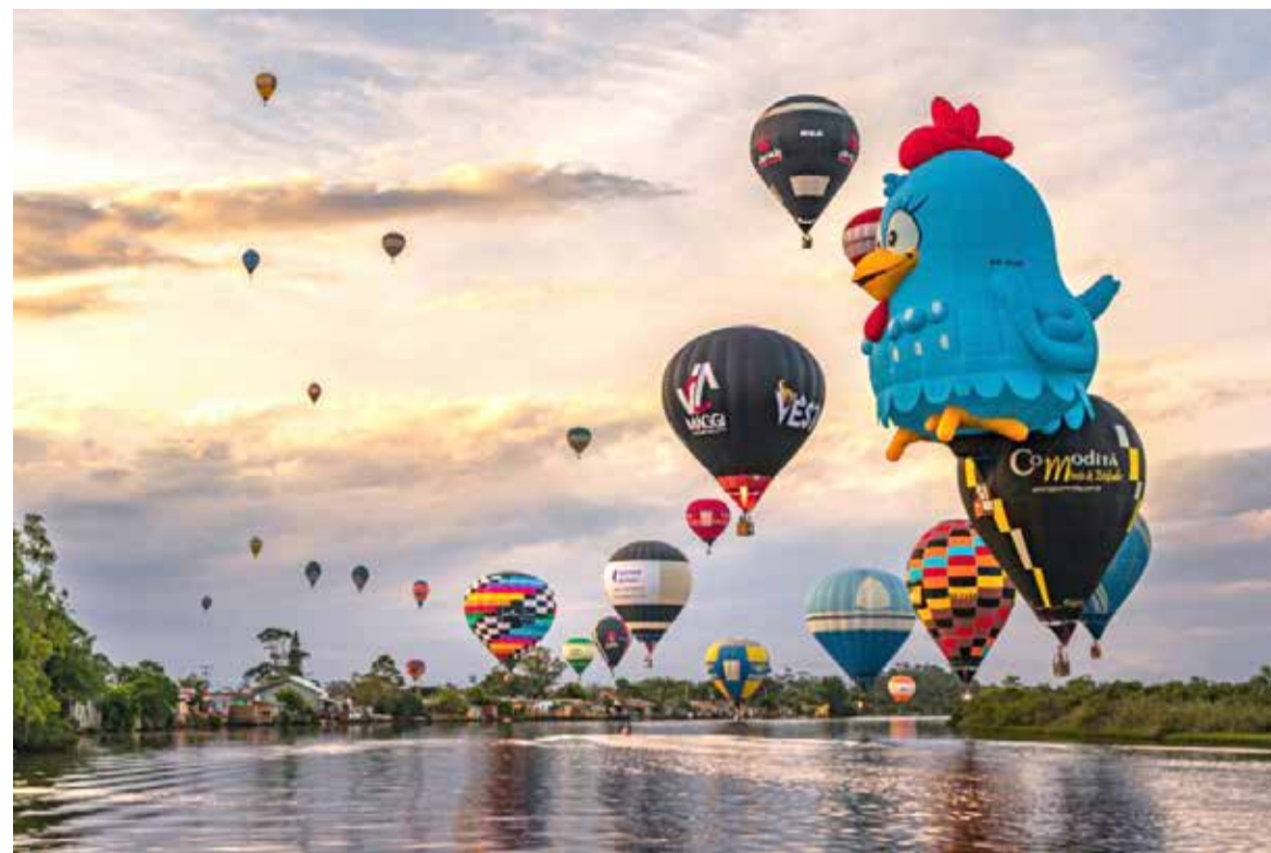
Balonismo em Torres

presença. A programação vem sofrendo alterações frequentes nas datas e horários pelos organizadores - mas até quinta-feira (25), ela estava assim: