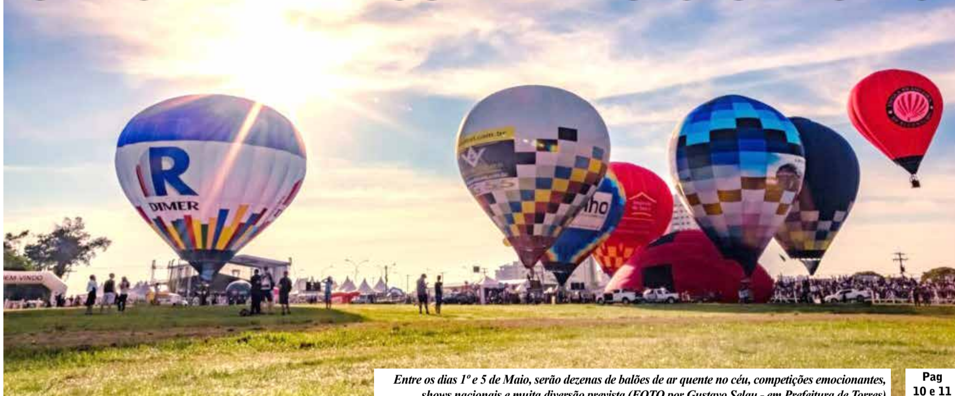
Entre os dias 1º e 5 de Maio, serão dezenas de balões de ar quente no céu, competições emocionantes, shows nacionais e muita diversão prevista