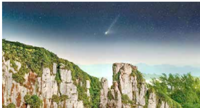
Imagem feita pelo astrofotógrafo Gabriel Zapparoli mostra passagem do "Cometa do Diabo" pelo céu de Torres (Crédito: Gabriel Zapparoli)

Segundo o Observatório Nacional (ON), desde o dia 7 de abril, observadores na região Nordeste do Brasil já têm conseguido fazer registros da passagem do cometa, mas foi no domingo (21) que ele atingiu a sua máxima aproximação ao Sol. No hemisfério Sul, a janela para observação do cometa deve seguir até junho. Segundo destacado pela CNN Brasil, para tentar avistar o Cometa do Diabo, os observadores devem olhar na direção oeste, próximo ao horizonte, pouco após o pôr do Sol, momento no qual o cometa deve estar mais visível. Em abril, o Cometa do Diabo estará abaixo da constelação de Touro e, em maio, abaixo da constelação de Órion.