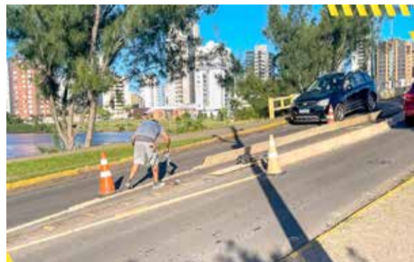
Município do Passo de Torres também instalava barreiras na ponte nesta quarta (24)

de alerta, que já constavam no local, além de destacamento de funcionários para fiscalização do trânsito. Ainda, na quarta-feira (24) já estavam sendo instaladas barreiras físicas de concreto, objetivando o estreitamento da via. Também está sendo analisada a instalação de limitador de altura, medidas que evi-