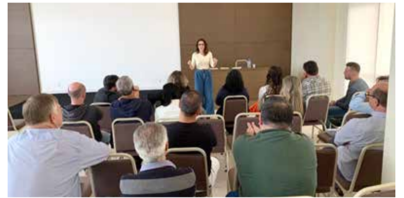
Torrenses que estão se colocando à disposição do partido participaram do treinamento técnico