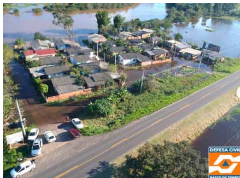
Rio Mampituba subiu e alagou comunidades do Passo

A situação parece estabilizar, mas para aqueles que necessitarem de