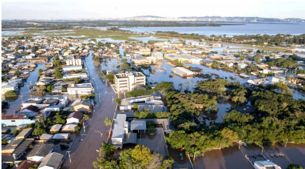
Eldorado do Sul foi uma das cidades mais atingidas pelas enchentes

No meio da tarde desta terça-feira (14/5), o valor de doações via pix do SOS Rio Grande do Sul para vítimas das enchentes chegou a R$ 101,3 milhões. A marca foi alcançada 12 dias depois de iniciada a campanha idealizada pelo governo do Estado e conduzida, também, por um grupo de entidades privadas. Como a decisão do Comitê Gestor foi de conceder R$ 2 mil para cada beneficiado, cerca de 50 mil famílias atingidas pela tragédia meteorológica receberam esse valor.