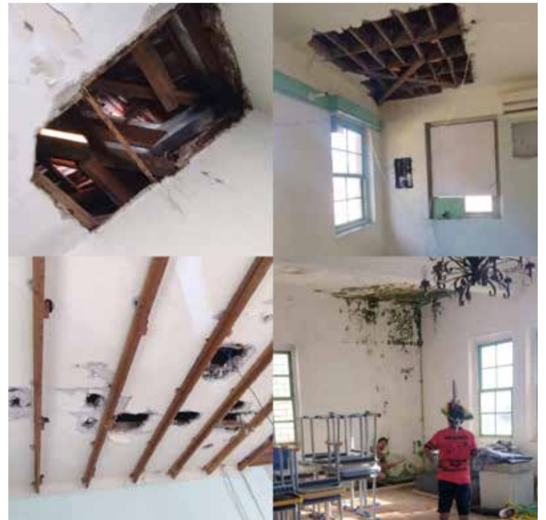
FOTO - Imagens evidenciam situação crítica em várias partes do interior do prédio''