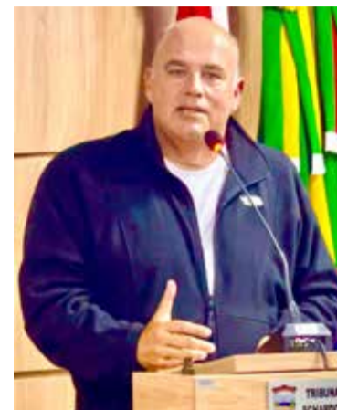
Covid-19, foi liberado 2 bilhões de reais ante os R$ 4,9 bilhões sancionados pelo governo Lula para este ano", exemplifica Gimi.

ao orçamento no ano de 2023 em comparação com 2022". A nota deduz que "o valor autorizado para captação neste ano de 2024 seria, então, de mais de R$ 16 bilhões".