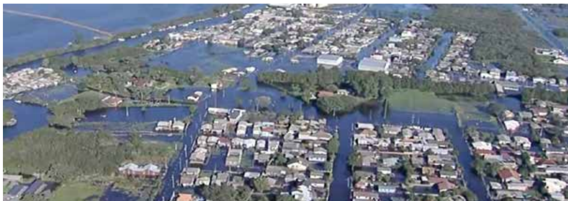
Cheias em Palmares do Sul

Até esta semana, municípios do Litoral Norte não haviam sido atingidos diretamente com as enchentes que assolam o estado. No entanto, com a cheia da laguna dos Patos, Palmares do Sul começou a ser afetado especialmente a partir de segunda-feira (13/5) e, em alguns