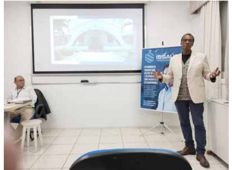
Representante da do IBSaúde (d) veio à Torres para apresentar programa de uso de mais de R$ 500 mil no HNSN, por conta da crise decorrente das enchentes

O programa foi aprovado, somente com um voto "com ressal-