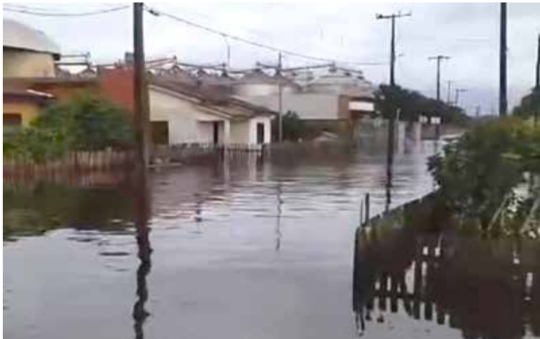
Enchentes em Palmares do Sul

Após análise da Defesa Civil estadual houve redução de 397 para 46 no número de municípios gaúchos classificados na condição de calamidade pública, já em situação de emergência são 320 municípios. Conforme o órgão, nos primeiros dias da catástrofe, todos os municípios que reportaram danos de chuvas foram sumariamente colocados em estado de calamidade, sem análise prévia. A classificação permitiu que o Estado destinasse legalmente recursos diretamente aos municípios, sem contrapartidas.