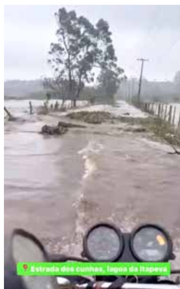
Situação na Estrada dos Cunhas na segunda-feira (13)