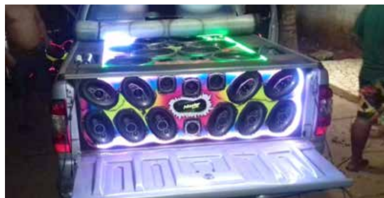
Som automotivo

colocação de competições ou mostras desta categoria no calendário programado, para buscar turismo na cidade de Arroio do Sal junto aos já vários outros eventos programados pela municipalidade. Portanto considera sua demanda um assunto de ganhos coletivos para a cidade. E eventual perturbação do sossego alheio por parte do volume alto destes mesmos aparatos de som automotivos não foi citada.