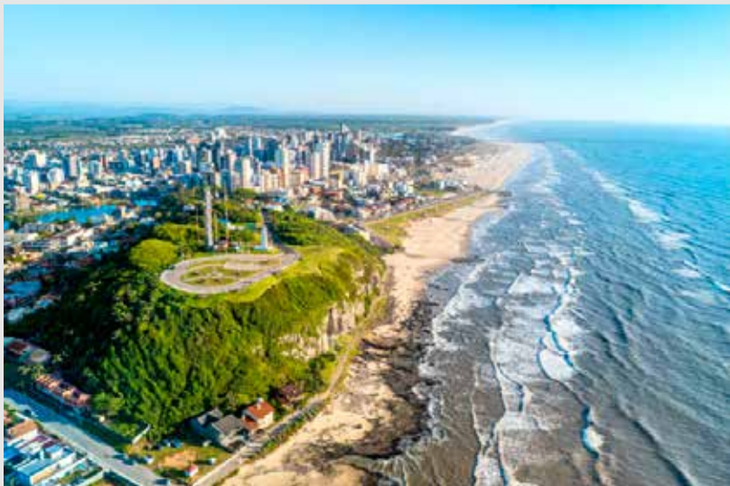
Morro do Farol

TORRES - Em decorrência da chuva intensa que caiu sobre o município de Torres no final de semana passado, a Prefeitura, por meio da Defesa Civil do município, alertou sobre uma situação potencial de deslizamento de encostas no Morro do Farol. A Defesa Civil desde o dia 9 de maio, esteve em contato com os moradores da região, recomendando que estes bus-