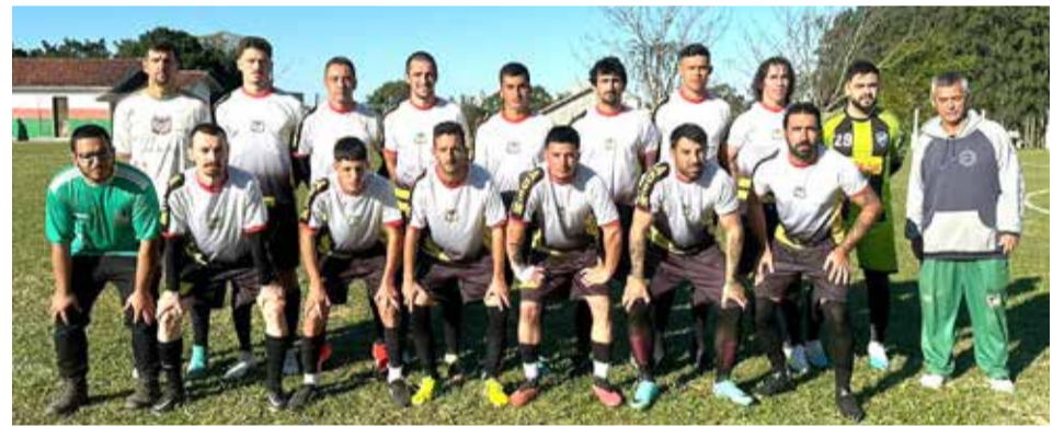
Plantel do ADEM

Neste domingo (07) serão realizados jogos em quatro campos (partida dos aspirantes as 13h15 e dos titulares às 15h15). No São Brás, com São Brás X Adem; no São João, com disputa entre São João X Boa União e no campo do CEI com jogo entre Rola e Toca X Guarani. O jogo do Vila Nova X Meia Boca ainda não tem campo confirmado".