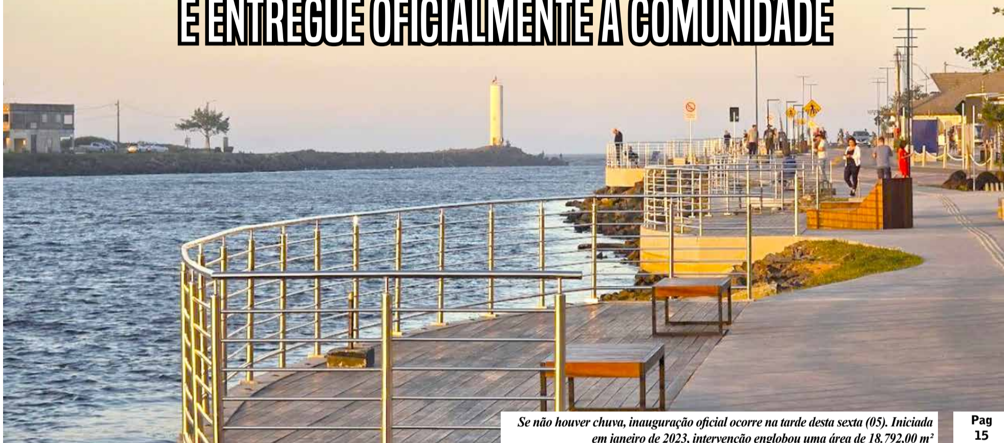
Se não houver chuva, inauguração oficial ocorre na tarde desta sexta (05). Iniciada em janeiro de 2023, intervenção englobou uma área de 18.792,00 m²