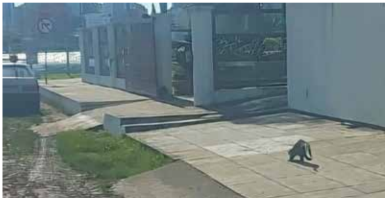
Lontra 'passeando' pela Rua São Pedro, próximo da lagoa

Aqui em Torres, cenas no mínimo curiosas tem ocorrido recentemente: lontras têm sido avistadas caminhando em calçadas e no meio de diversas ruas. Alguns casos tem sido relatados nos arredores da Lagoa do Violão e em ruas da Praia da Cal - e os animais também já teriam sido vistos até em locais mais urbanizados, como na Avenida José Bonifácio e Avenida Alfieiro Zanardi.