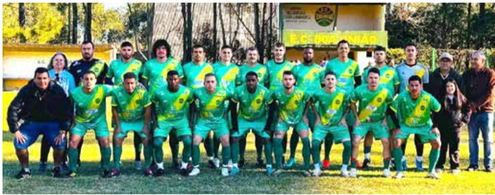
Plantel do Boa União

Neste domingo, 30 de junho, foram realizados mais três jogos complementares simultâneos da primeira rodada do Campeonato Municipal de Futebol de Campo de Torres 2024. As rodadas deste domingo ocorreram paralelamente em três campos: no Campo do São Jorge/Valter Mi-