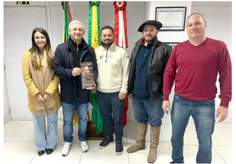
do rodeio está disponível no site do CTG Porteira Gaúcha. Ingressos e mais informações pelo: (51) 96114-0775.

Além das modalidades campeiras, o rodeio também oferece: Shows musicais com artistas locais e nacionais, Apresentações artísticas de CTGs, Concurso de Rainha do Balonismo, Torneio de truco, Venda de produtos típicos, Praça de alimentação, entre outros. A programação completa