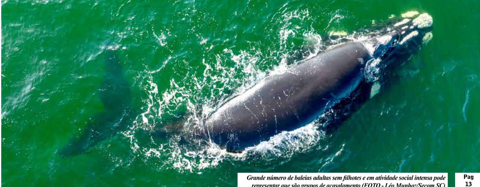
Grande número de baleias adultas sem filhotes e em atividade social intensa pode representar que são grupos de acasalamento