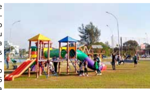
Praça da Lagoa do Violão movimentada nesta quarta (24)

A rede estadual de ensino do RS, iniciou o recesso escolar na segunda-feira (22), com o retorno sendo dia 05. O município catarinense de Passo de Torres,