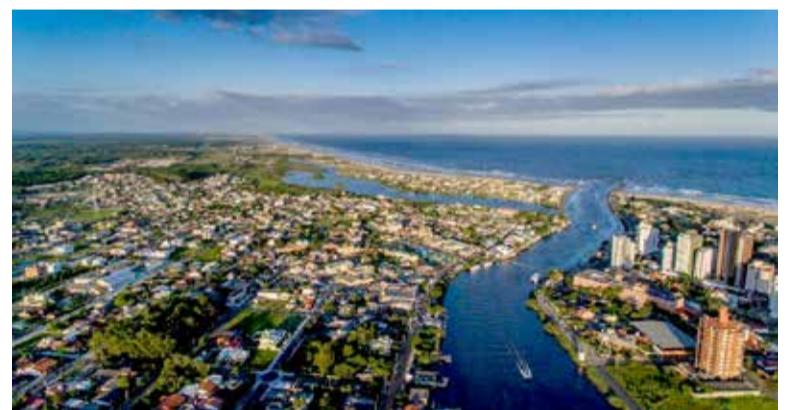
FOTO DE ARQUIVO – Vista Aérea do Passo de Torres (em Facebook – Prefeitura de Passo de Torres)