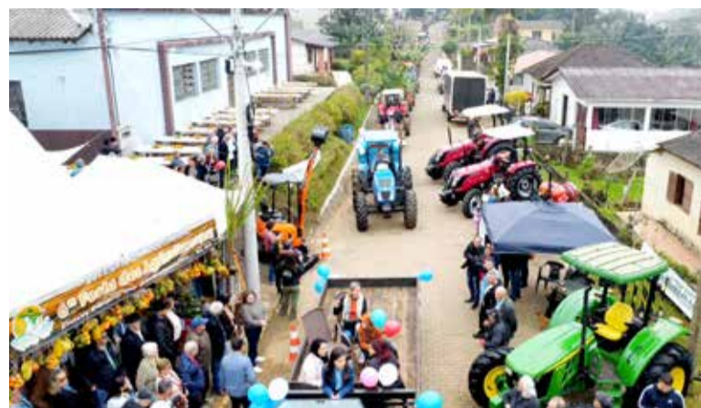
Procissão de cerca de 100 veículos agrícolas, foi um dos pontos altos do evento

Durante a tarde, a Praça do Imigrante recém revitalizada foi o centro das atividades. O público desfrutou de música ao vivo com Ricardo Lima & Jeje, brincadeiras, espaço kids e exposições de implementos agrícolas. Stands de produtos coloniais, artesanatos e de itens relacionados à agricultura também marcaram presença. Após, a Tarde da Maturidade no