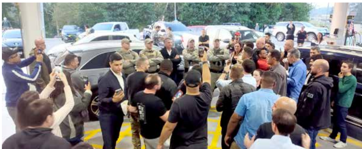
Bolsonaro, durante parada em posto de combustível de Torres

Conforme informações recebidas por A FOLHA Torres, o ex-presidente do Brasil (de 2018 a 2022) pousou no Aeroporto de Jaguaruna (em Santa Catarina) e veio ao RS por via terrestre, para cumprir compromissos de apoio a algumas pré-candidaturas. Na sexta, Bolsonaro deverá cumprir agenda em Porto Alegre, onde participará, à noite, da convenção do PL na Casa do Gaúcho. Ele também pretende visitar municípios da Serra Gaúcha e Região Metropolitana.