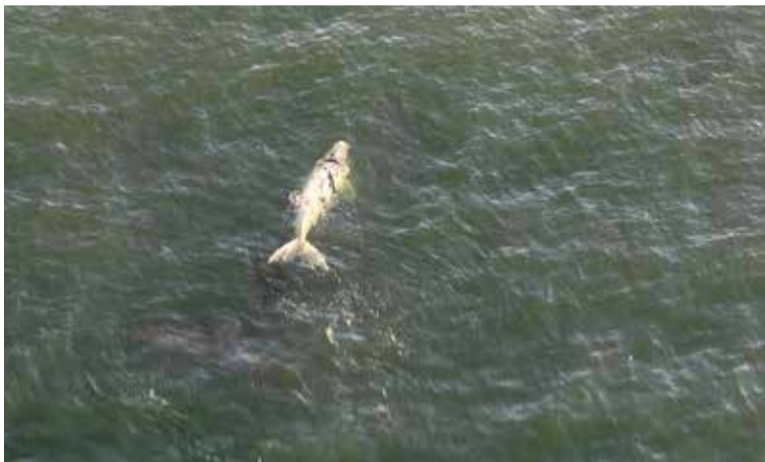
Filhote semialbino foi uma das baleias avistadas

O Programa de Monitoramento do Porto de Imbituba 2024 está ocorrendo desde a última semana de junho e segue até novembro. Além dos sobrevoos, diariamente equipes de campo realizam a observação terrestre a partir de pontos fixos nas praias do Porto e Ribanceira em Imbituba.