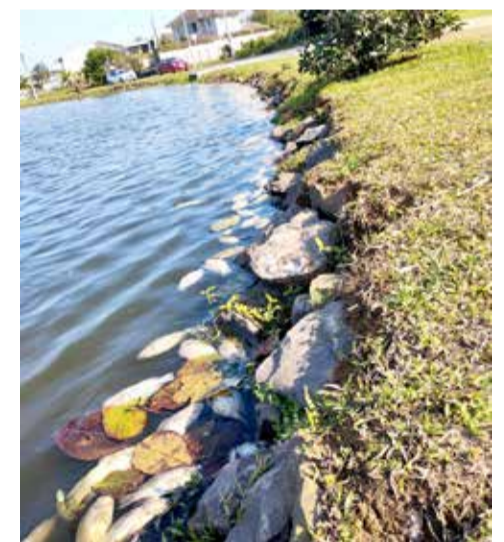
de espécies variadas de peixes”.

visto que fatores como a falta de oxigenação na coluna d’água e/ou suposta de degradação ambiental, implicariam na morte