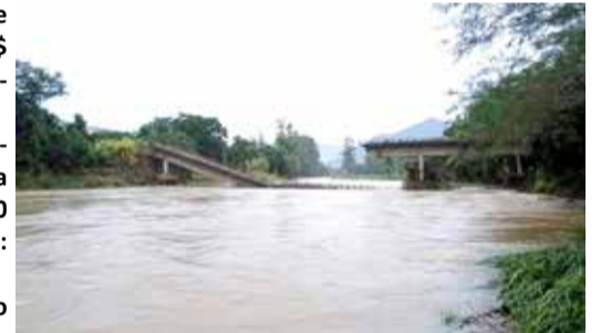
Ponte entre Três Forquilhas e Itati, que caiu no dia 04 de maio

- Três Forquilhas – Situação de Emergência / Valor: R$ 150.000,00 – Data da