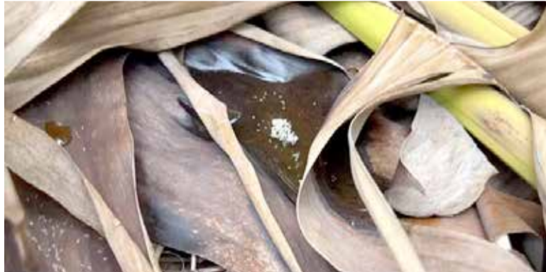
Larvas de mosquito nas folhas de bananeira em Dom Pedro de Alcântara