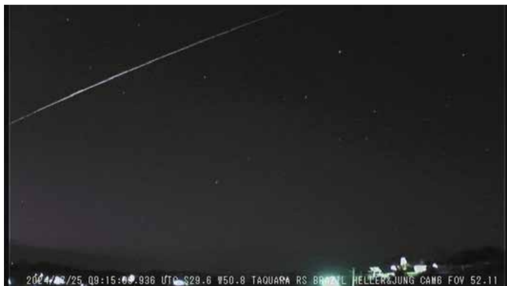
Meteoro foi visto cruzando o céu no RS

O observatório espacial Heller & Jung, localizado em Taquara, na Região Metropolitana de Porto Alegre, registrou em vídeo a passagem de um meteoro sobre a região do Litoral do Rio Grande do Sul na madrugada desta quin-