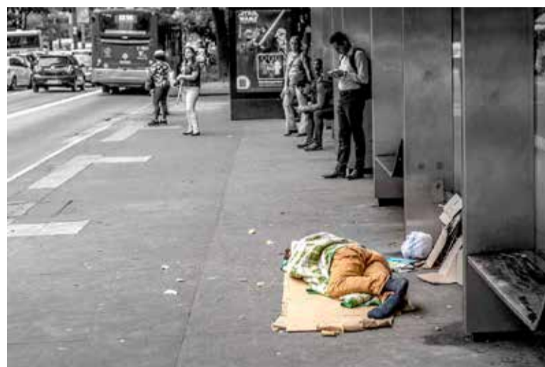
Imagem meramente ilustrativa: Pessoa em situação de rua

Os questionamentos foram respondidos antes das enchentes de maio deste ano. Com a calamidade humanitária e ambiental que