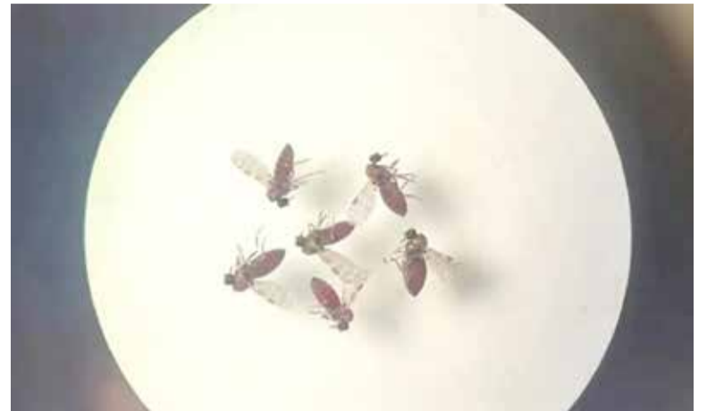
Mosquito-pólvora, ou maruim

As amostras foram analisadas pela Fundação Oswaldo Cruz (Fiocruz-RJ), que confirmou a identificação da espécie nos municípios de Mampituba e Três Forquilhas (ambos na região de Torres). Ao mesmo tempo, a Seapi identificou a presença da espécie nos municípios de Dom Pedro de Alcântara e Mampituba na região de Torres – além de Itati, Maquiné e Terra de Areia.