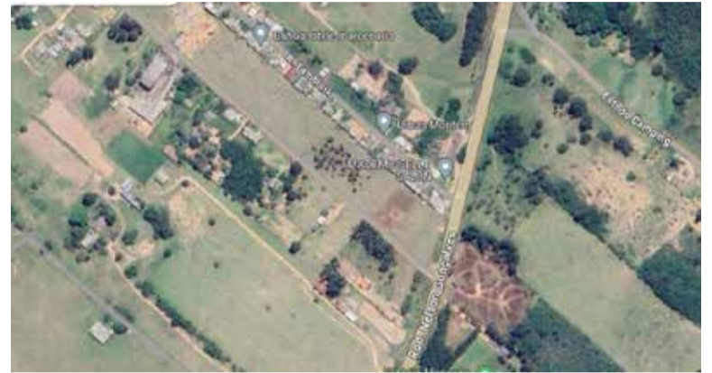
Imagem parcial da região do Tamburiki (Via Google Maps)