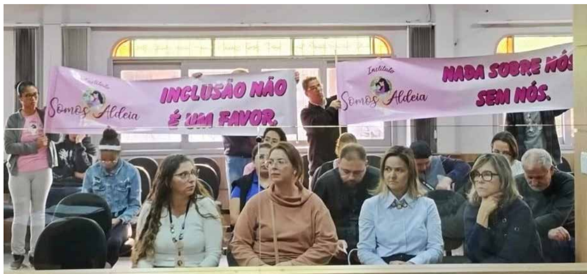
Movimento de familiares de pessoas com deficiência “Somos Aldeia” foi um dos que compareceu à Casa Legislativa