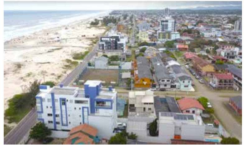
Imagem de Arroio do Sal em 2023

“Este acordo histórico entre o MPF, MPRS, Corsan e o município de Arroio do Sal é um testemunho do poder da colaboração interinstitucional e do compromisso com o bem-estar dos cidadãos. Ele não só resolve uma pendência judicial de longa data, mas também estabelece um precedente para futuras iniciativas de saneamento em outras regiões, demonstrando que é possível alinhar desenvolvimento urbano, saúde pública e sustentabilidade ambiental de maneira