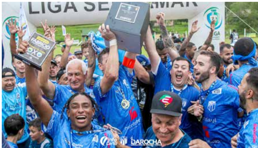
Festa do Mar Azul após conquista do título em 2023

A 37ª edição da Taça Serramar de Futebol está chegando, com seu calendário já definido. Considerada uma das principais competições amadoras de futebol do Rio Grande do Sul, em 2024 a Taça Serramar Banrisul reunirá 8 equipes do Litoral Norte e do pé da serra gaúcha. O jogo de abertura do campeonato será dia 01/09 (domingo), direto do Canto da Ronda, em Torres, entre o atual bicampeão Mar Azul e a equipe Capão da Canoa FC. O jogo preliminar, da categoria sub-13, ocorre às 13h30, com o jogo da categoria adulto rolando a partir das 15h30.