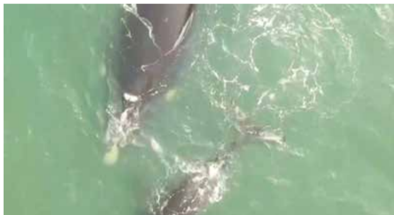
Avistamento de baleias em Torres (registro entre 12 e 17 de agosto)