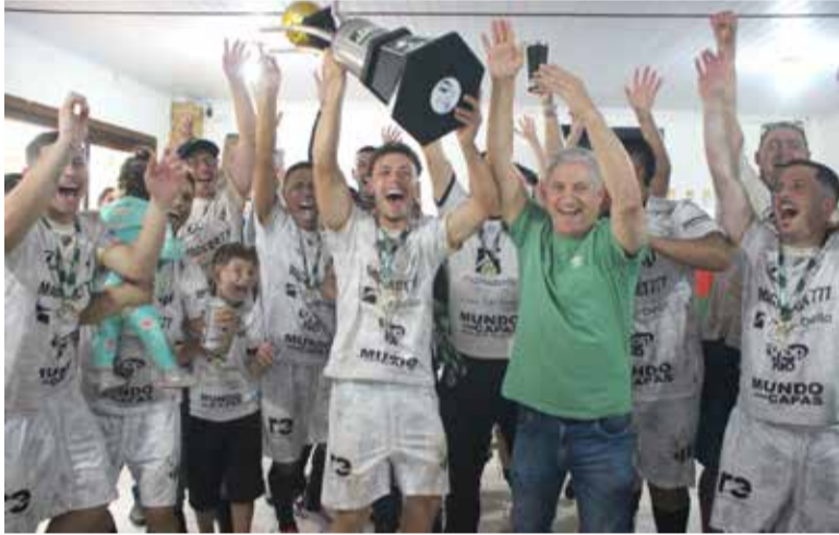
Pelos Aspirantes, São João foi a equipe campeã