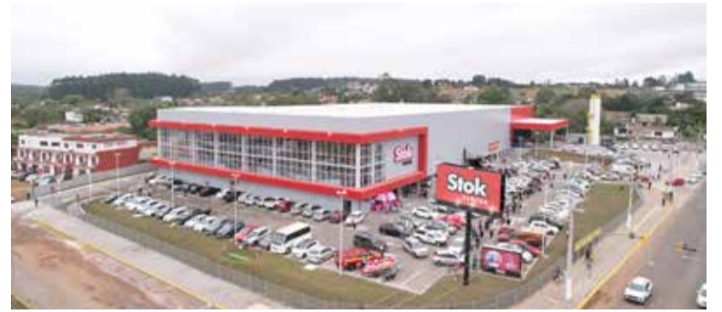
O Stok Center de Torres está localizado na Av. Castelo Branco, 2380, Bairro São Jorge, com horário de

Para celebrar a inauguração, a loja oferece mais de 300 ofertas especiais, válidas também para compras online. Os clientes que se cadastrarem no Clube Stok Center e informarem o CPF no caixa podem garantir os descontos. O cadastro é gratuito e pode ser feito pelo aplicativo "Clube Stok Center", disponível para iOS e Android.