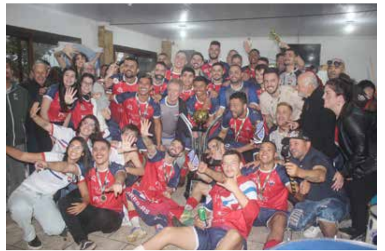
Festa da equipe do Vila Nova, que conquistou título inédito